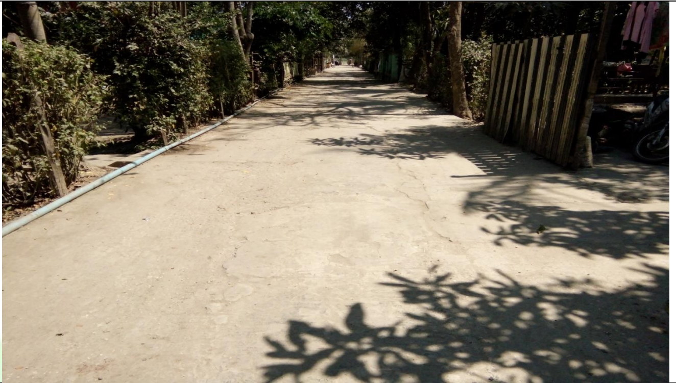
လုပ်ငန်းခွဲ၏မပြုလုပ်မီ မှတ်တမ်းဓာတ်ပုံ