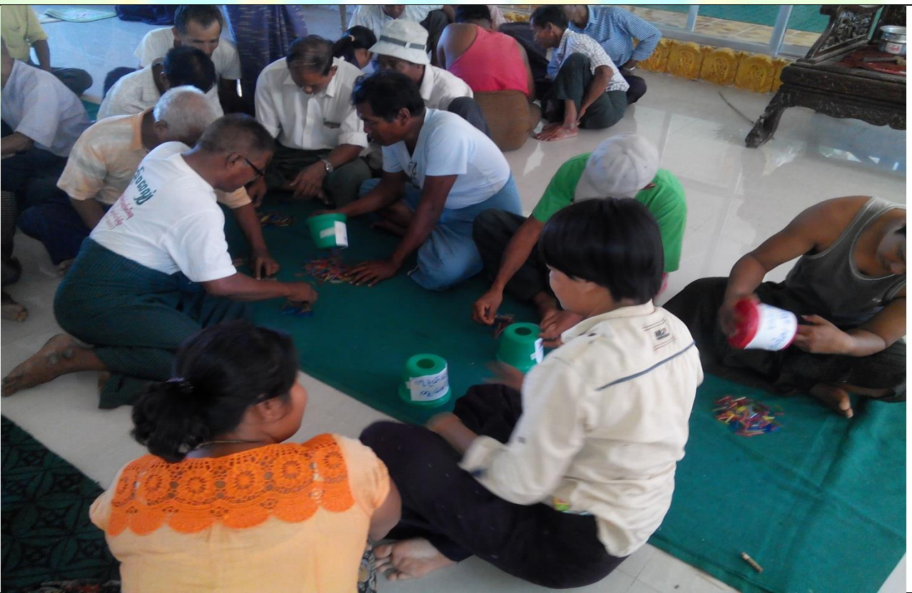
စေတနာ့ဝန်ထမ်းများ ရွေးချယ်ခြင်းမှတ်တမ်းဓာတ်ပုံ