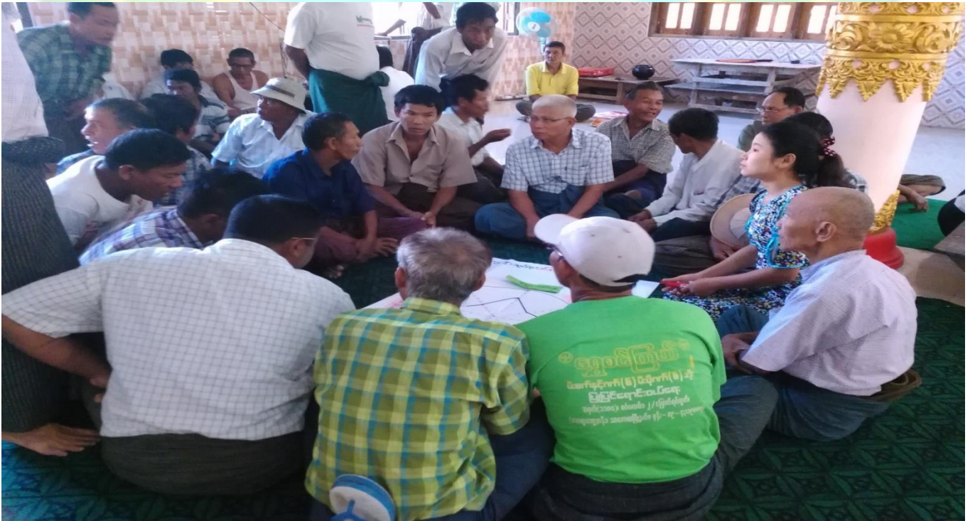
အမျိုးသား အုပ်စု မှတ်တမ်းတင်ခါတ်ပုံ။