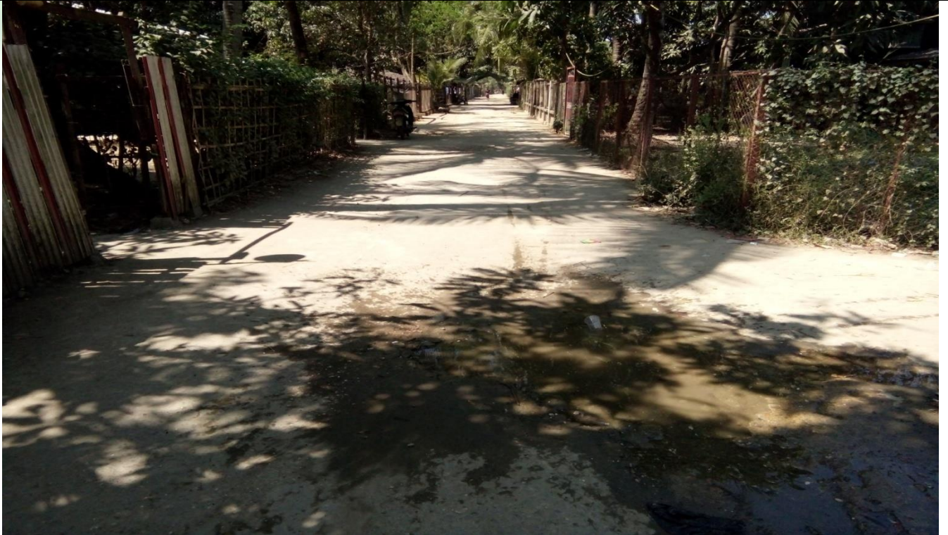
လုပ်ငန်းခွဲ၏မပြုလုပ်မီမှတ်တမ်းဓာတ်ပုံ