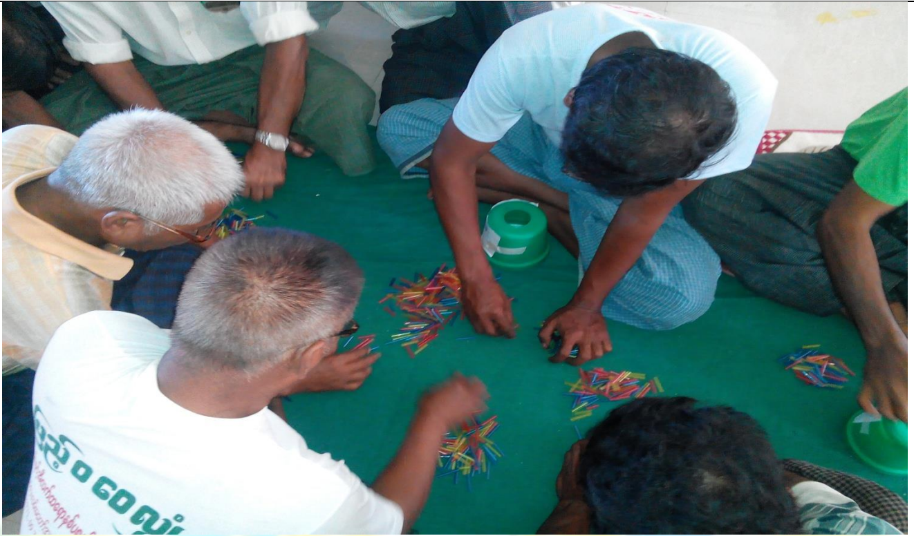
ကော်မတီရွေးချယ်ခြင်း မှတ်တမ်းဓာတ်ပုံ