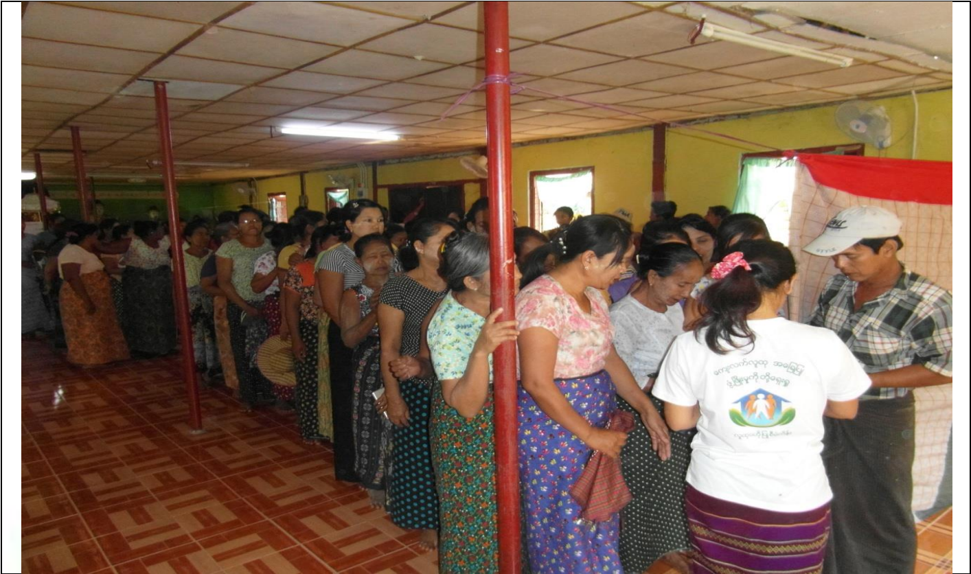
ကော်မတီရွေးချယ်ခြင်း မှတ်တမ်းဓာတ်ပုံ