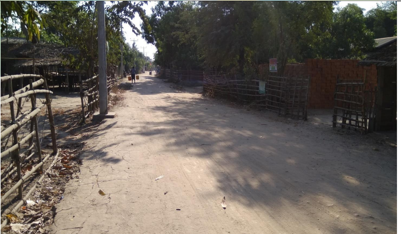
လုပ်ငန်းခွဲ၏မပြုလုပ်မီမှတ်တမ်းဓာတ်ပုံ