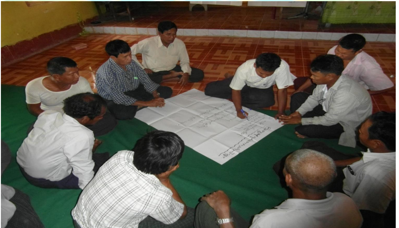
အမျိုးသား အုပ်စု မှတ်တမ်းတင်ခါတ်ပုံ။