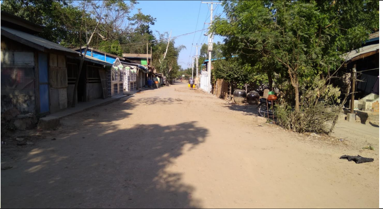
လုပ်ငန်းခွဲ၏မပြုလုပ်မီ မှတ်တမ်းဓာတ်ပုံ