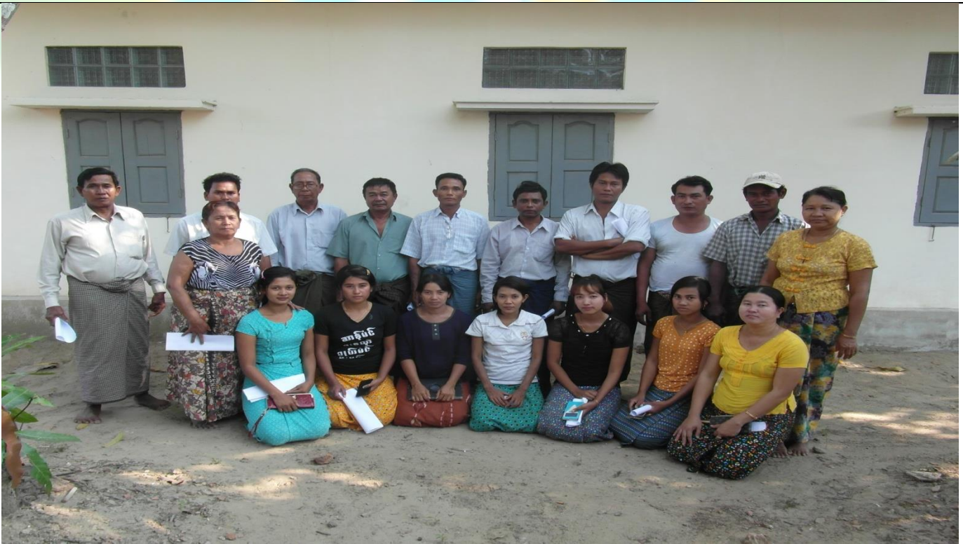
ကော်မတီဝင်များ မှတ်တမ်းဓာတ်ပုံ