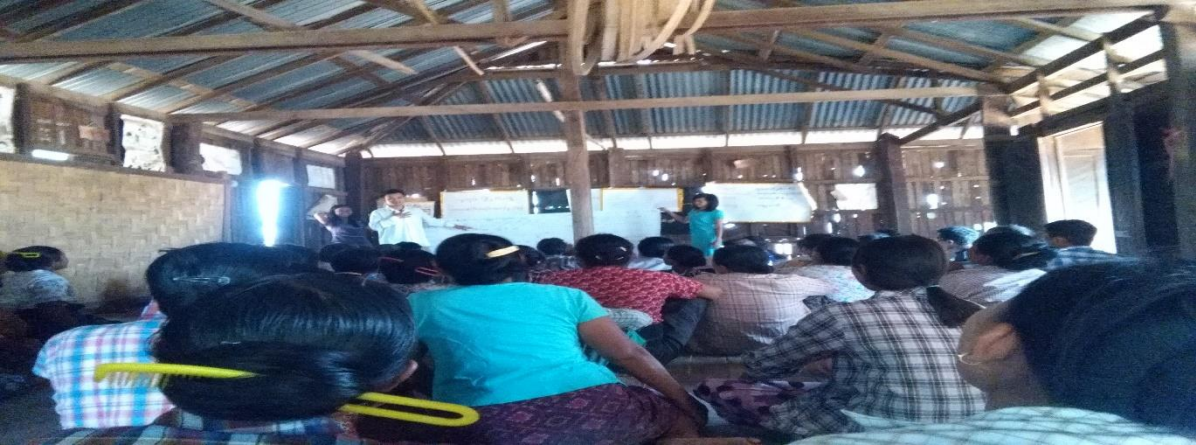
(၂) ကျေးရွာသူရွာသား များကိုယ်တိုင် ပူးပေါင်းပါဝင် လုပ်ဆောင်ခြင်း မှတ်တမ်းဓါတ်ပုံ

၇။ ကော်မတီဝင်များ ရွေးချယ်ခြင်းနှင့် ကျေးရွာဖွံ့ဖြိုးရေးအစီအစဉ် ဆောင်ရွက်မှု မှတ်တမ်းဓါတ်ပုံများ (၁)အမျိုးသားအမျိုးသမီး ပူးပေါင်းပါဝင်သော လူမှုဆန်းစစ်ခြင်း