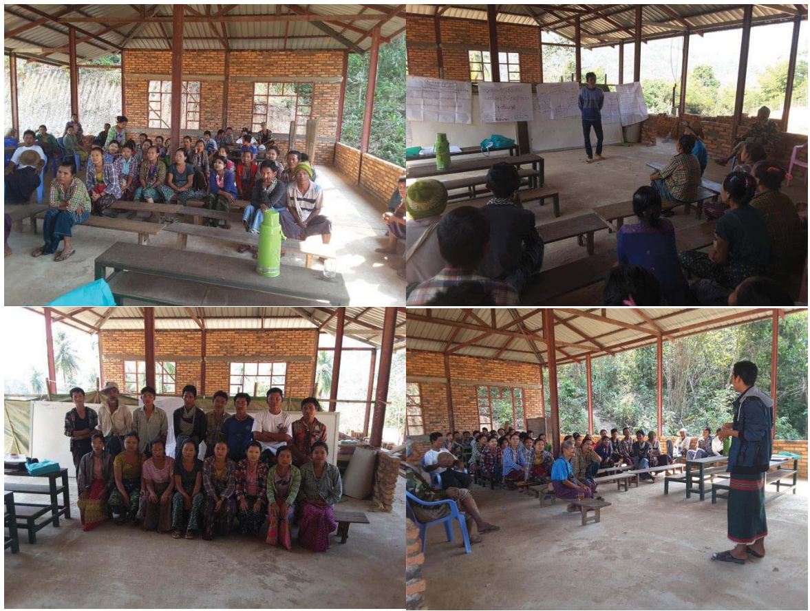
၇။ကော်မတီဝင်များရွေးချယ်ခြင်းနှင့်ကျေးရွာဖွံ့ဖြိုးရေးအစီအစဉ်ဆောင်ရွက်မှုမှတ်တမ်းဓာတ်ပုံများ