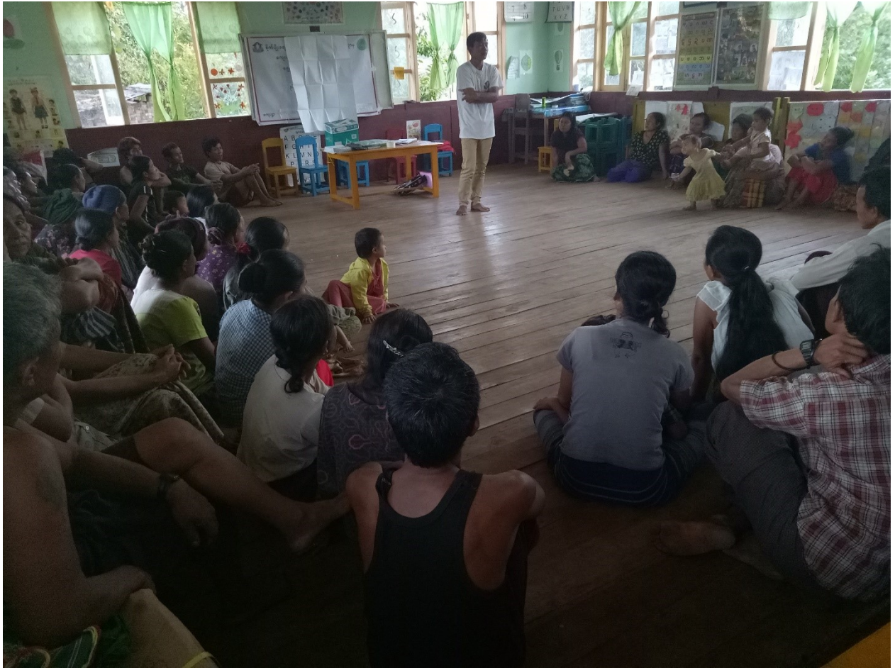
၈။ တော်ဝန်သစ်ကူးရွာ၏စီမံကိန်းအထောက်အကူပြုကျေးရွာကော်မတီဝင်များစာရင်း