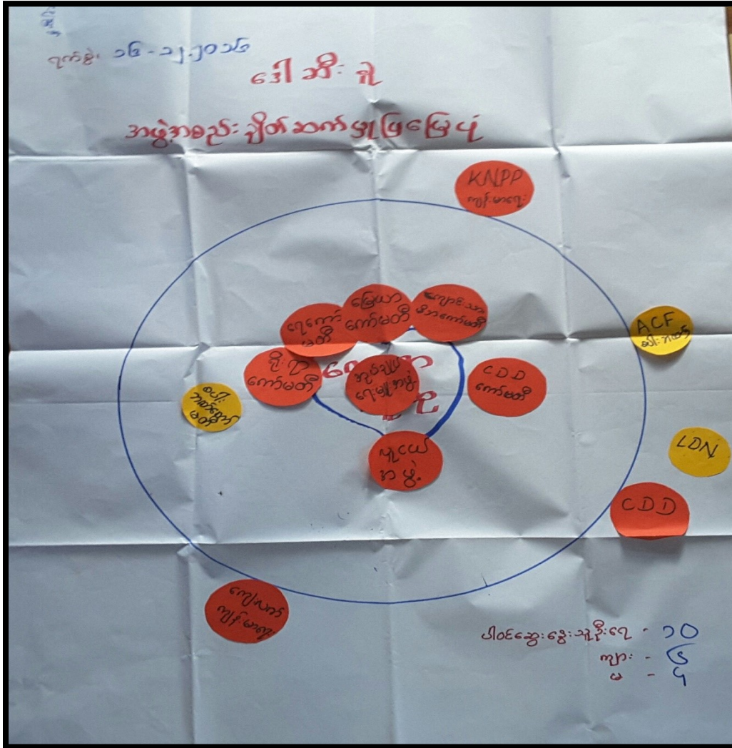
အဖွဲ့အစည်းချိတ်ဆက်မှုပြမြေပုံ

ကျေးရွာ။ ။ဒေါ်အိ.ချို အုပ်စု ။ ။မာခရော်ရှေ့