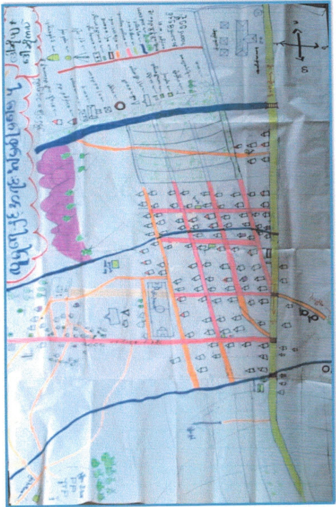
ဒေါ်ဆီဖျကျေးရွာနှင့်ဒေါ်ဆီကလဲကျေးရွာမြေပုံ