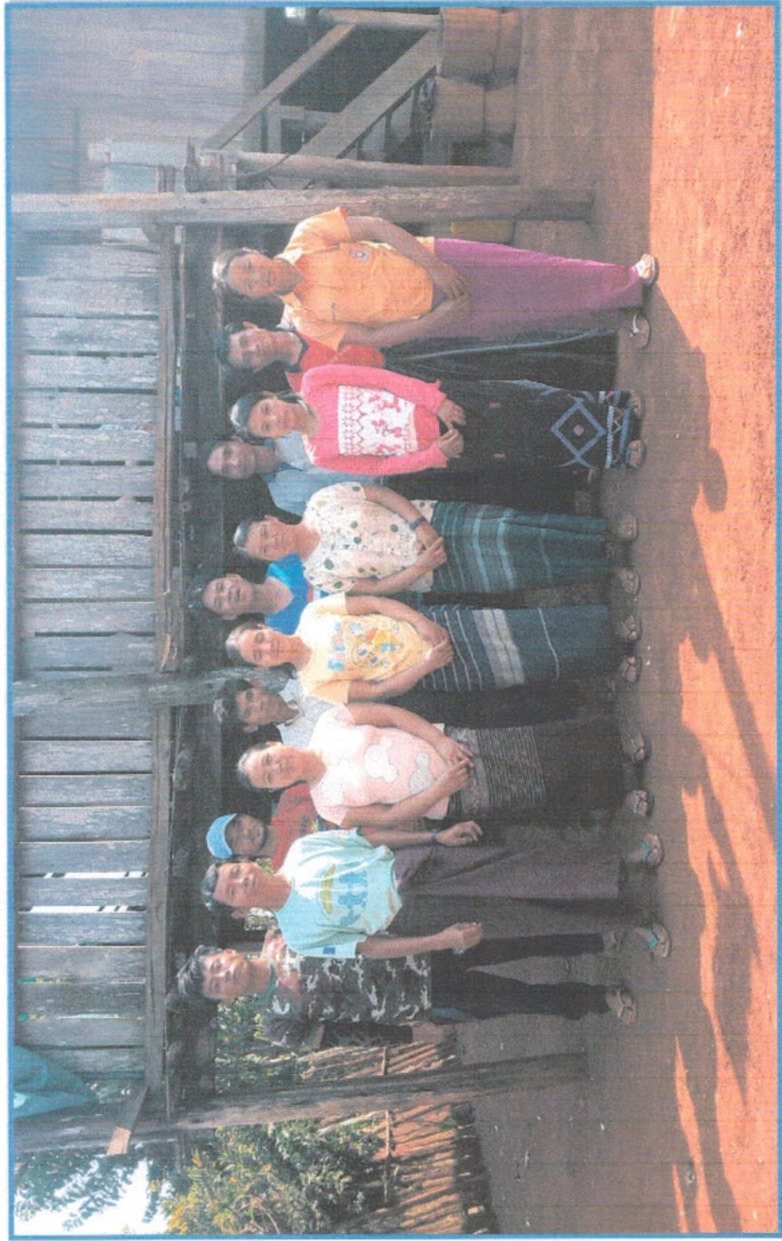
ကျေးရွာစီမံကိန်းအထောက်အကူပြုကော်မတီဝင်များ၏မှတ်တမ်းဓါတ်ပုံ