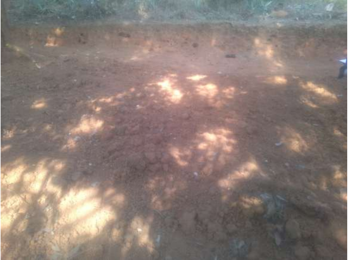
စီမံကိန်းလုပ်ငန်း တည်ဆောက်မည့်နေရာ