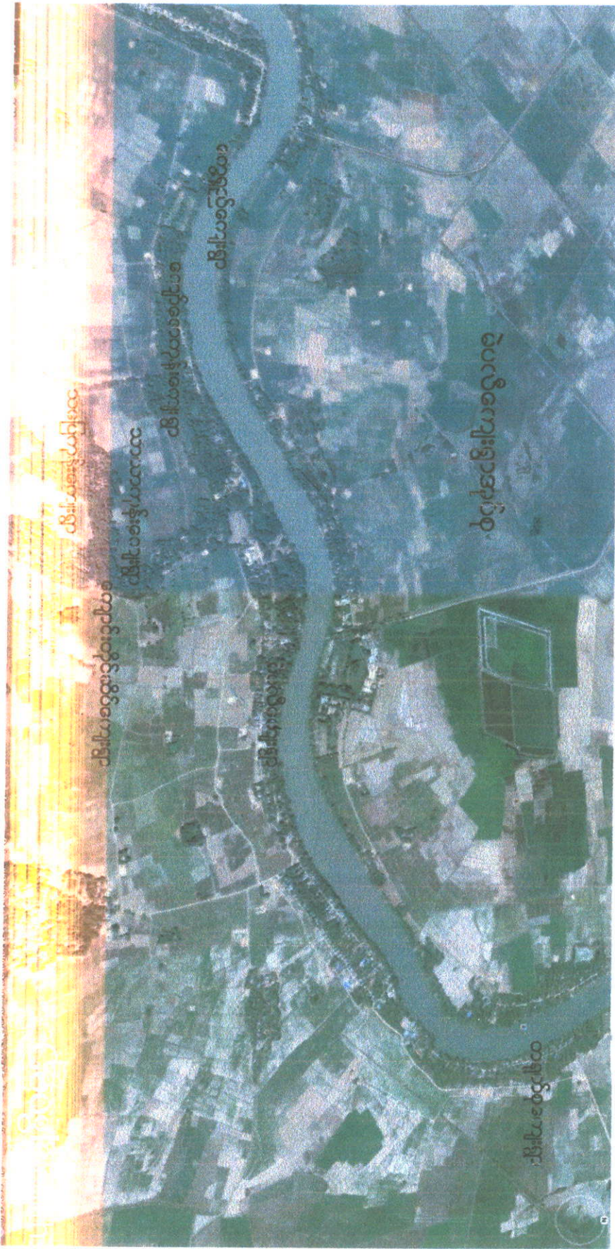
တနင်္သာရီမြို့နယ် မင်္ဂလာဒုံမြို့နယ် မြေပုံ