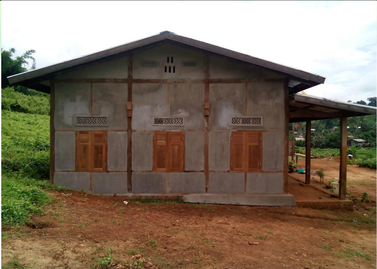
လုပ်ငန်းခွဲပြီးစီးမှုမှတ်တမ်းခါတ်ပုံ