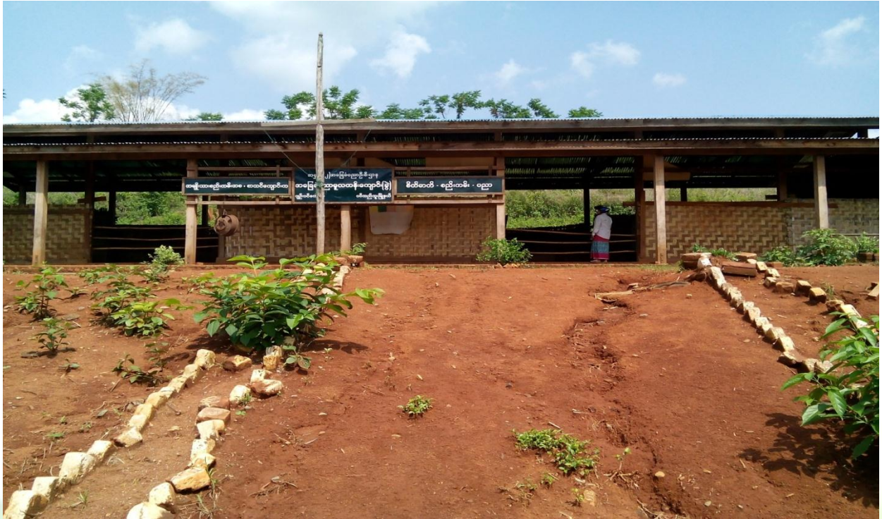
လုပ်ငန်းခွဲမပြုလုပ်မှီမှတ်တမ်းခါတ်ပုံ