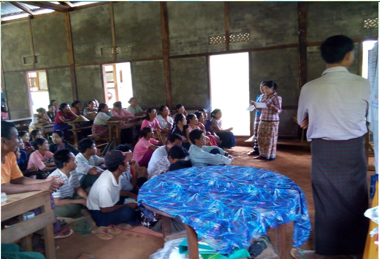
ကော်မတီရွေးချယ်ခြင်း မှတ်တမ်းဓာတ်ပုံ