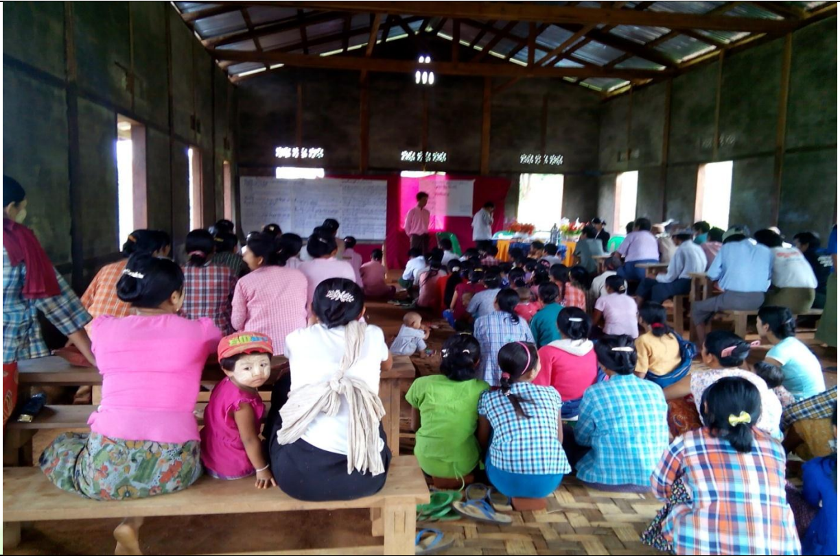
စေတနာ့ဝန်ထမ်းများ ရွေးချယ်ခြင်း မှတ်တမ်းဓာတ်ပုံ