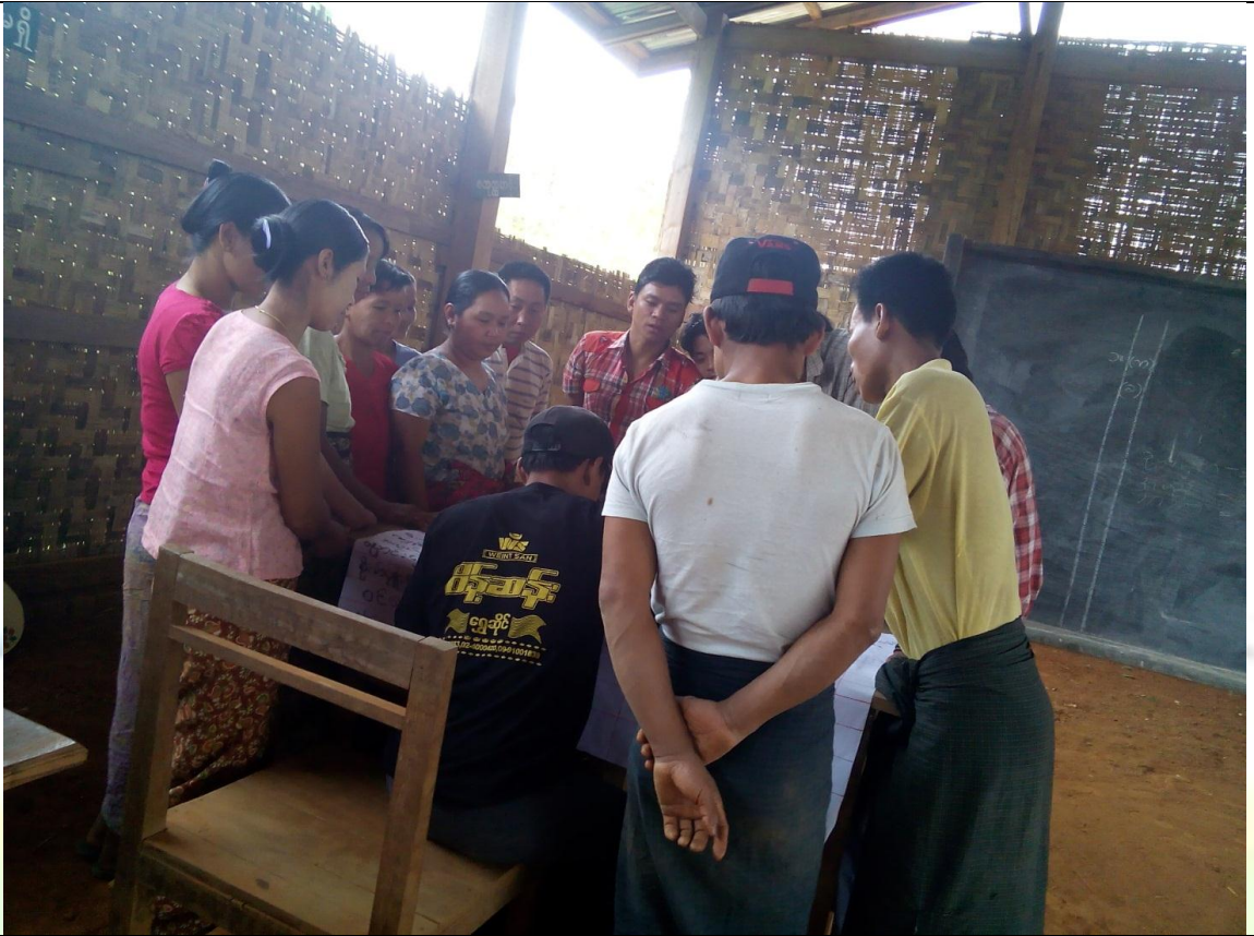
စေတနာ့ဝန်ထမ်းများ ရွေးချယ်ခြင်း မှတ်တမ်းခါတ်ပုံ