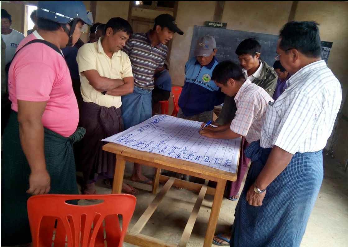
ကော်မတီရွေးချယ်ခြင်း မှတ်တမ်းခါတ်ပုံ