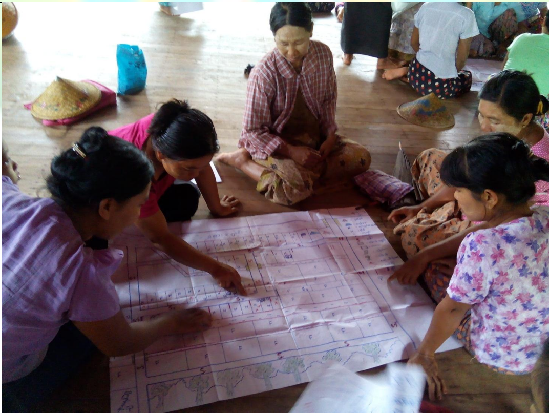
ဖွံ့ဖြိုးရေးအစီအစဉ်ရေးဆွဲခြင်း မှတ်တမ်းဓါတ်ပုံ