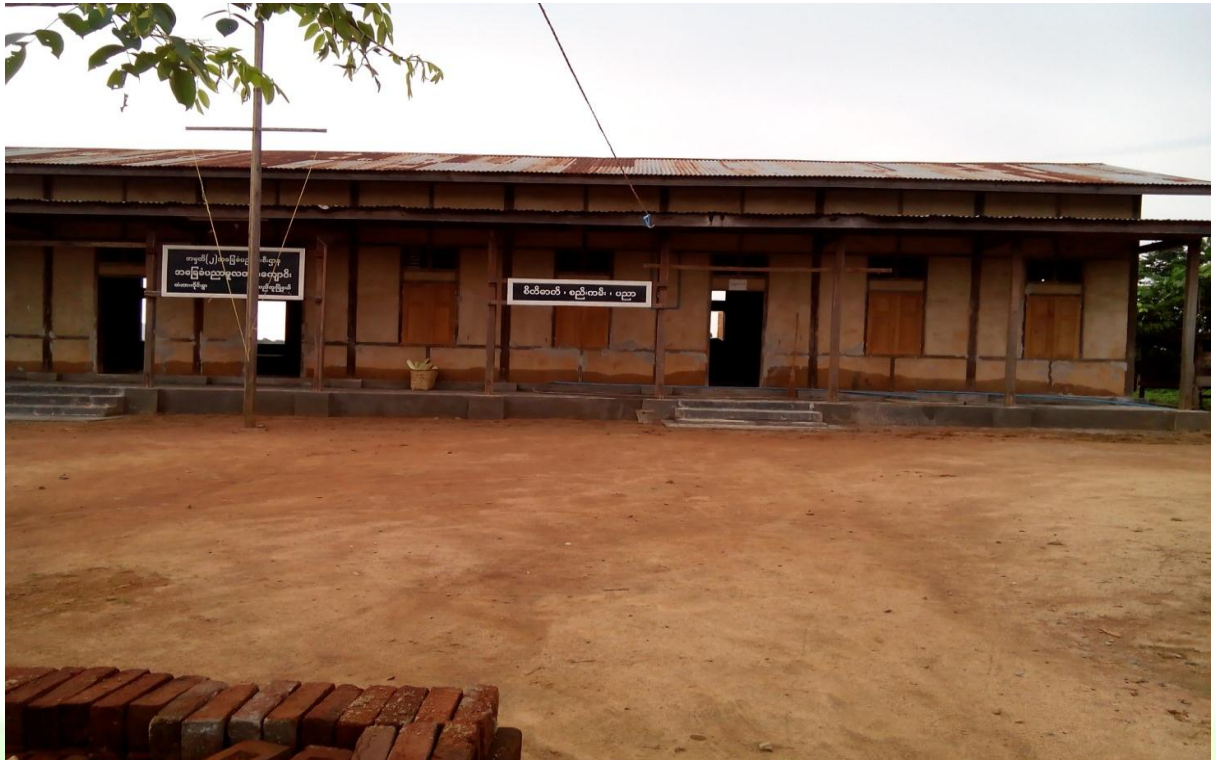
လုပ်ငန်းခွဲ၏မပြုလုပ်မီ မှတ်တမ်းဓါတ်ပုံ