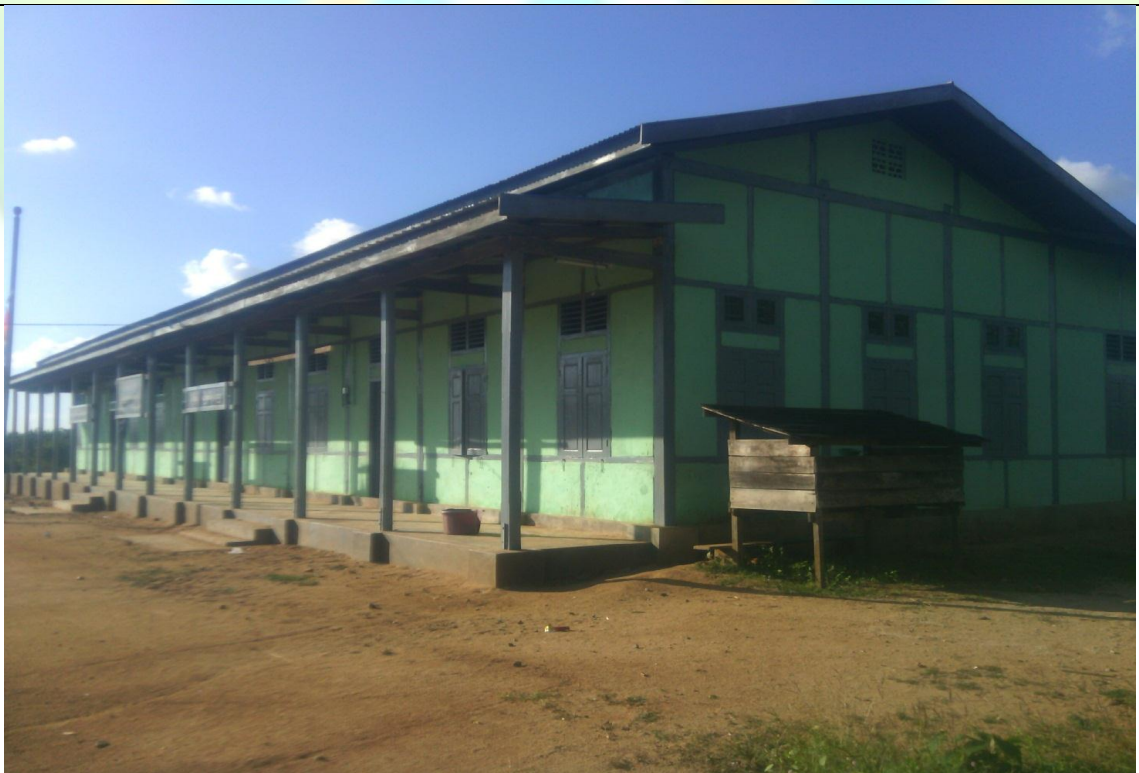
လုပ်ငန်းခွဲပြုလုပ်ပြီးစီးခြင်းမှတ်တမ်းဓါတ်ပုံ