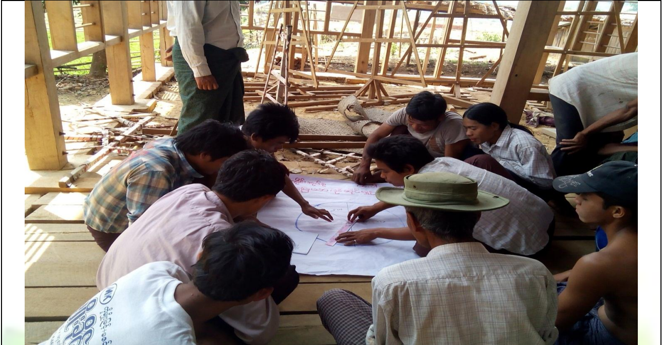
အမျိုးသားအုပ်စု၏ မှတ်တမ်းခါတ်ပုံ