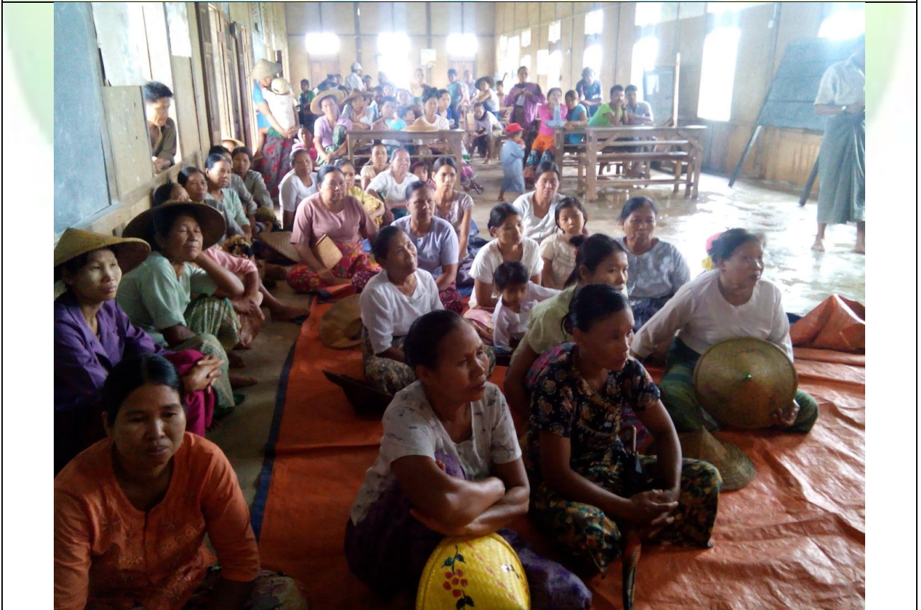
အမျိုးသမီးအုပ်စု၏ မှတ်တမ်းခါတ်ပုံ