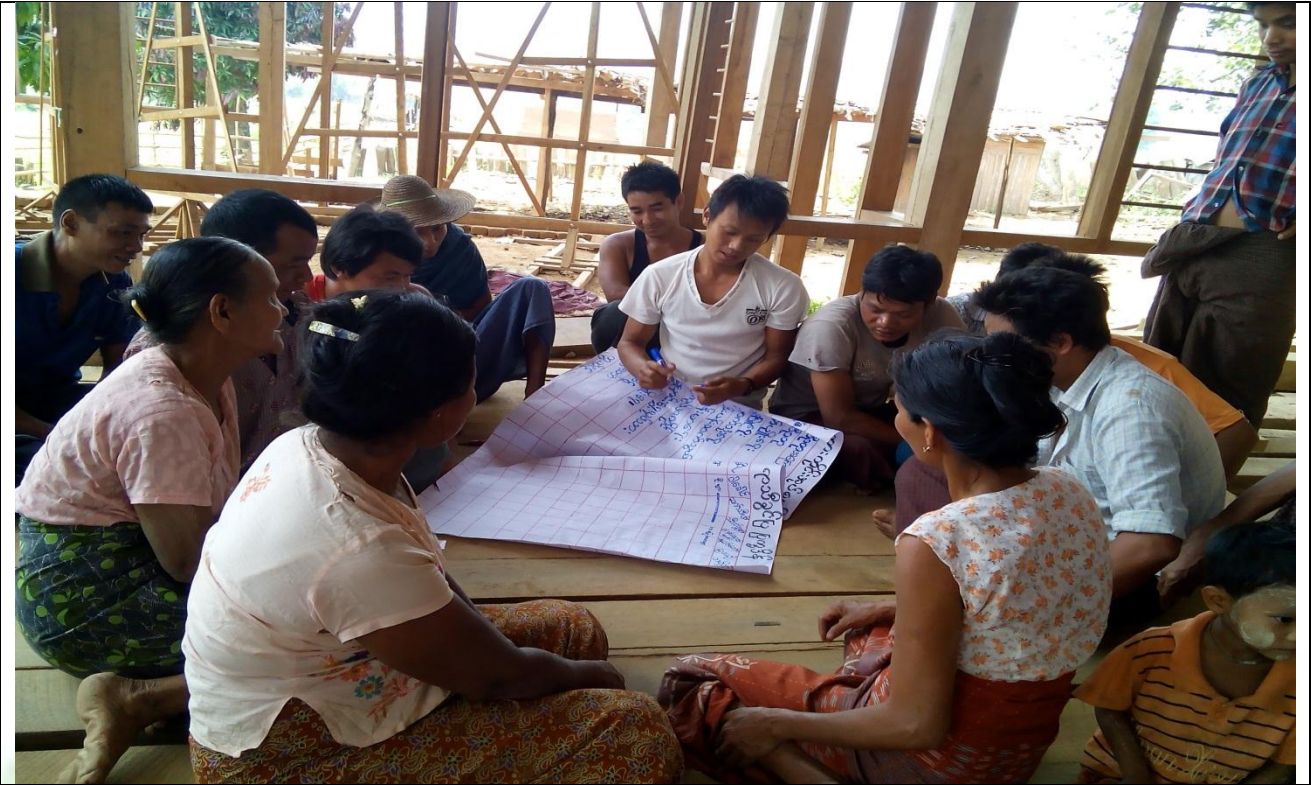
လူငယ်အုပ်စု၏ မှတ်တမ်းခါတ်ပုံ