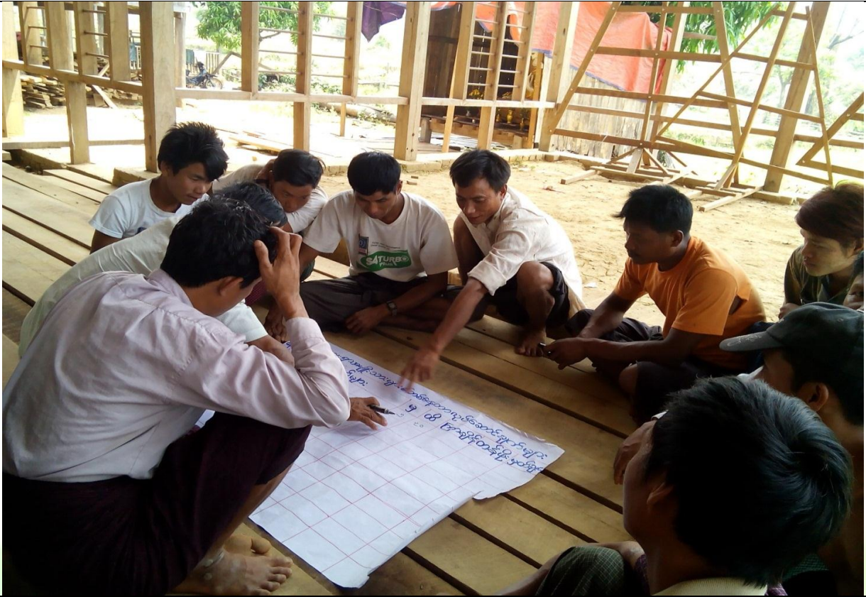
ဖွံ့ဖြိုးရေးအစီအစဉ်ရေးဆွဲခြင်း မှတ်တမ်းဓါတ်ပုံ