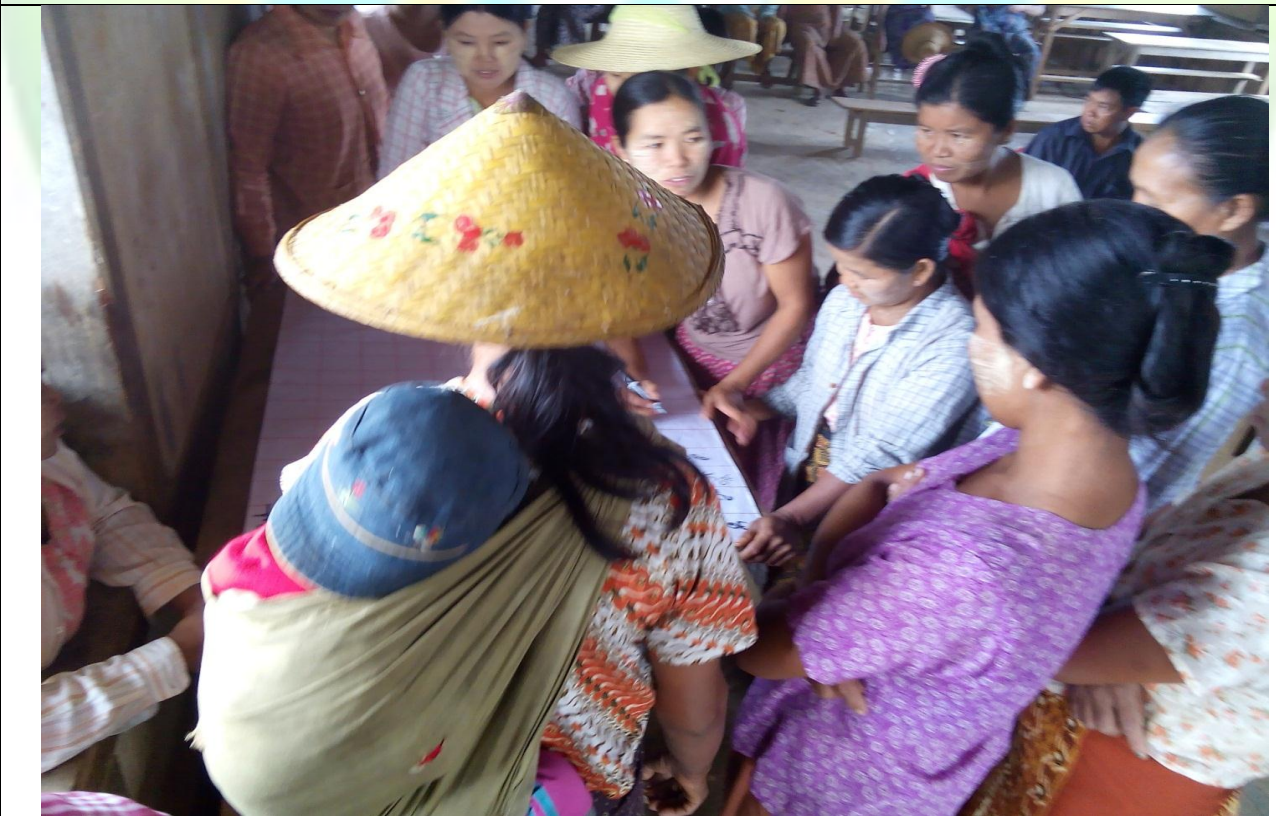
ထိခိုက်လွယ်အုပ်စုများ၏ မှတ်တမ်းခါတ်ပုံ