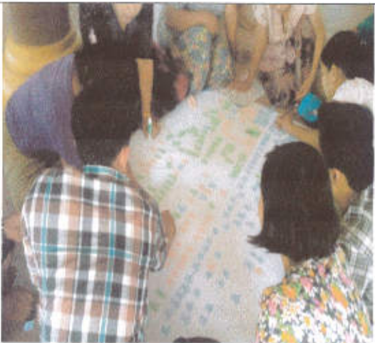
PRA ဆောင်ရွက်နေကြစဉ်