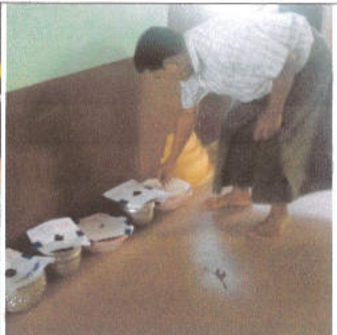
မဲပေးနေစဉ်