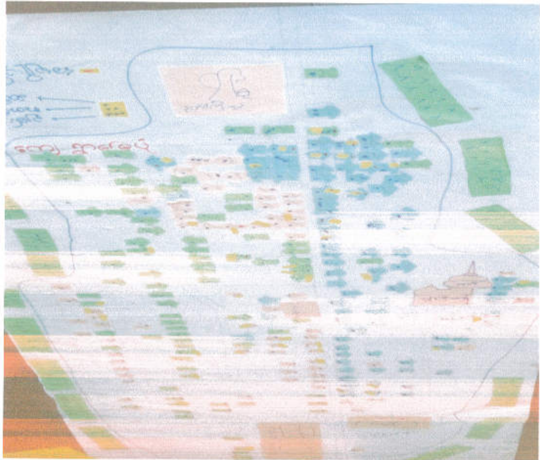
ကျေးရွာ၏လူမှုရေးနှင့် အရင်းအမြစ်ပြမြေပုံ