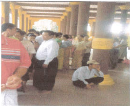
မဲပေးရန်တန်းစီနေကြစဉ်