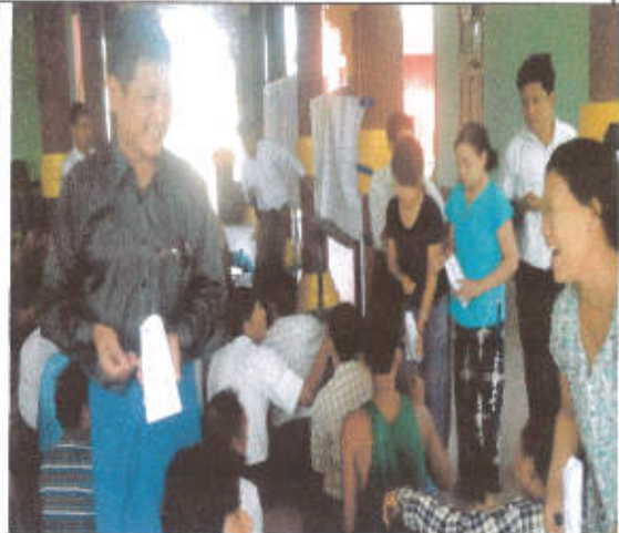
မဲပေးရန်ပြင်ဆင်နေစဉ်