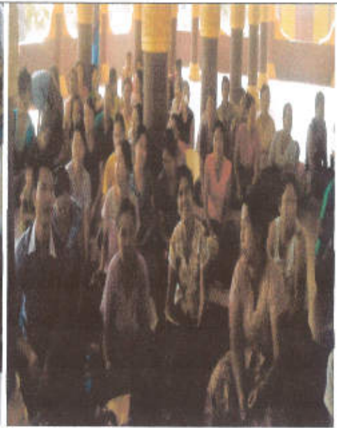
ပထမအကြိမ်ကျေးရွာအစည်းအဝေး