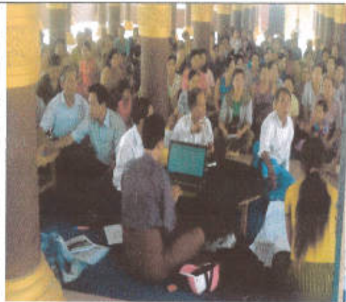
လူမှုဆန်းစစ်ခြင်းသုံးသပ်အစည်းအဝေး