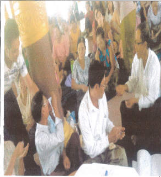
ဒုတိယအကြိမ်ကျေးရွာအစည်းအဝေး