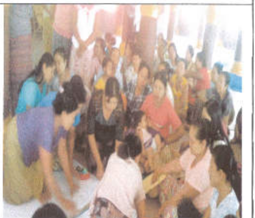
PRA ဆောင်ရွက်နေကြစဉ်