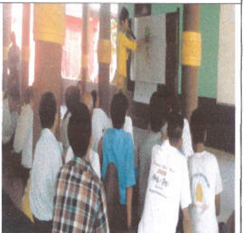
PRA အားရွာသားတစ်ဦးမှရှင်းပြနေစဉ်