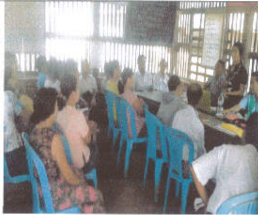
ကျေးရွာအကြီးအစည်းအဝေး