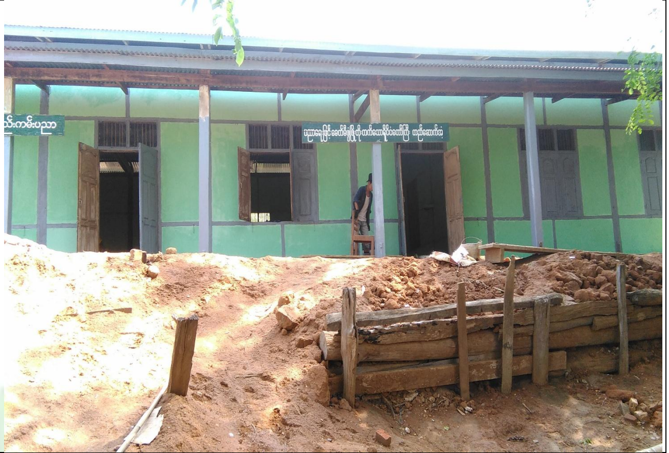
လှိုင်ငန်းရွာ၏မပြုလုပ်မီ မှတ်တမ်းဓာတ်ပုံ