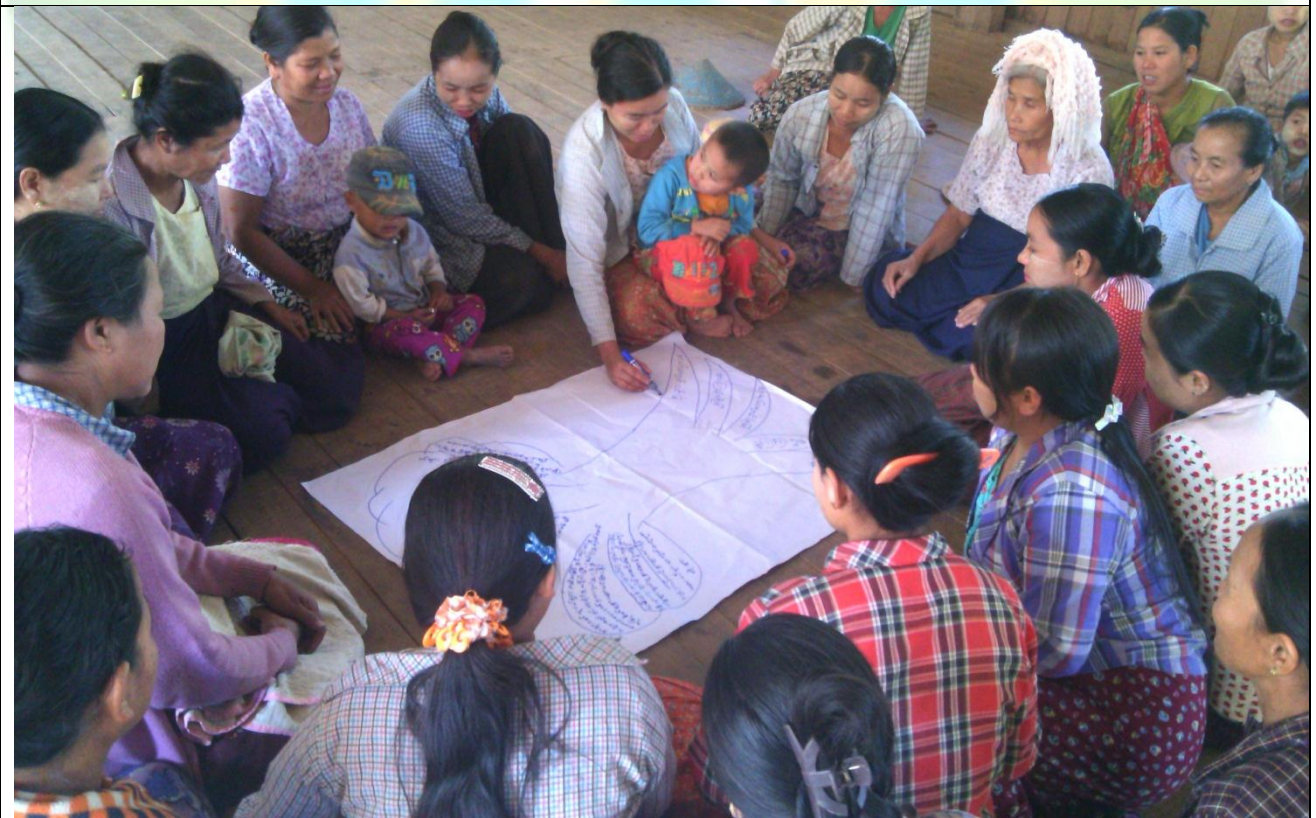
ဖွံ့ဖြိုးရေးအစီအစဉ်ရေးဆွဲခြင်း မှတ်တမ်းဓါတ်ပုံ