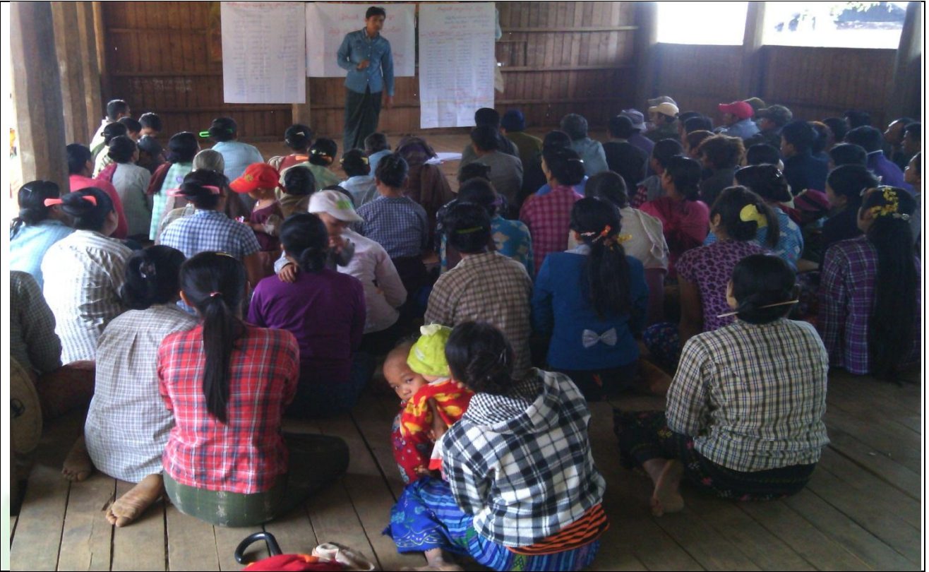
စေတနာ့ဝန်ထမ်းများ ရွေးချယ်ခြင်း မှတ်တမ်းခါတ်ပုံ