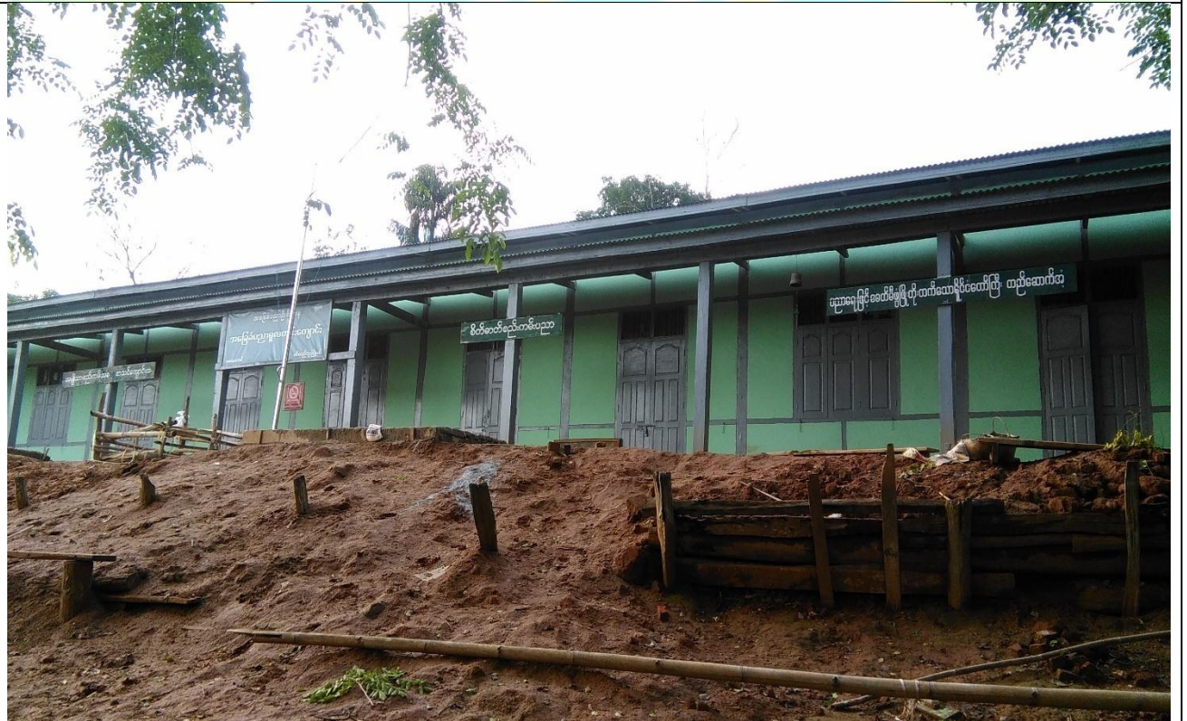
လှိုင်ငန်းရွာ၏မပြုလုပ်မီ မှတ်တမ်းဓာတ်ပုံ