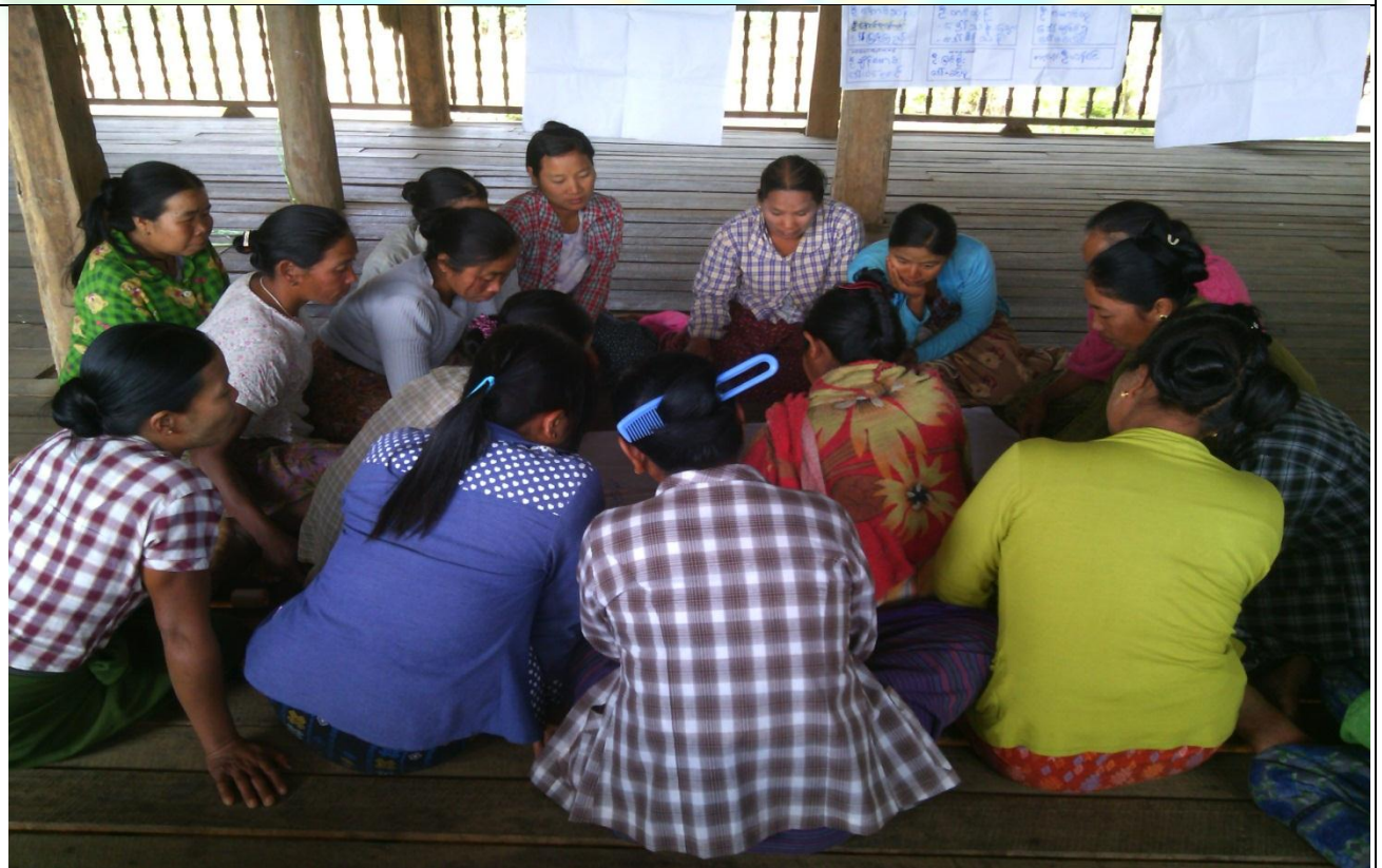
ကော်မတီရွေးချယ်ခြင်း မှတ်တမ်းခါတ်ပုံ