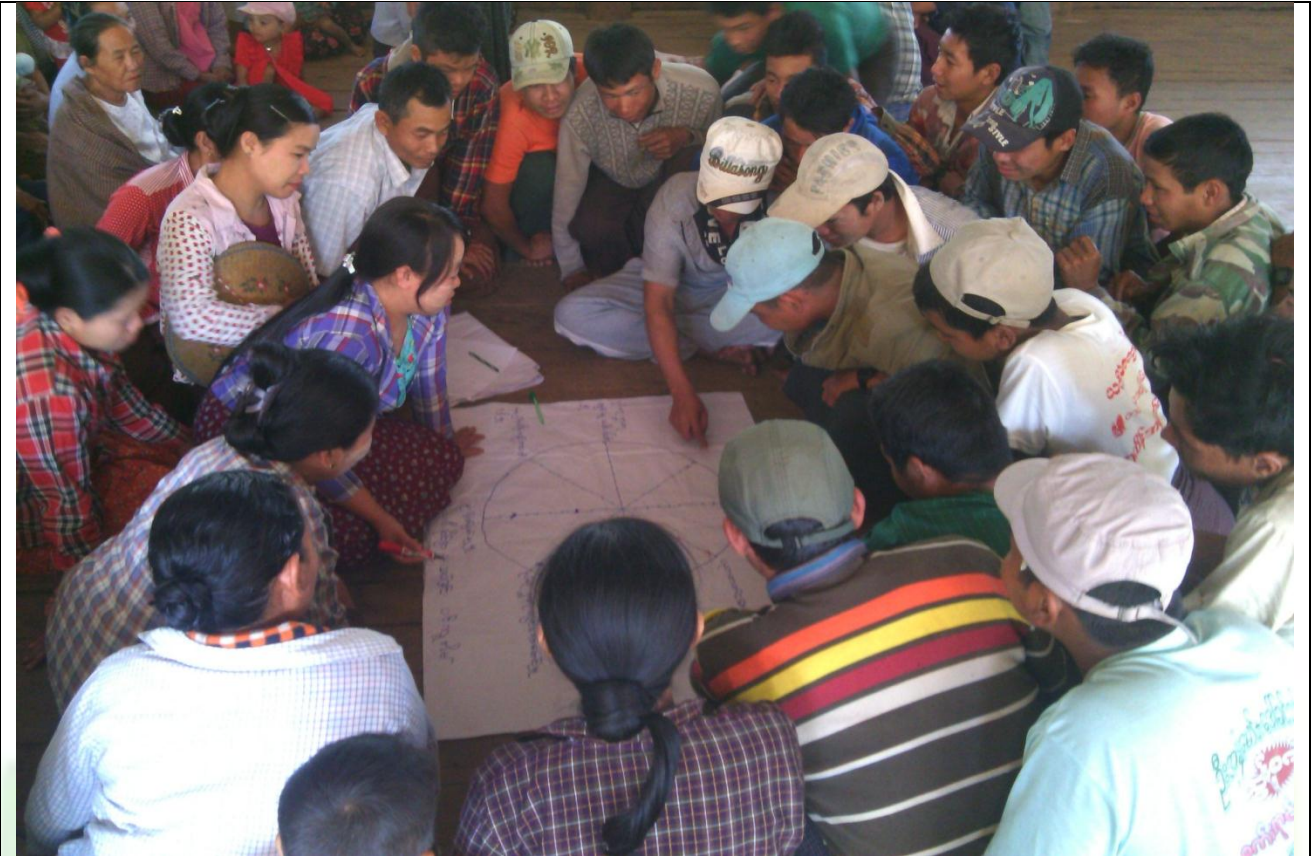
ဖွံ့ဖြိုးရေးအစီအစဉ်ရေးဆွဲခြင်း မှတ်တမ်းဓါတ်ပုံ