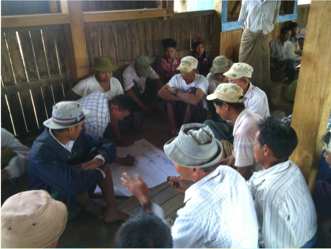
ဖွံ့ဖြိုးရေးအစီအစဉ်ရေးဆွဲခြင်း မှတ်တမ်းဓါတ်ပုံ