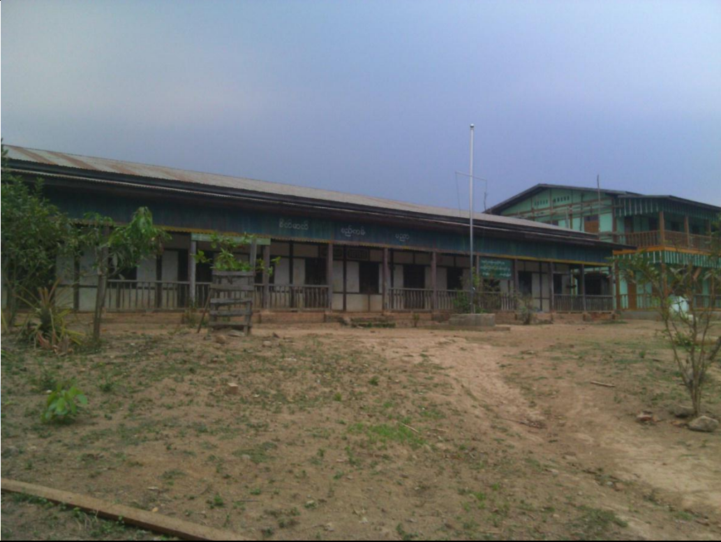
ပထမနှစ်လုပ်ငန်းခွဲ၏မပြုလုပ်မီ မှတ်တမ်းဓာတ်ပုံ