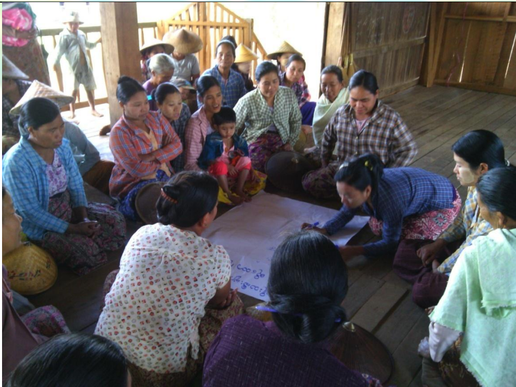
ဖွံ့ဖြိုးရေးအစီအစဉ်ရေးဆွဲခြင်း မှတ်တမ်းဓါတ်ပုံ