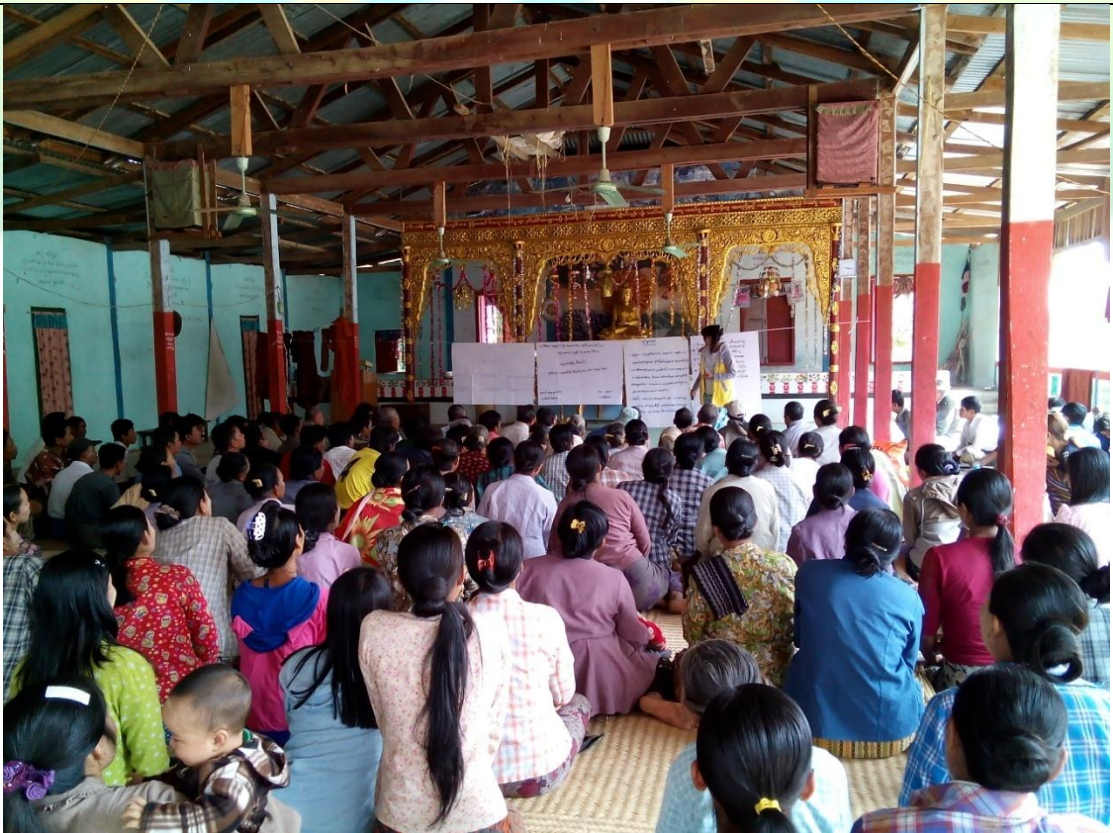
ကော်မတီရွေးချယ်ခြင်း မှတ်တမ်းခါတ်ပုံ