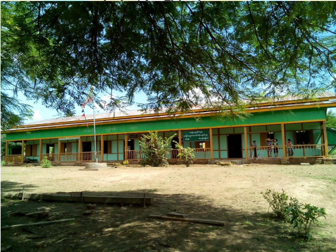
ပထမနှစ်လုပ်ငန်းခွဲပြီးစီးမှု မှတ်တမ်းဓာတ်ပုံ