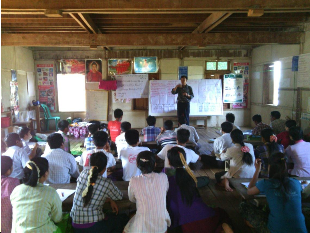
စေတနာ့ဝန်ထမ်းများ ရွေးချယ်ခြင်း မှတ်တမ်းခါတ်ပုံ