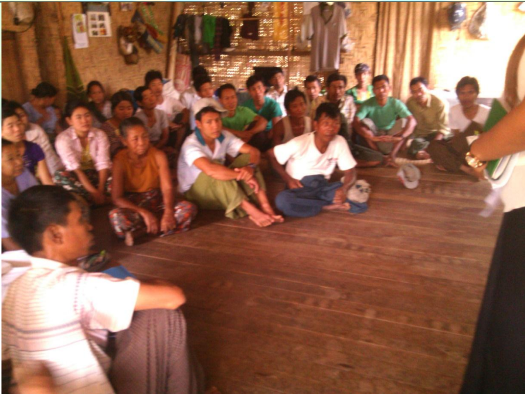
ကော်မတီရွေးချယ်ခြင်း မှတ်တမ်းခါတ်ပုံ