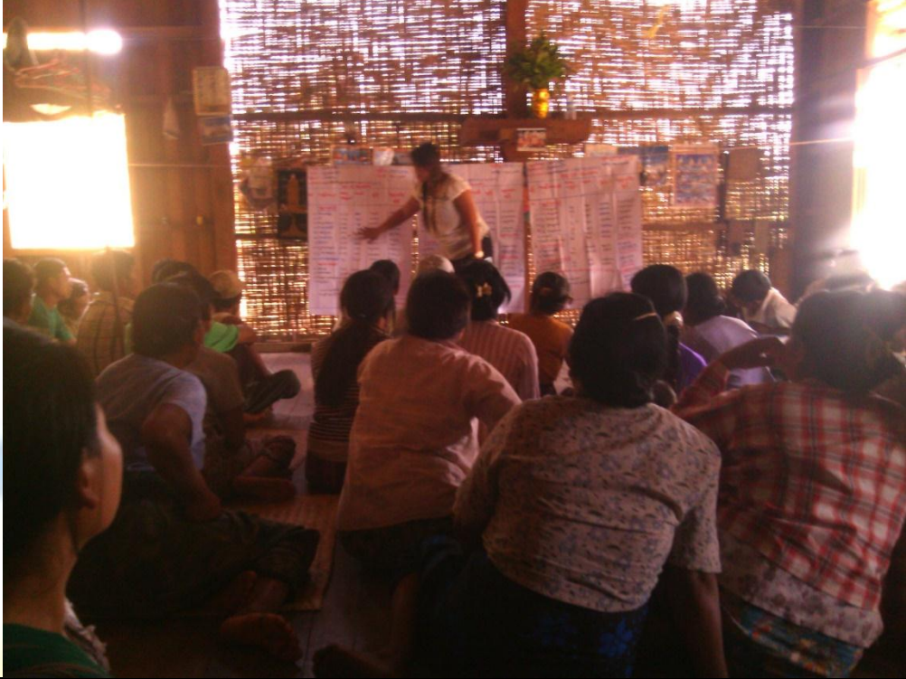
စေတနာ့ဝန်ထမ်းများ ရွေးချယ်ခြင်း မှတ်တမ်းခါတ်ပုံ