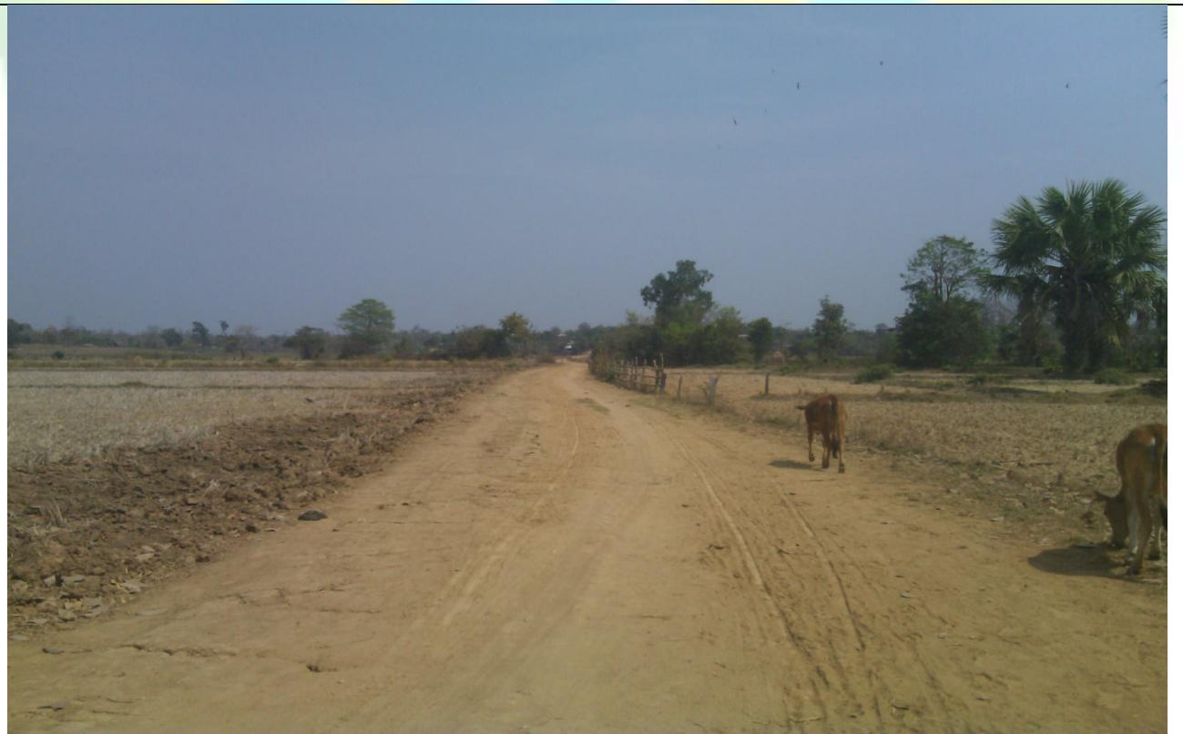
လုပ်ငန်းခွဲ၏မပြုလုပ်မီ မှတ်တမ်းခတ်ပုံ