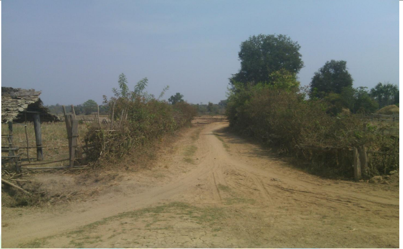
လုပ်ငန်းခွဲ၏မပြုလုပ်မီ မှတ်တမ်းခတ်ပုံ