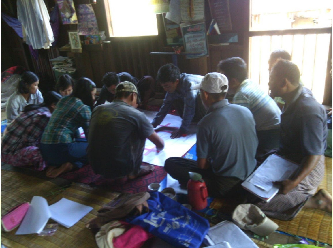
လူငယ်အုပ်စု၏ မှတ်တမ်းခါတ်ပုံ