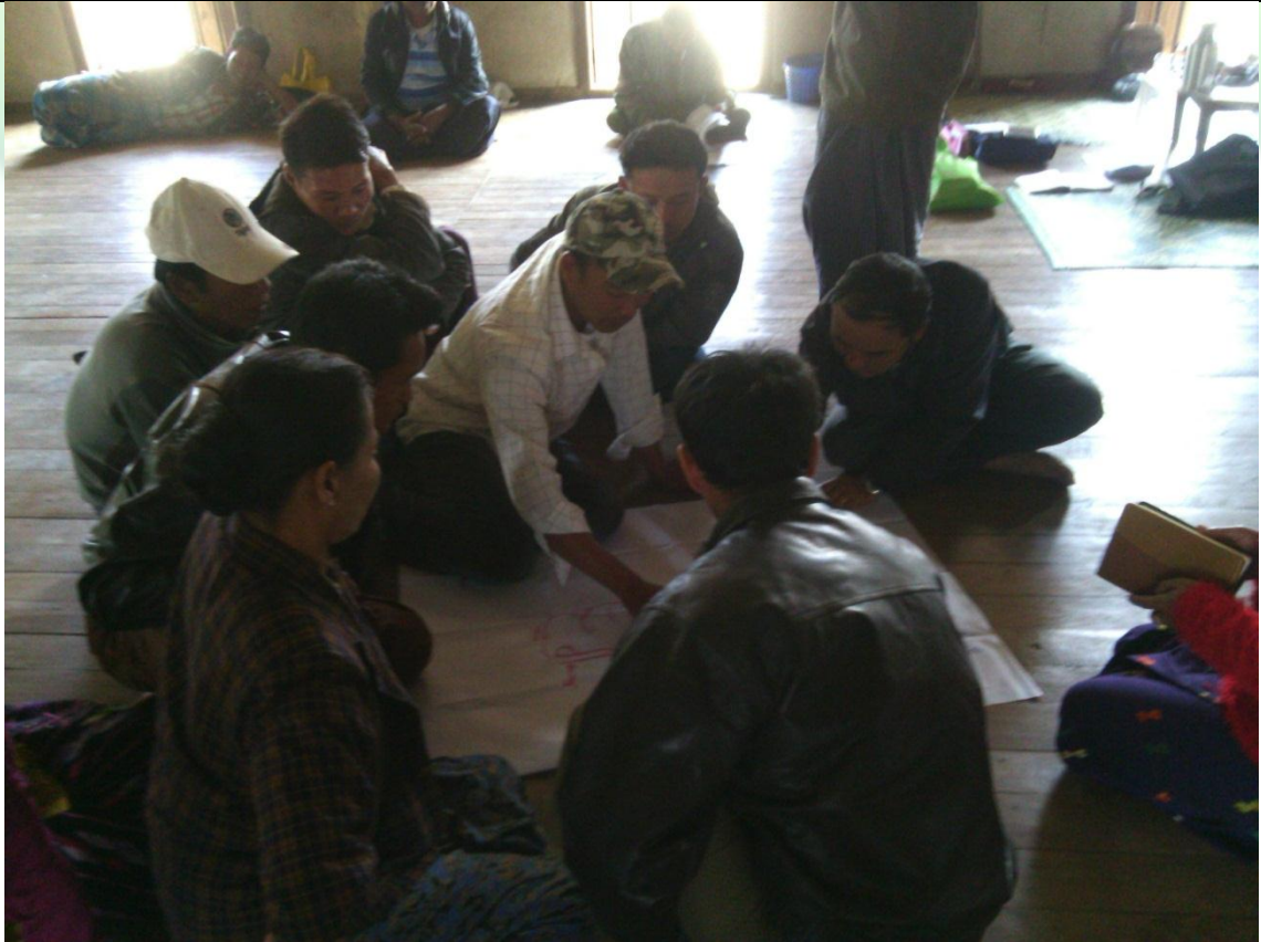
ထိခိုက်လွယ်အုပ်စုများ၏ မှတ်တမ်းခါတ်ပုံ