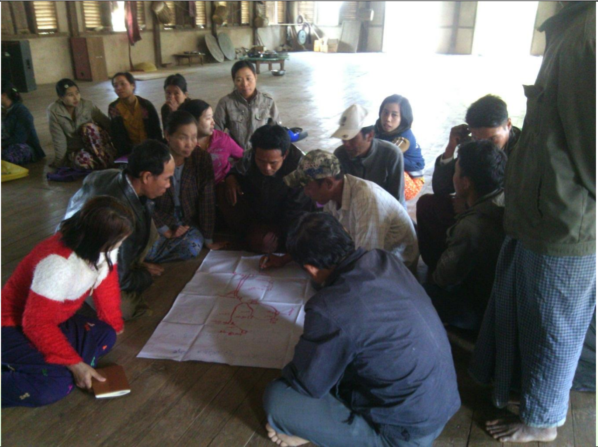
ဖွံ့ဖြိုးရေးအစီအစဉ်ရေးဆွဲခြင်း မှတ်တမ်းဓာတ်ပုံ