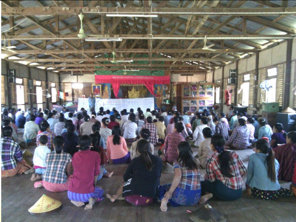
စေတနာ့ဝန်ထမ်းများ ရွေးချယ်ခြင်း မှတ်တမ်းဓာတ်ပုံ