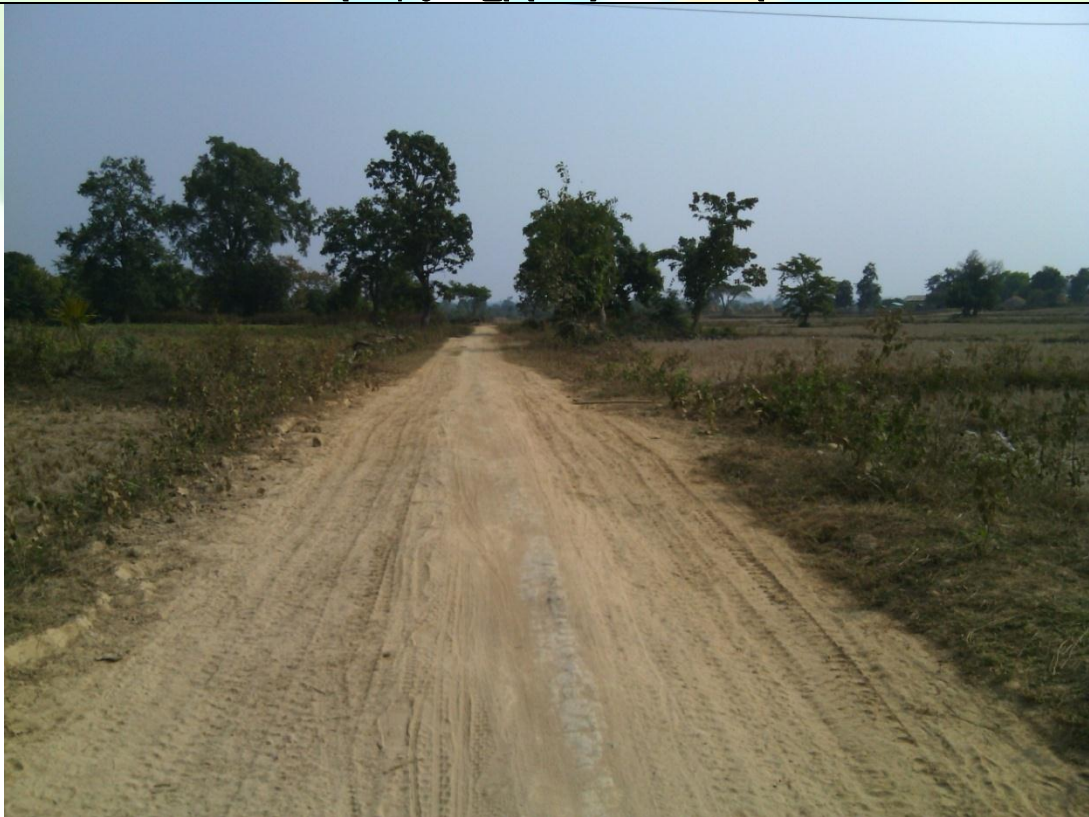
လုပ်ငန်းခွဲ၏မပြုလုပ်မီ မှတ်တမ်းဓာတ်ပုံ