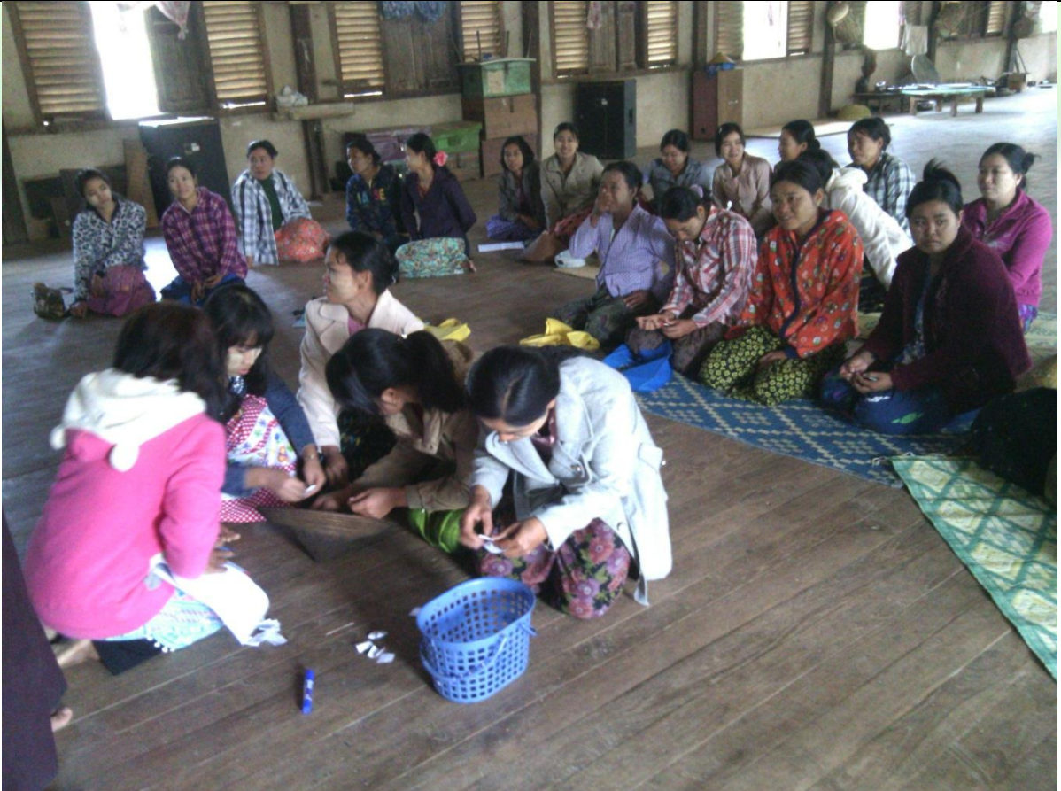
ကော်မတီရွေးချယ်ခြင်း မှတ်တမ်းဓာတ်ပုံ