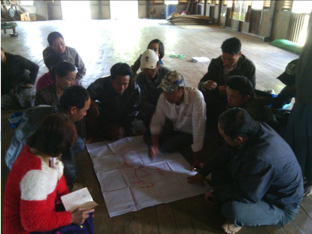
အမျိုးသားအုပ်စု၏ မှတ်တမ်းခါတ်ပုံ