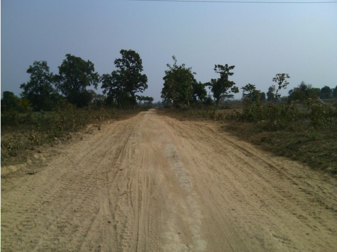
လုပ်ငန်းခွဲ၏မပြုလုပ်မီ မှတ်တမ်းဓာတ်ပုံ