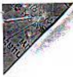
ပုံစံ - ၈-၁ - ကျေးရွာ အချက်အလက် (FORM PC 1)