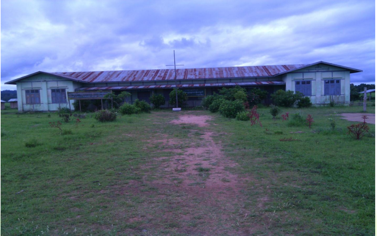
ပထမနှစ်စီမံကိန်းလုပ်ငန်းခွဲ ပြီးစီးမှုမှတ်တမ်းဓာတ်ပုံ