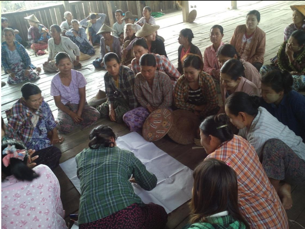
ဖွံ့ဖြိုးရေးအစီအစဉ်ရေးဆွဲခြင်း မှတ်တမ်းဓါတ်ပုံ