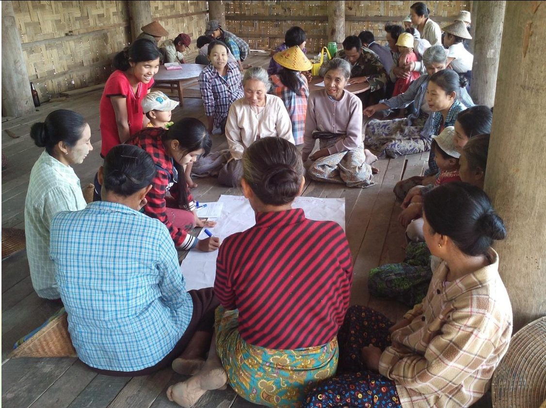
ဖွံ့ဖြိုးရေးအစီအစဉ်ရေးဆွဲခြင်း မှတ်တမ်းဓါတ်ပုံ