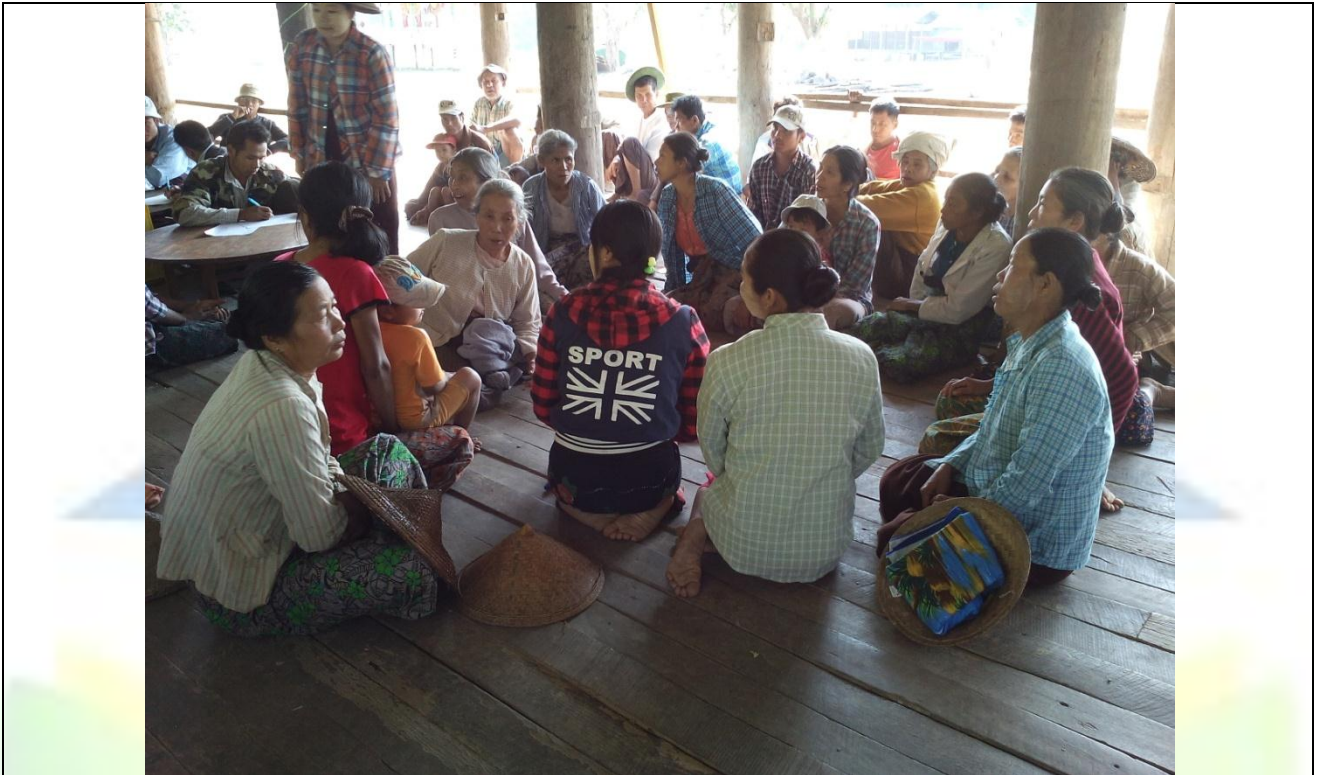
စေတနာ့ဝန်ထမ်းများ ရွေးချယ်ခြင်း မှတ်တမ်းဓါတ်ပုံ