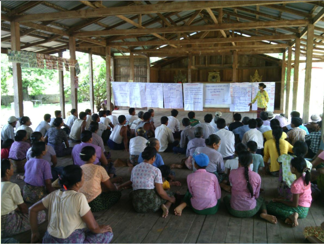
စေတနာ့ဝန်ထမ်းများ ရွေးချယ်ခြင်း မှတ်တမ်းဓါတ်ပုံ