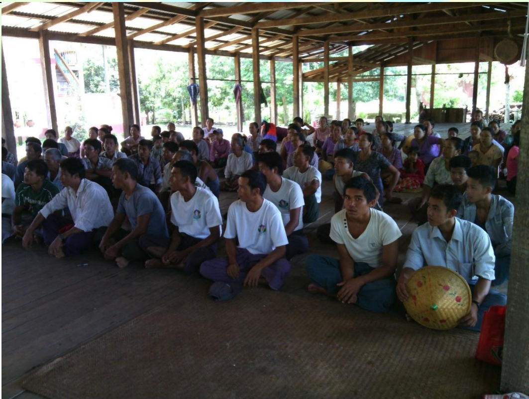
ကော်မတီရွေးချယ်ခြင်း မှတ်တမ်းဓါတ်ပုံ