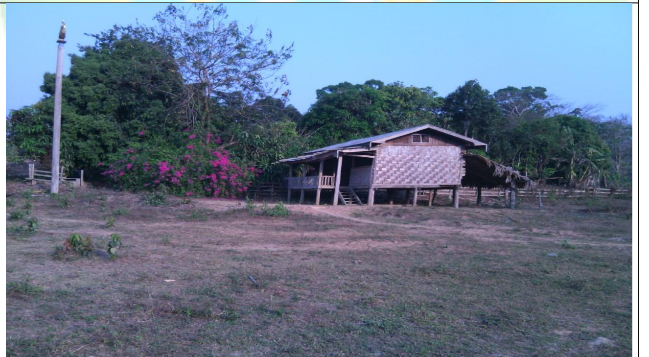
လုပ်ငန်းခွဲ၏မပြုလုပ်မီ မှတ်တမ်းဓာတ်ပုံ