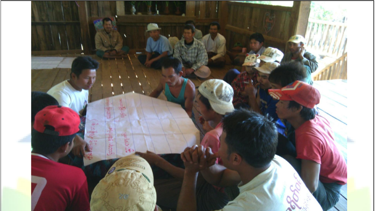
အမျိုးသားအုပ်စု၏ မှတ်တမ်းခါတ်ပုံ