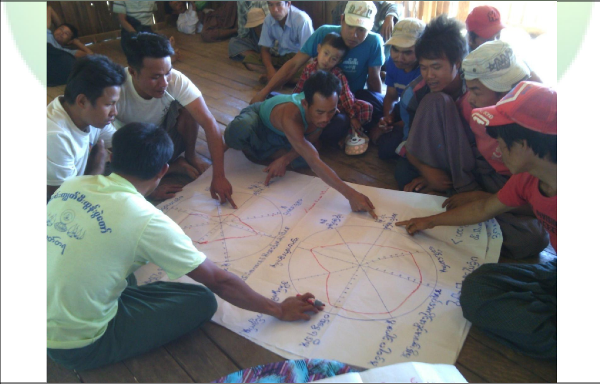
ဖွံ့ဖြိုးရေးအစီအစဉ်ရေးဆွဲခြင်း မှတ်တမ်းခါတ်ပုံ