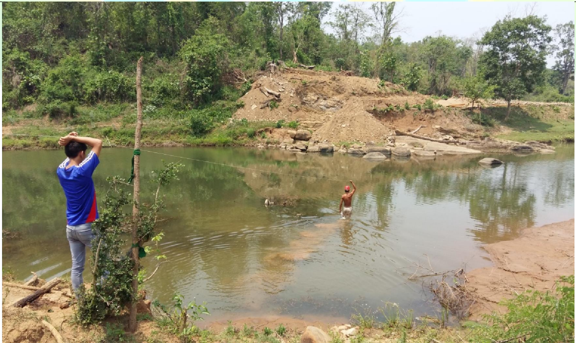
ဒုတိယနှစ် လုပ်ငန်းမပြုလုပ်မီ မှတ်တမ်းဓာတ်ပုံ