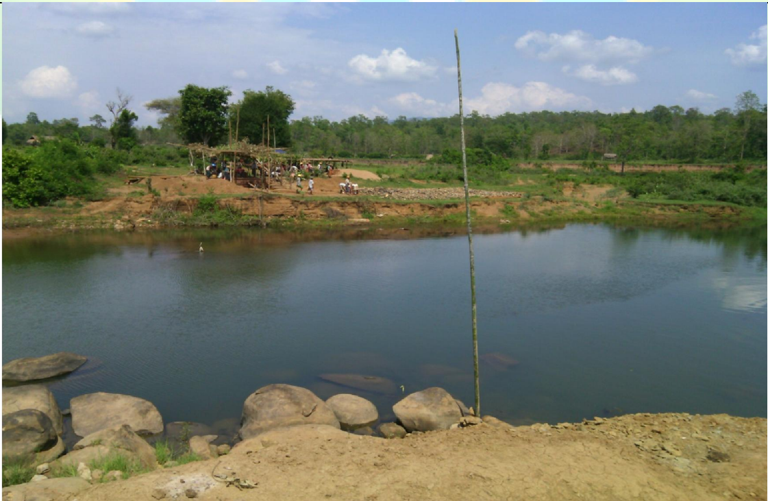
ပထမနှစ်လုပ်ငန်းခွဲ၏မပြုလုပ်မီ မှတ်တမ်းဓာတ်ပုံ