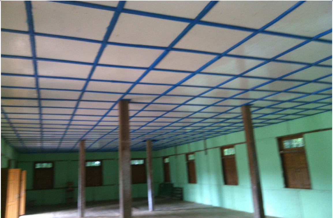
ပထမနှစ်လုပ်ငန်းခွဲပြီးစီးမှု မှတ်တမ်းဓာတ်ပုံ