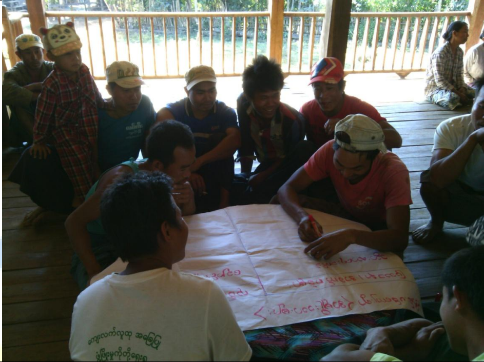
ဖွံ့ဖြိုးရေးအစီအစဉ်ရေးဆွဲခြင်း မှတ်တမ်းခါတ်ပုံ