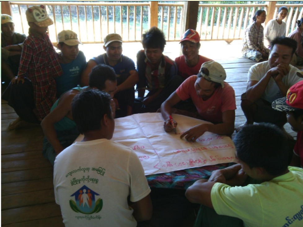
ဖွံ့ဖြိုးရေးအစီအစဉ်ရေးဆွဲခြင်း မှတ်တမ်းခါတ်ပုံ