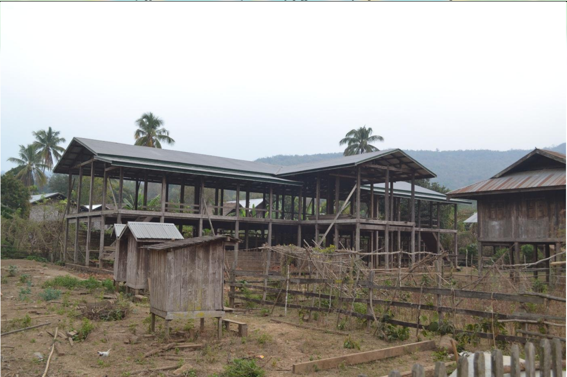
ပထမနှစ် လုပ်ငန်းခွဲ၏မပြုလုပ်မီ မှတ်တမ်းဓါတ်ပုံ