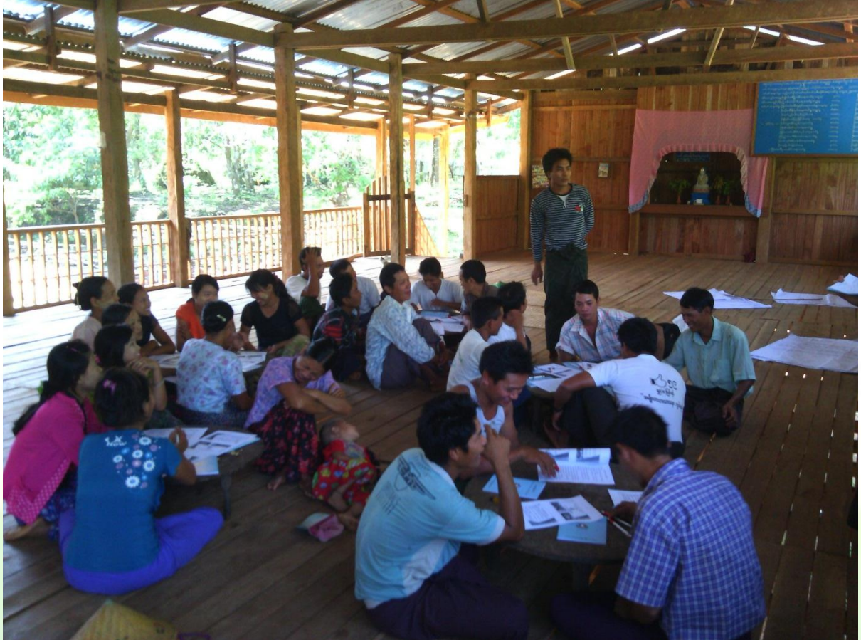
ကျေးရွာကော်မတီဝင်များစီမံခန့်ခွဲမှုသင်တန်း မှတ်တမ်းဓါတ်ပုံ