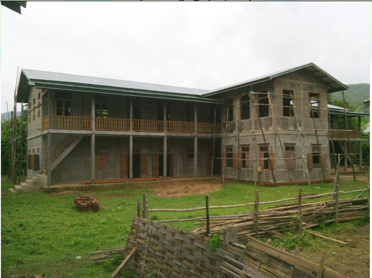
ဒုတိယနှစ် ဆောင်ရွက်နေသော စာသင်ကျောင်းပုံ