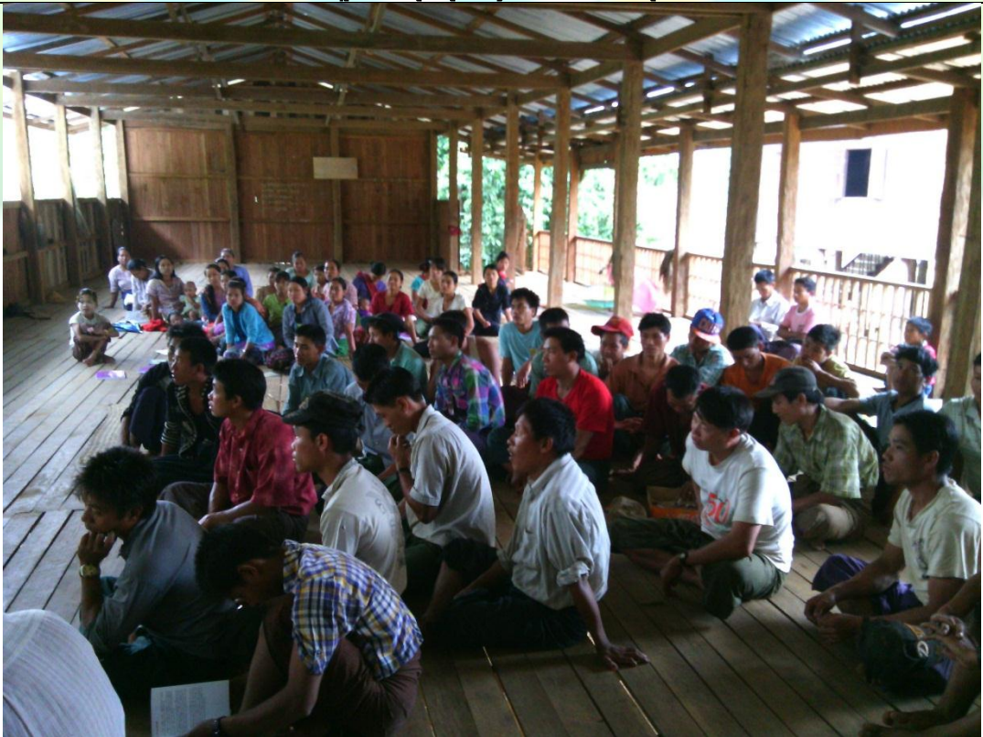
ဖွံ့ဖြိုးရေးအစီအစဉ်ရေးဆွဲခြင်း အစည်းအဝေးမှတ်တမ်းခါတ်ပုံ