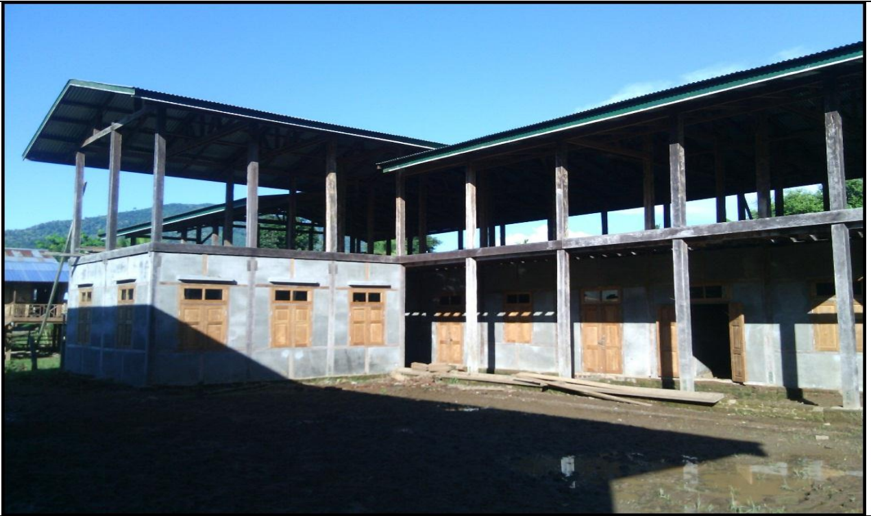
ပထမနှစ် ဆောင်ရွက်ပြီးလုပ်ငန်းခါတ်ပုံ