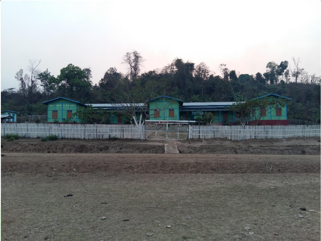
ပထမနှစ်တွင် ဆောင်ရွက်ပြီးစီးခဲ့သော မှတ်တမ်းဓါတ်ပုံ