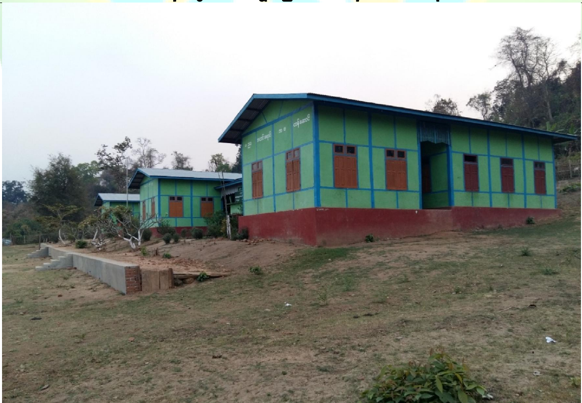
ပထမနှစ်တွင် ဆောင်ရွက်ပြီးစီးခဲ့သော မှတ်တမ်းဓါတ်ပုံ