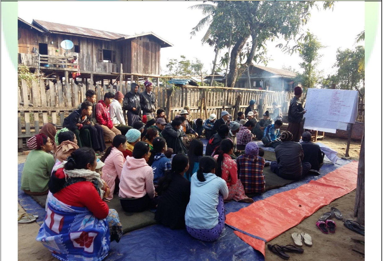
ကော်မတီရွေးချယ်ခြင်း မှတ်တမ်းခါတ်ပုံ