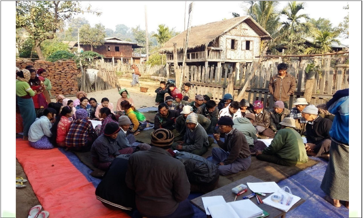
စောနာဝန်ထမ်းများ ရွေးချယ်ခြင်း မှတ်တမ်းခါတ်ပုံ