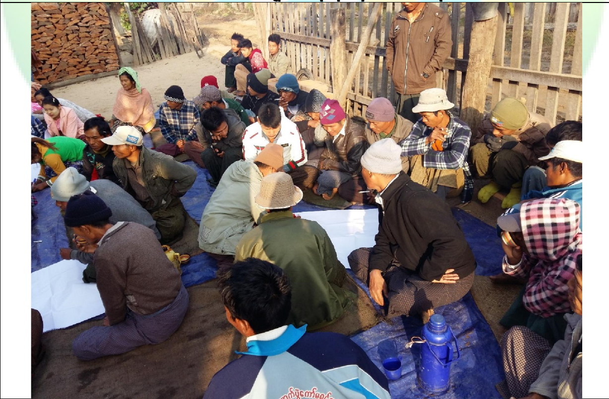
ဖွံ့ဖြိုးရေးအစီအစဉ်ရေးဆွဲခြင်း မှတ်တမ်းခါတ်ပုံ