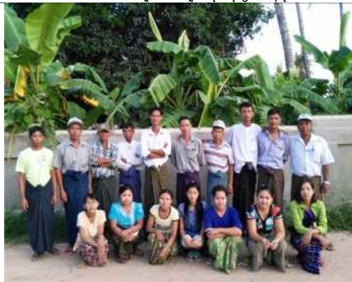
သဲကောကြီးကျေးရွာ၏ ကျေးရွာစီမံကိန်း အထောက်အကူပြုကော်မတီဝင်များ