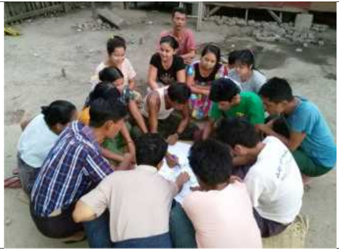
လူမှုဆန်းစစ်အကဲဖြတ်ချင်းဆိုင်ကျေးရွာမြေပုံရေးဆွဲနေပုံ