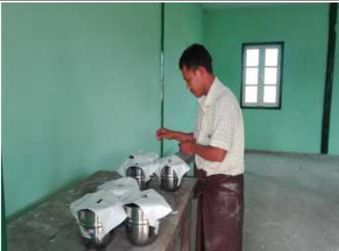
စီမံကိန်းလုပ်ငန်းခွဲများ တစ်ဦးချင်းဖဲထည့် ရွေးချယ်နေပုံ