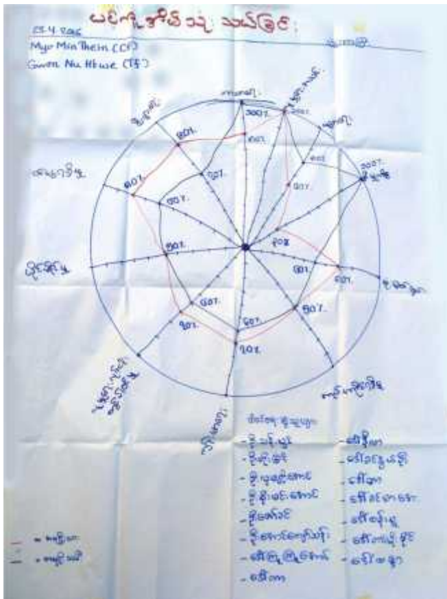
(၆-ဃ) ကျား-မ အခန်းကဏ္ဍသုံးသပ်ခြင်း (Cob Web)