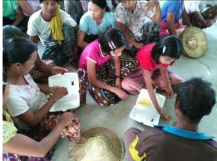
ကော်မတီဝင်များ၏ မဲများကိုရေတွက်နေပုံ