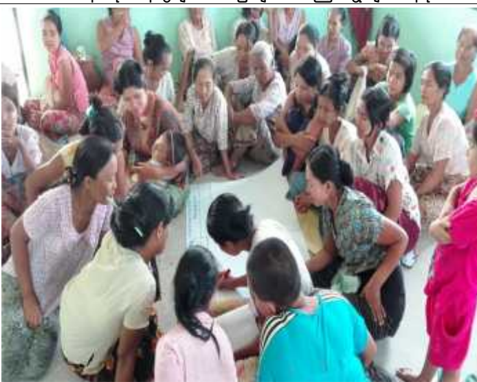
ကျေးရွာအတွင်း အမျိုးသမီးများကြုံတွေ့နေရသော အခက်အခဲများကို အုပ်စုဖွဲ့ ဆွေးနွေးဖော်ထုတ်နေပုံ