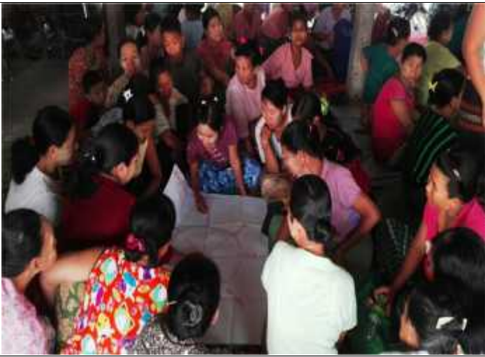
လူမှုဆန်းစစ်ခြင်းများအုပ်စုဖွဲ့လုပ်ဆောင်နေပုံ