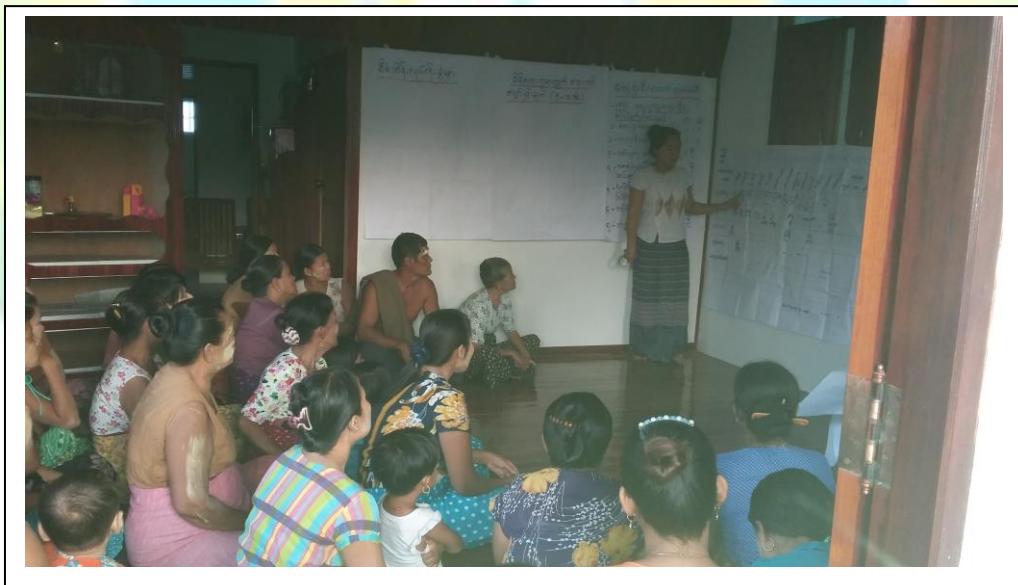
လူထုပဟိုပြုစီမံကိန်းလုပ်ငန်းအကောင်အထည်ဖော်မှုအစီရင်ခံစာ (ကွမ်ရိုက်ကျေးရွာအုပ်စု၊ ကွမ်တဂဲကျေးရွာ)