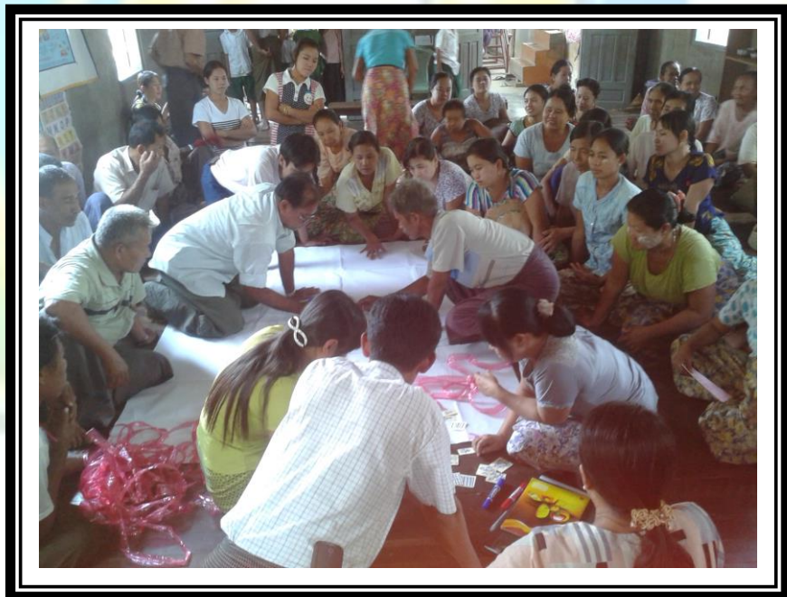
လူထုဗဟိုပြုစီမံကိန်းလုပ်ငန်းအကောင်အထည်ဖော်မှုအစီရင်ခံစာ (ကလေးကျေးရွာအုပ်စု၊ ကလေးကျေးရွာ)