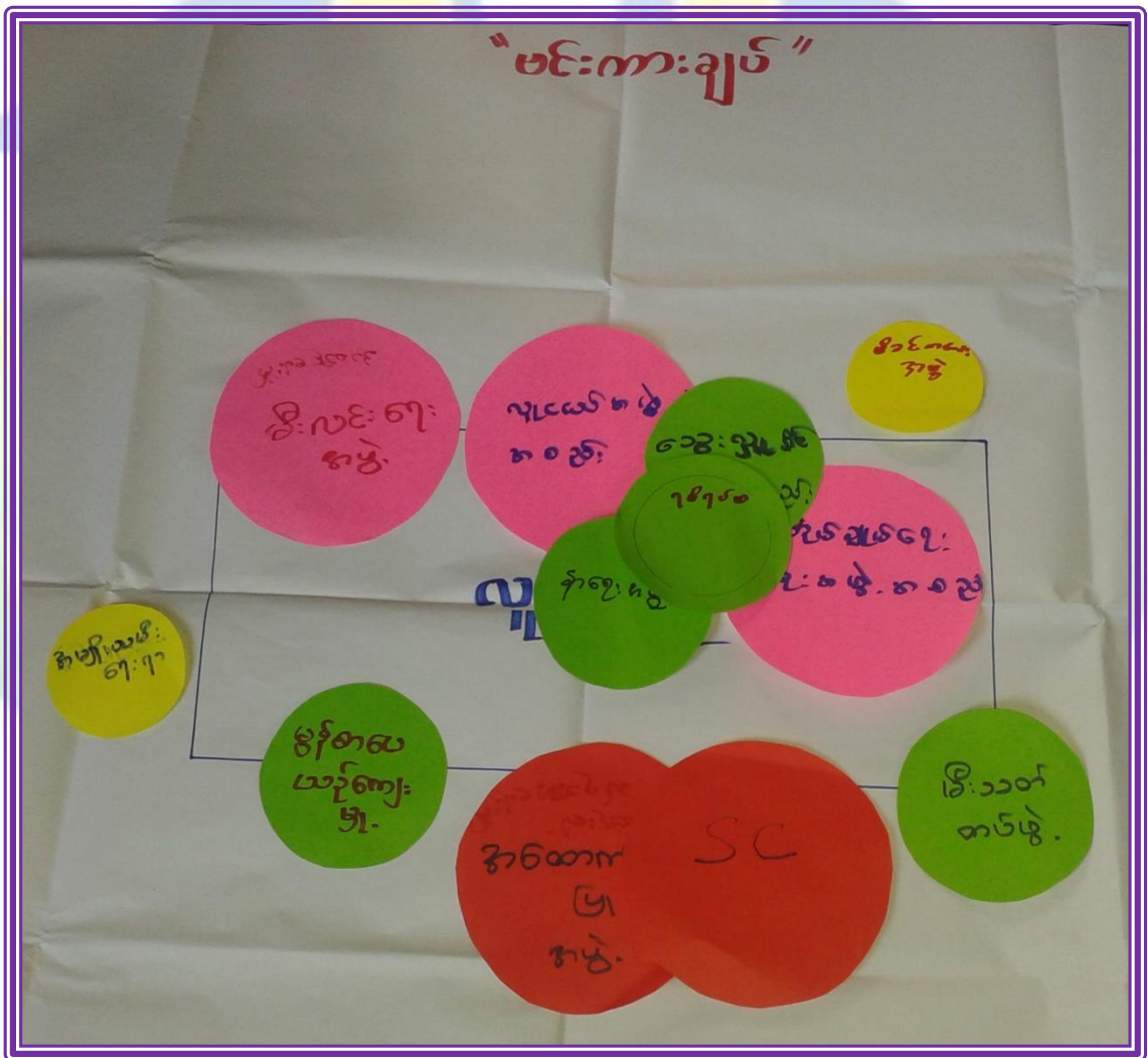
လူထုပဟိုပြုစီမံကိန်းလုပ်ငန်းအကောင်အထည်ဖော်မှုအစီရင်ခံစာ (ကလေးကျေးရွာအုပ်စု၊ ကလေးကျေးရွာ)