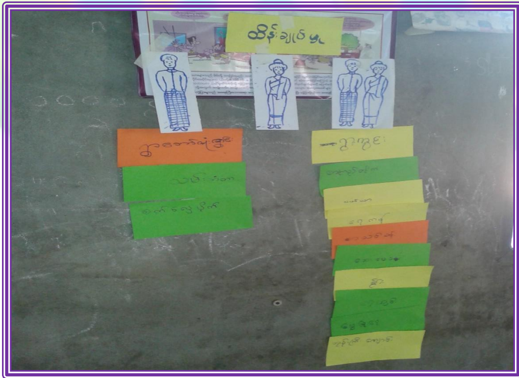
လူထုပဟိုပြုစီမံကိန်းလုပ်ငန်းအကောင်အထည်ဖော်မှုအစီရင်ခံစာ (ကလော့ကျေးရွာအုပ်စု၊ ကလော့ကျေးရွာ)