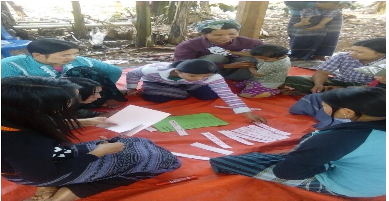
၇။ ခေါ်သမော ကျေးရွာ၏ စီမံကိန်းအထောက်အကူပြု ကျေးရွာကော်မတီဝင်များစာရင်း