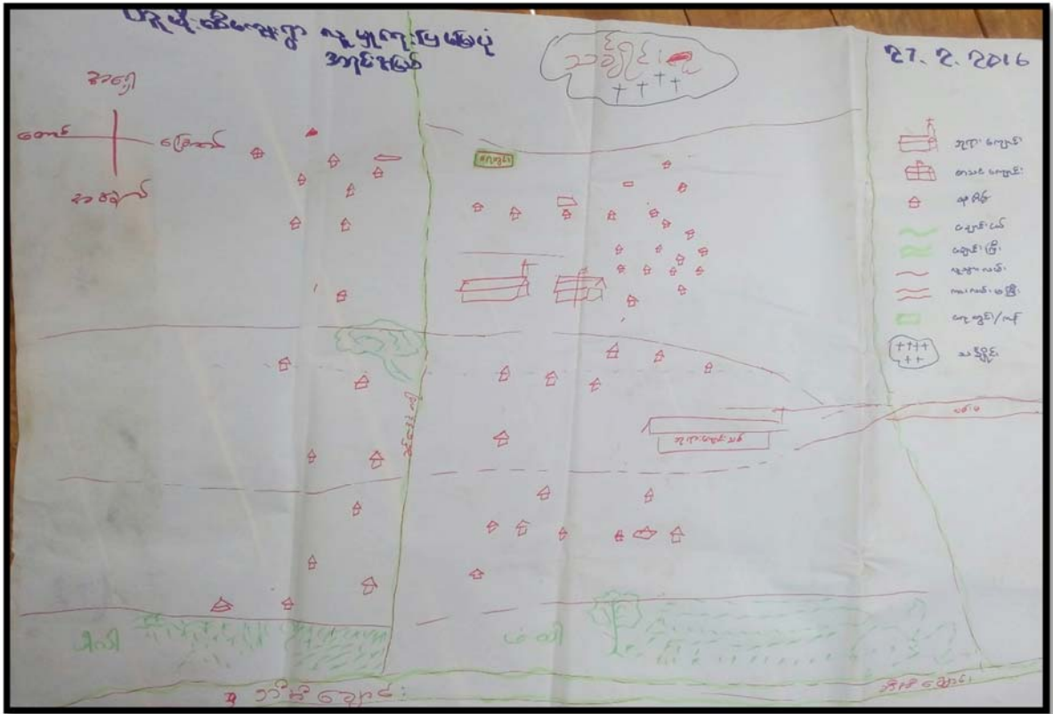
ကျေးရွာအရင်းမြစ်ပြမြေပုံ (Social Map)