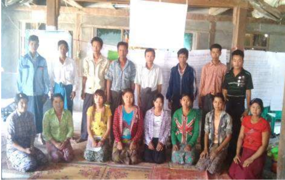
ကွင်းကြီးကျေးရွာ စီမံကိန်းအထောက်အကူပြုကော်မတီဝင်များ