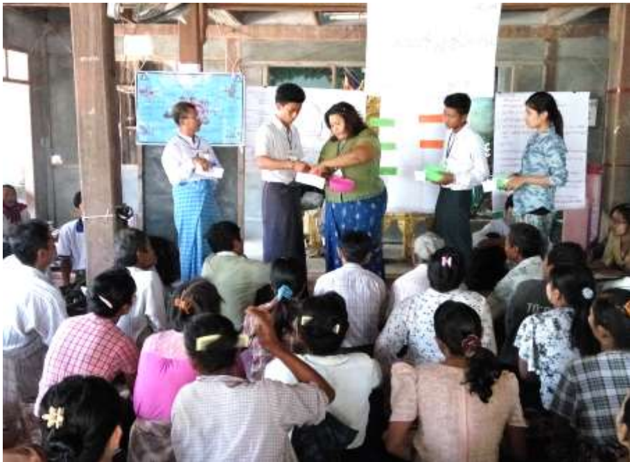
ပွင့်လင်းမြင်သာမှုရှိစေရန် မဲစနစ်ဖြင့်ရွေးချယ်နေပုံ