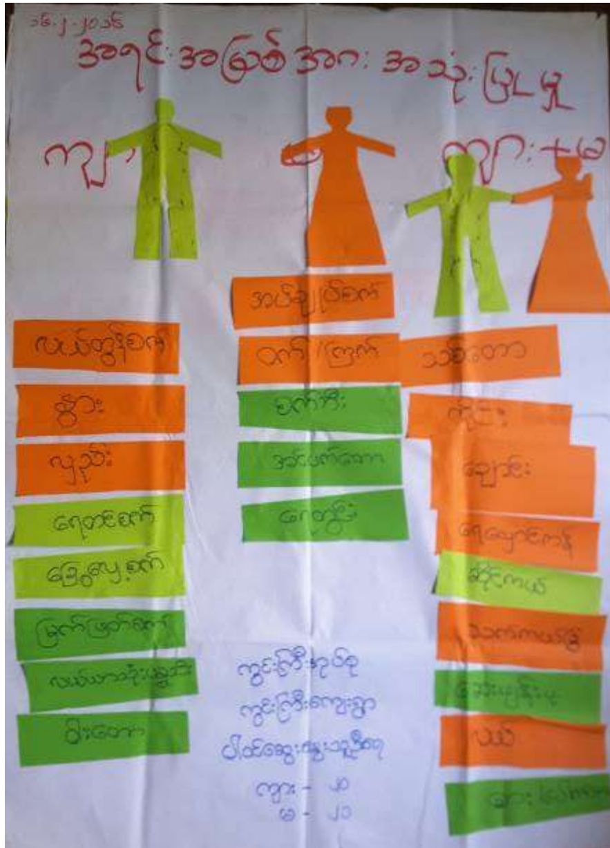
အရင်းအမြစ်များအပေါ်တွင် အသုံးပြုမှု