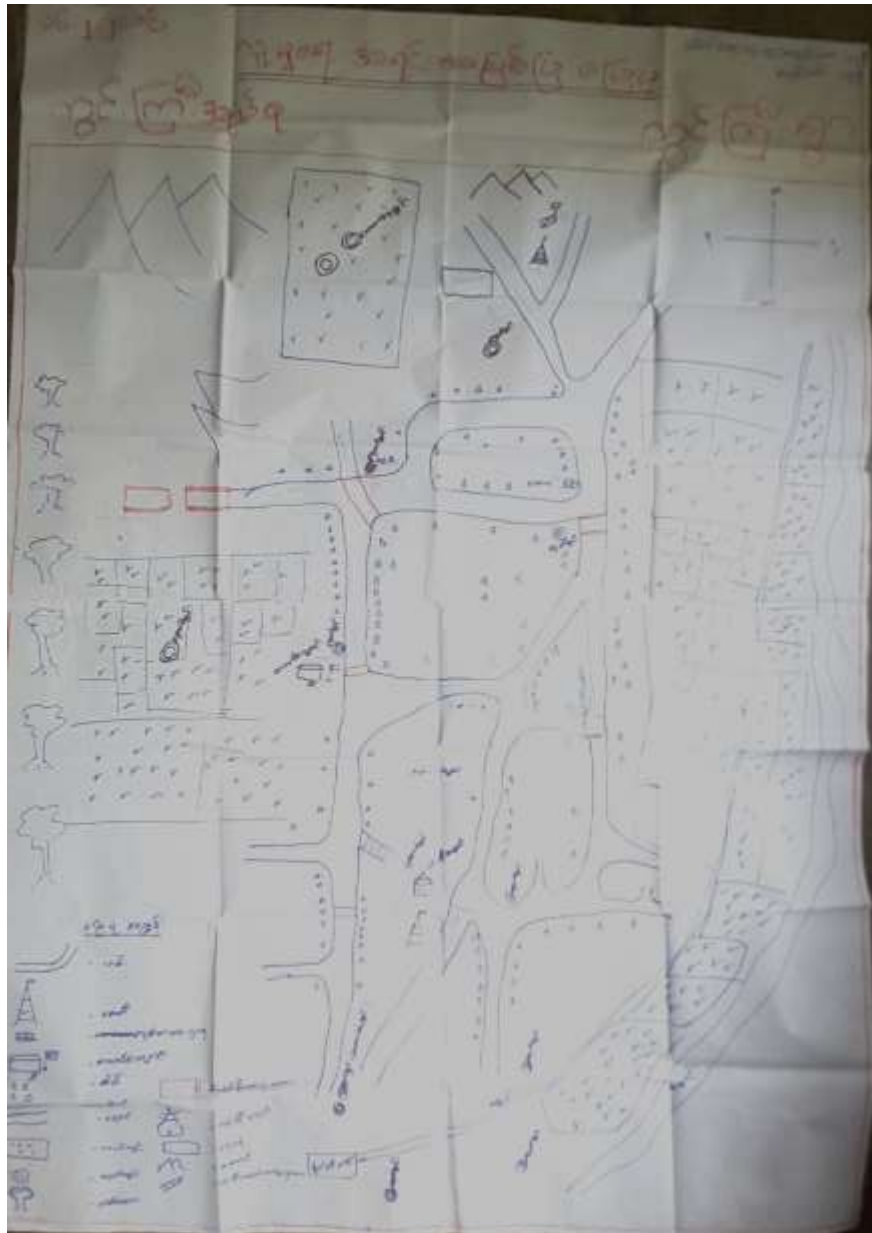
လူမှုနှင့်သဘာဝအရင်းအမြစ်ပြမြေပုံ

(က)လူမှုနှင့်သဘာဝအရင်းပြမြေပုံ နှင့် သုံးသပ်ချက်