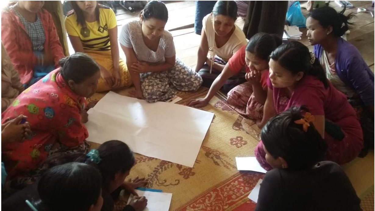
၂၄။ ကော်မတီဝင်များရွေးချယ်ခြင်းနှင့် ကျေးရွာဖွံ့ဖြိုးရေးအစီအစဉ်ဆောင်ရွက်မှုမှတ်တမ်းခါတ်ပုံများ