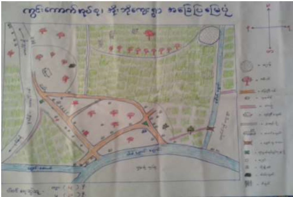
သုံးသပ်ချက်