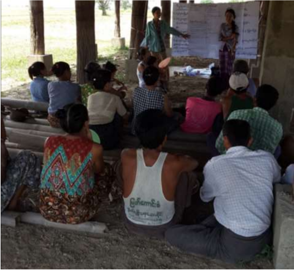
သာပေါင်းမြို့နယ်၊ သရက်တောကျေးရွာအုပ်စု ၊ ပန်းပင်ဆိပ်ကျေးရွာတွင် PRA tool များပြုလုပ်နေပုံများ