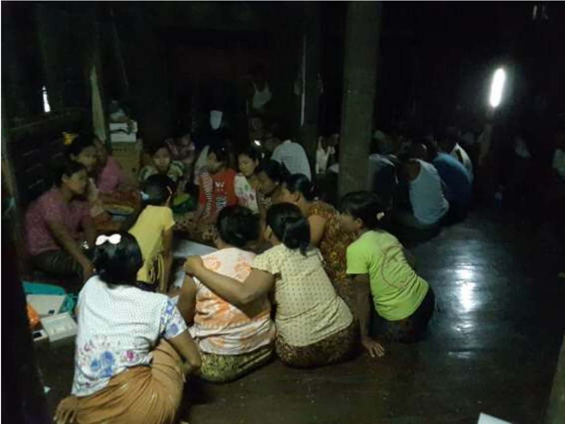
သာပေါင်းမြို့နယ်၊ သရက်တောကျေးရွာအုပ်စု ၊ မာလကာကုန်းကျေးရွာတွင် PRA tool များပြုလုပ်နေပုံများ