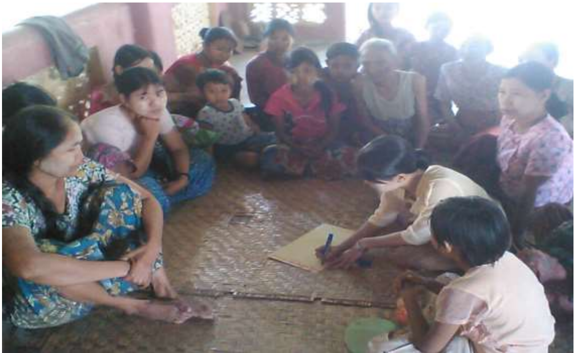
သာပေါင်းမြို့နယ်၊ ကွင်းခြောက်ကျေးရွာအုပ်စု၊ တလုတ်ပင်ကွင်းကျေးရွာတွင် အစည်းအဝေးပြုလုပ်ပုံ