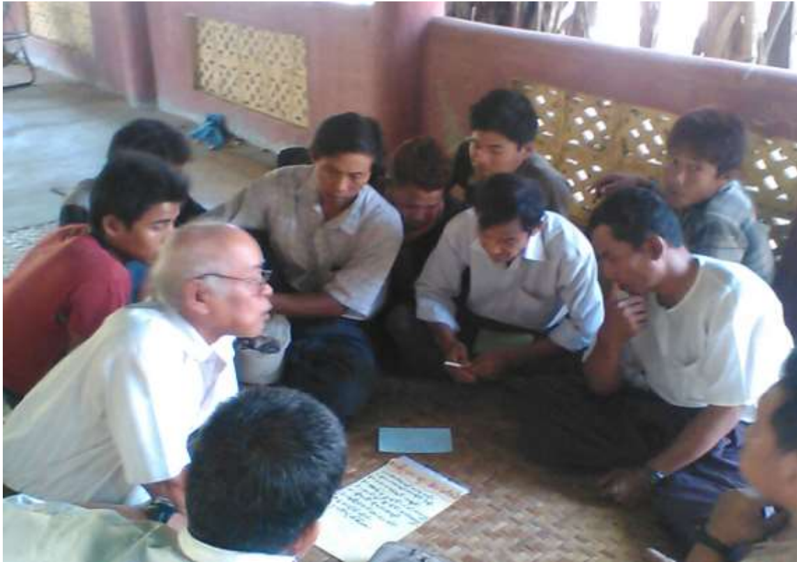
သာပေါင်းမြို့နယ်၊ ကွင်းခြောက်ကျေးရွာအုပ်စု၊ တလုတ်ပင်ကွင်းကျေးရွာတွင် အစည်းအဝေးပြုလုပ်ပုံ