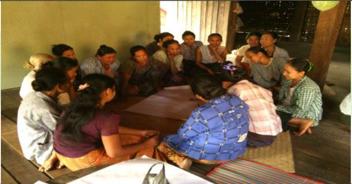
အမျိုးသမီး အုပ်စု