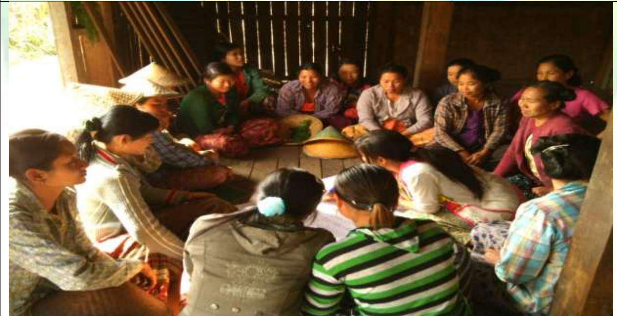
ကော်မတီရွေးချယ်ခြင်း မှတ်တမ်းခါတ်ပုံ