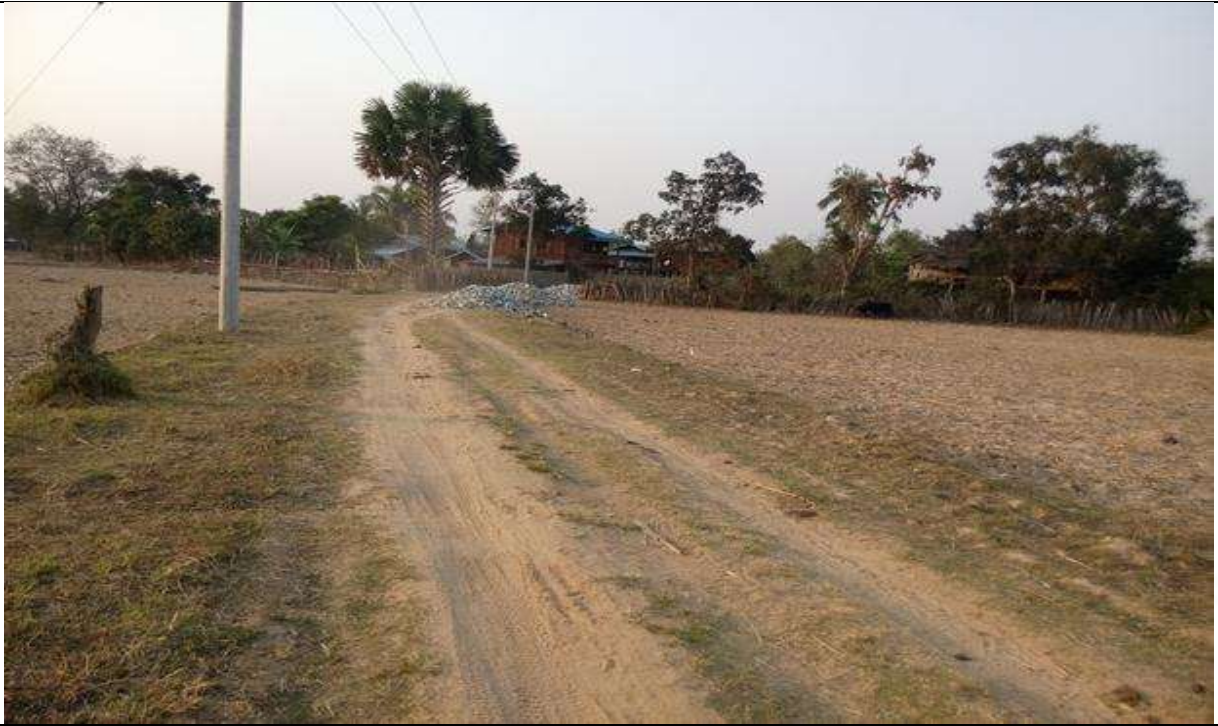
လုပ်ငန်းခွဲ၏မပြုလုပ်မီ မှတ်တမ်းဓာတ်ပုံ