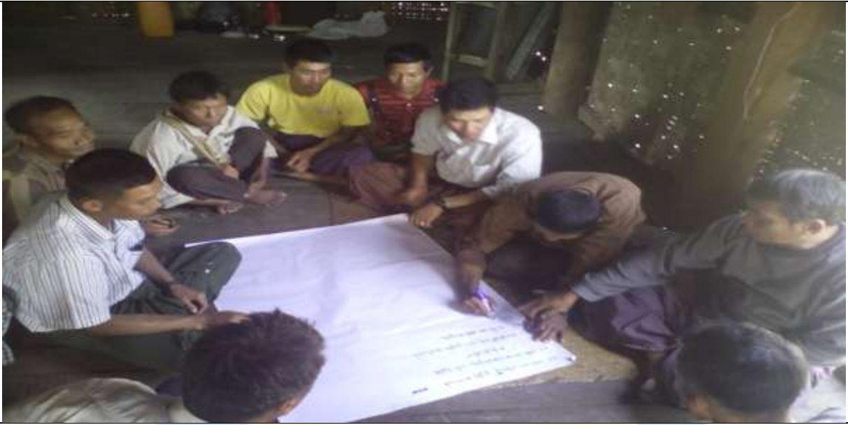
အမျိုးသားအုပ်စု