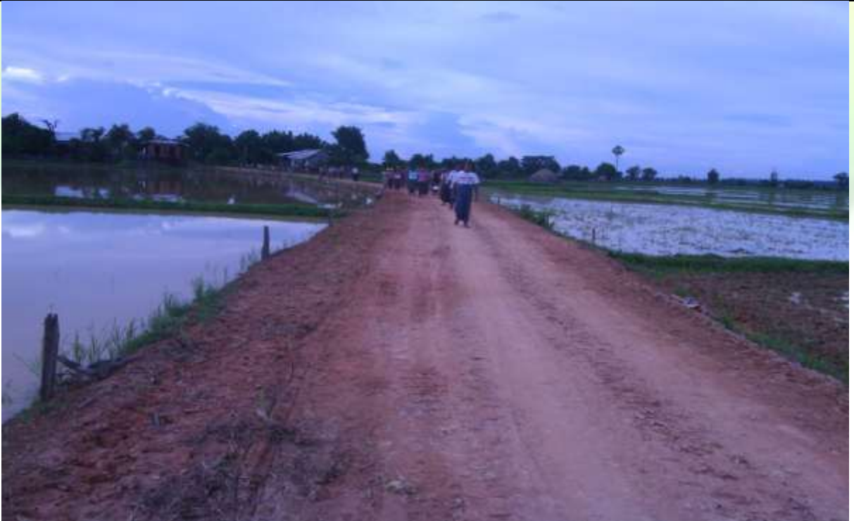
လုပ်ငန်းခွဲ၏ လုပ်ဆောင်ပြီး မှတ်တမ်းဓာတ်ပုံ