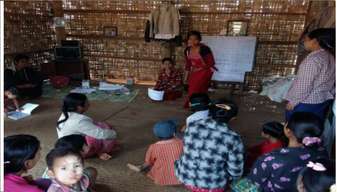
စေတနာ့ဝန်ထမ်းများ ရွေးချယ်ခြင်း မှတ်တမ်းခါတ်ပုံ