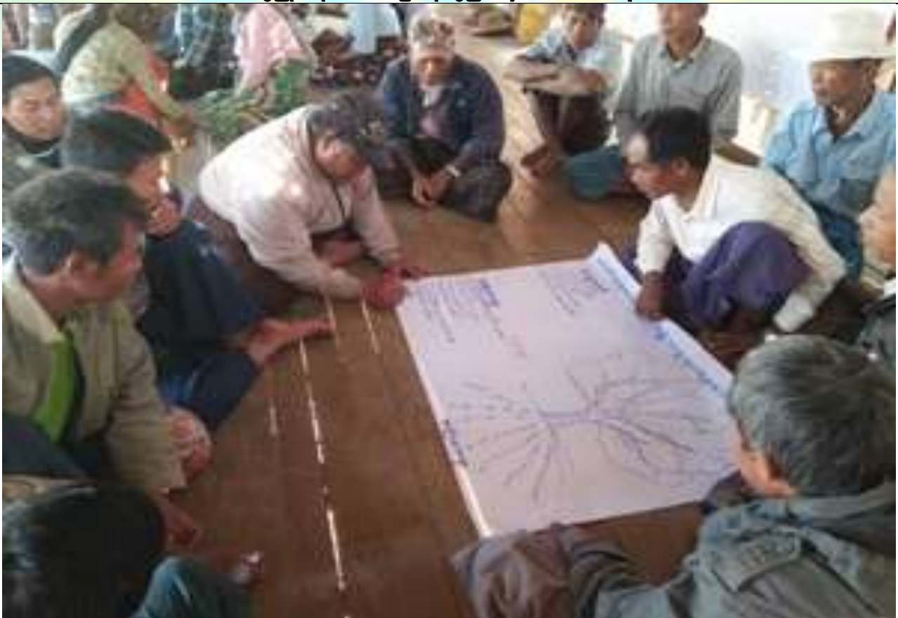
ဖွံ့ဖြိုးရေးအစီအစဉ်ရေးဆွဲခြင်း မှတ်တမ်းဓါတ်ပုံ