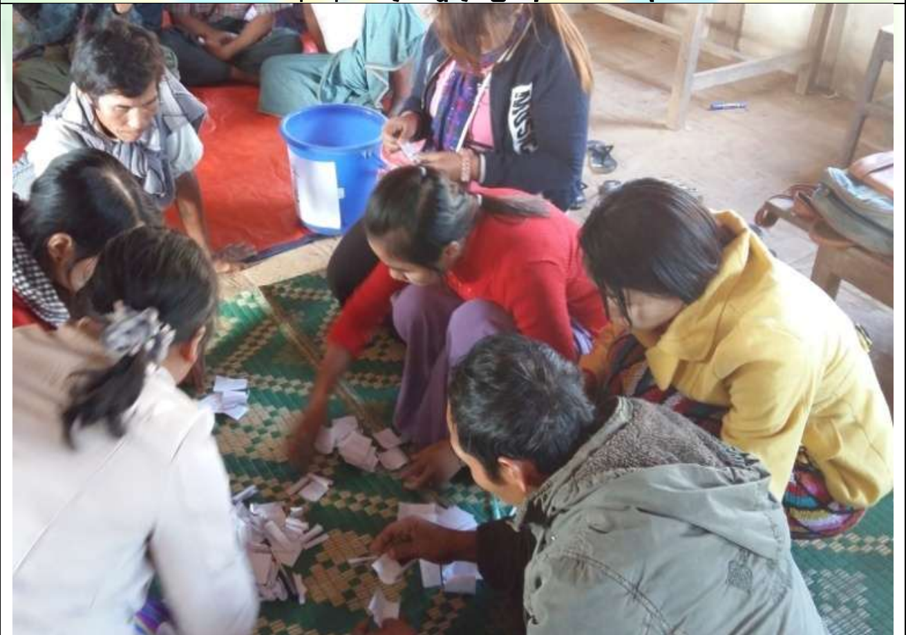
ကော်မတီရွေးချယ်ခြင်း မှတ်တမ်းခါတ်ပုံ