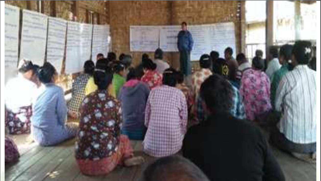
စေတနာ့ဝန်ထမ်းများ ရွေးချယ်ခြင်း မှတ်တမ်းခါတ်ပုံ