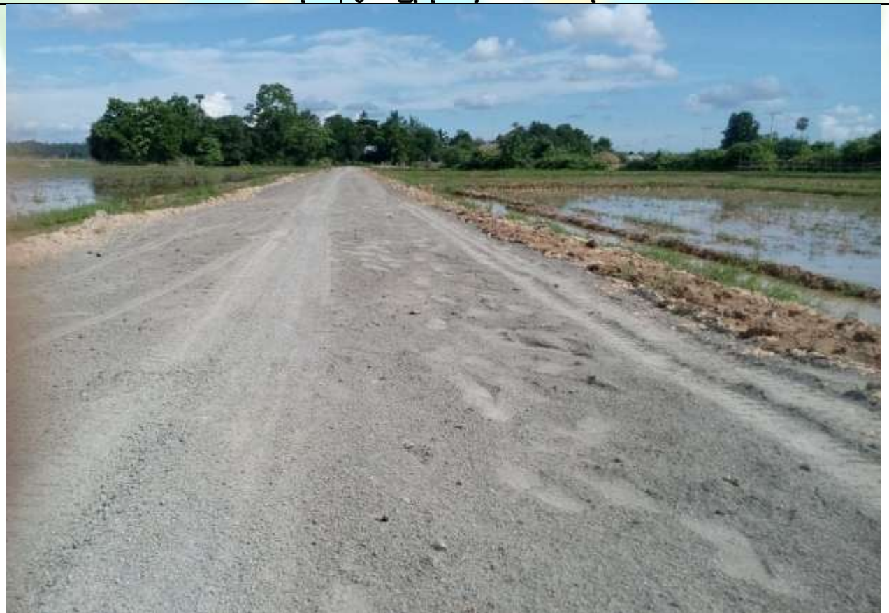
လုပ်ငန်းခွဲပြုလုပ်ပြီး မှတ်တမ်းခါတ်ပုံ