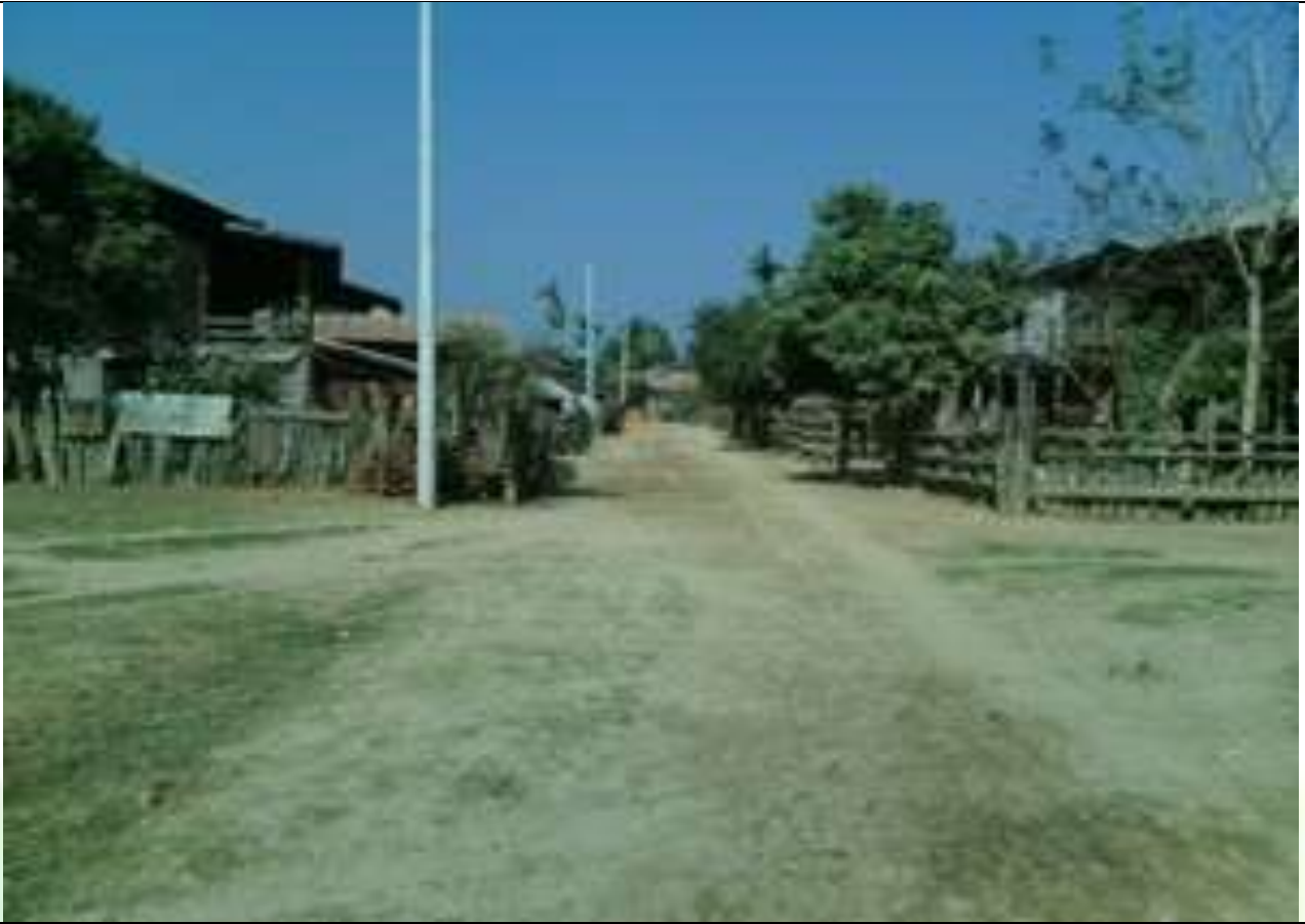
လုပ်ငန်းခွဲ၏မပြုလုပ်မီ မှတ်တမ်းခါတ်ပုံ