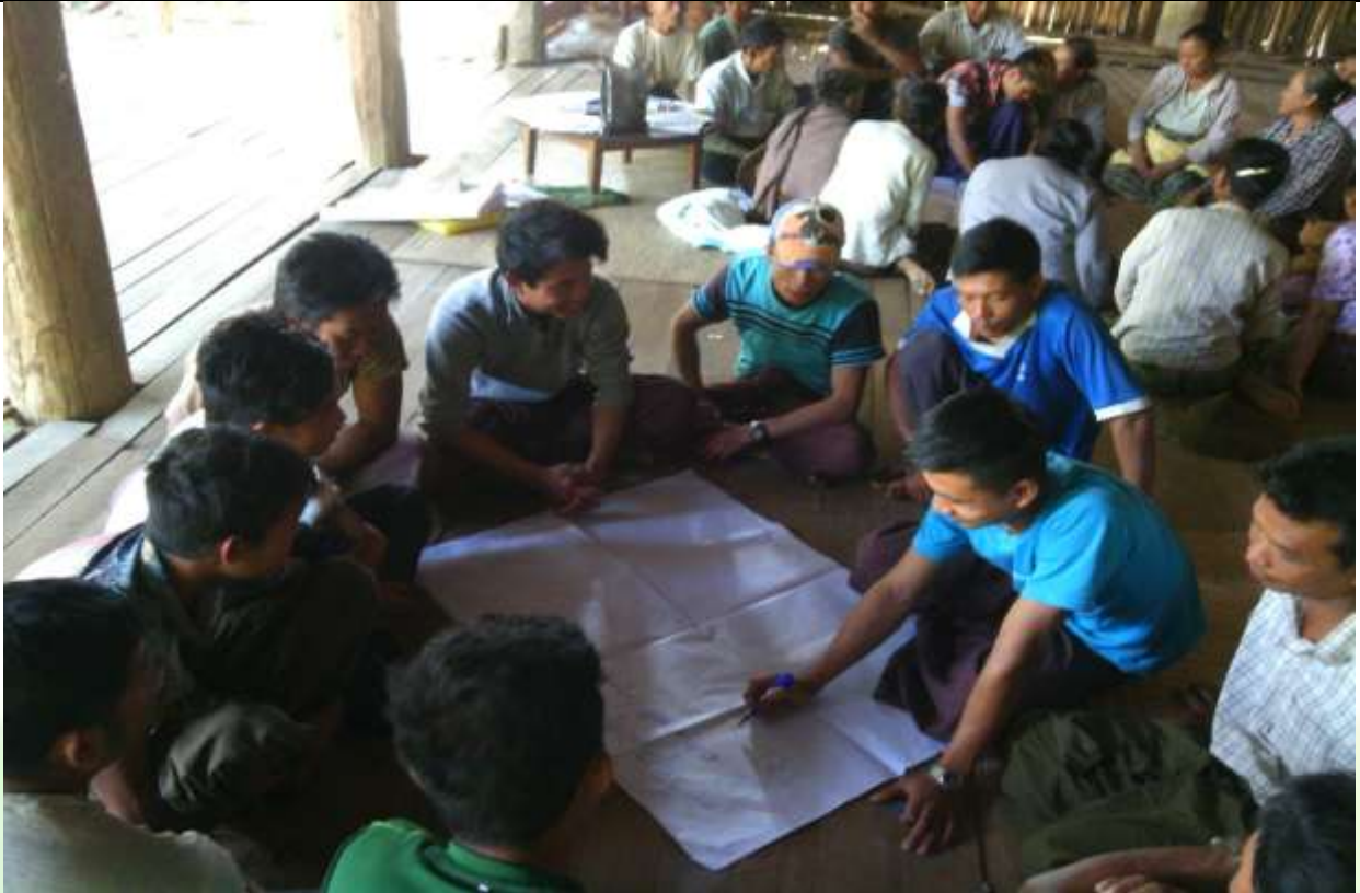
အမျိုးသားအုပ်စု၏ မှတ်တမ်းဓာတ်ပုံ