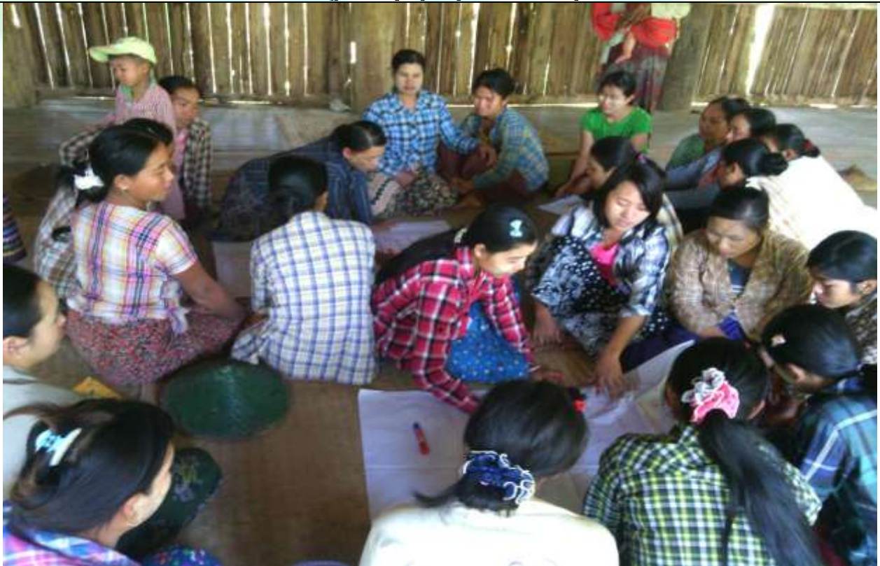
အမျိုးသမီးအုပ်စု၏ မှတ်တမ်းဓာတ်ပုံ