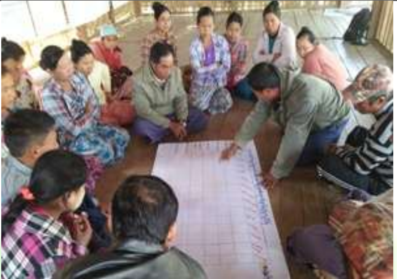
ဖွံ့ဖြိုးရေးအစီအစဉ်ရေးဆွဲခြင်း မှတ်တမ်းဓါတ်ပုံ