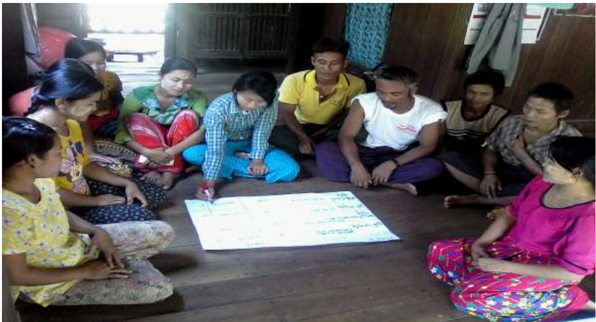
သာပေါင်းမြို့နယ်၊ လှေကြီးတက်အုပ်စု။ တပ်ကုန်းကျေးရွာတွင် PRA Tools များ ပြုလုပ်ပုံ