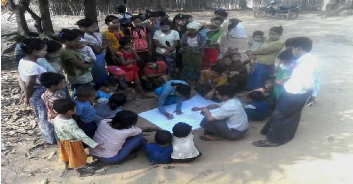
သာပေါင်းမြို့နယ်၊ လှေကြီးတက်အုပ်စု။ တပ်ကုန်းကျေးရွာတွင် PRA Tools များ ပြုလုပ်ပုံ