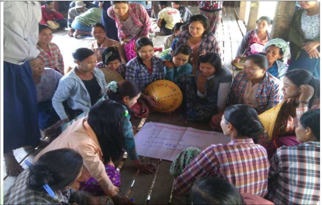
လူငယ်အုပ်စု၏ မှတ်တမ်းခါတ်ပုံ