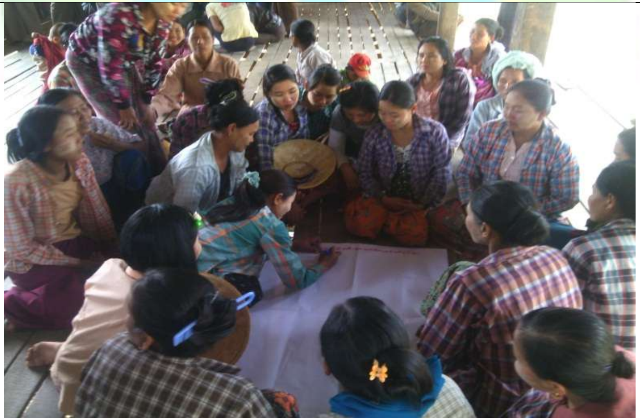
ဖွံ့ဖြိုးရေးအစီအစဉ်ရေးဆွဲခြင်း မှတ်တမ်းဓာတ်ပုံ