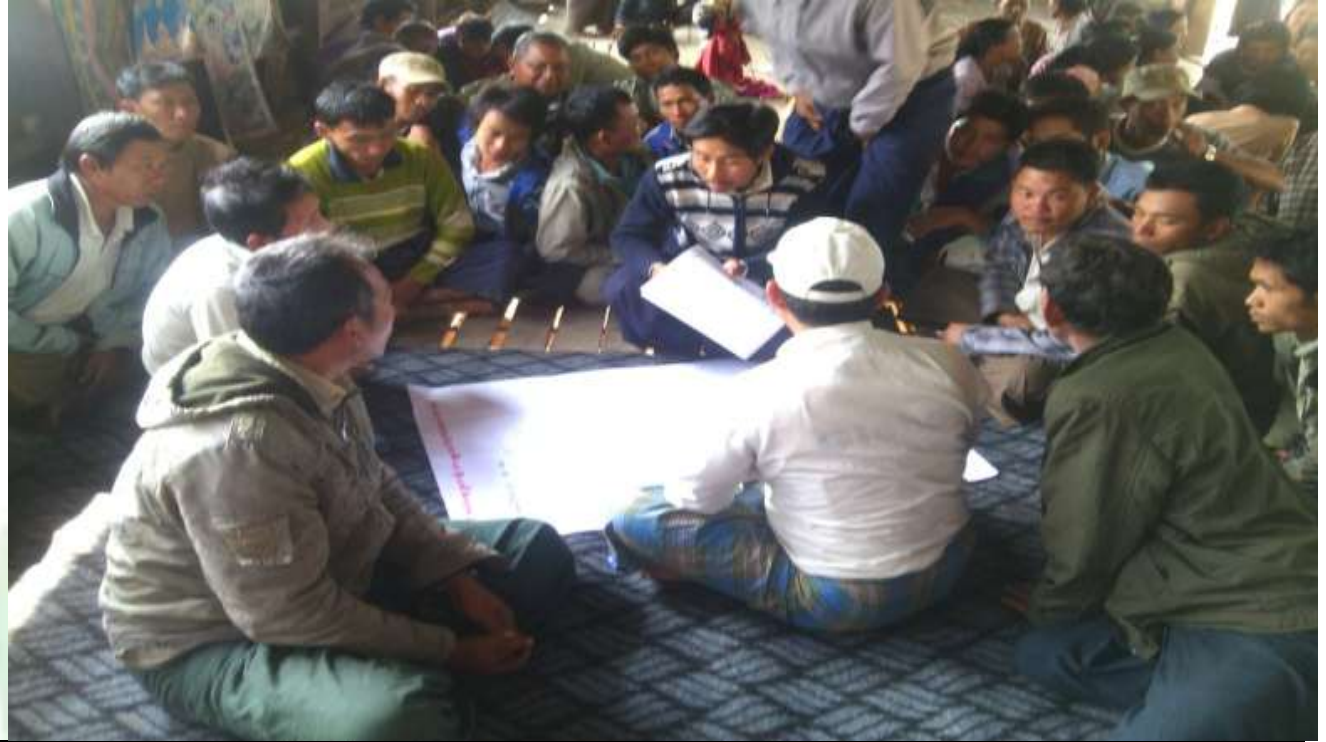
အမျိုးသားအုပ်စု၏ မှတ်တမ်းခါတ်ပုံ