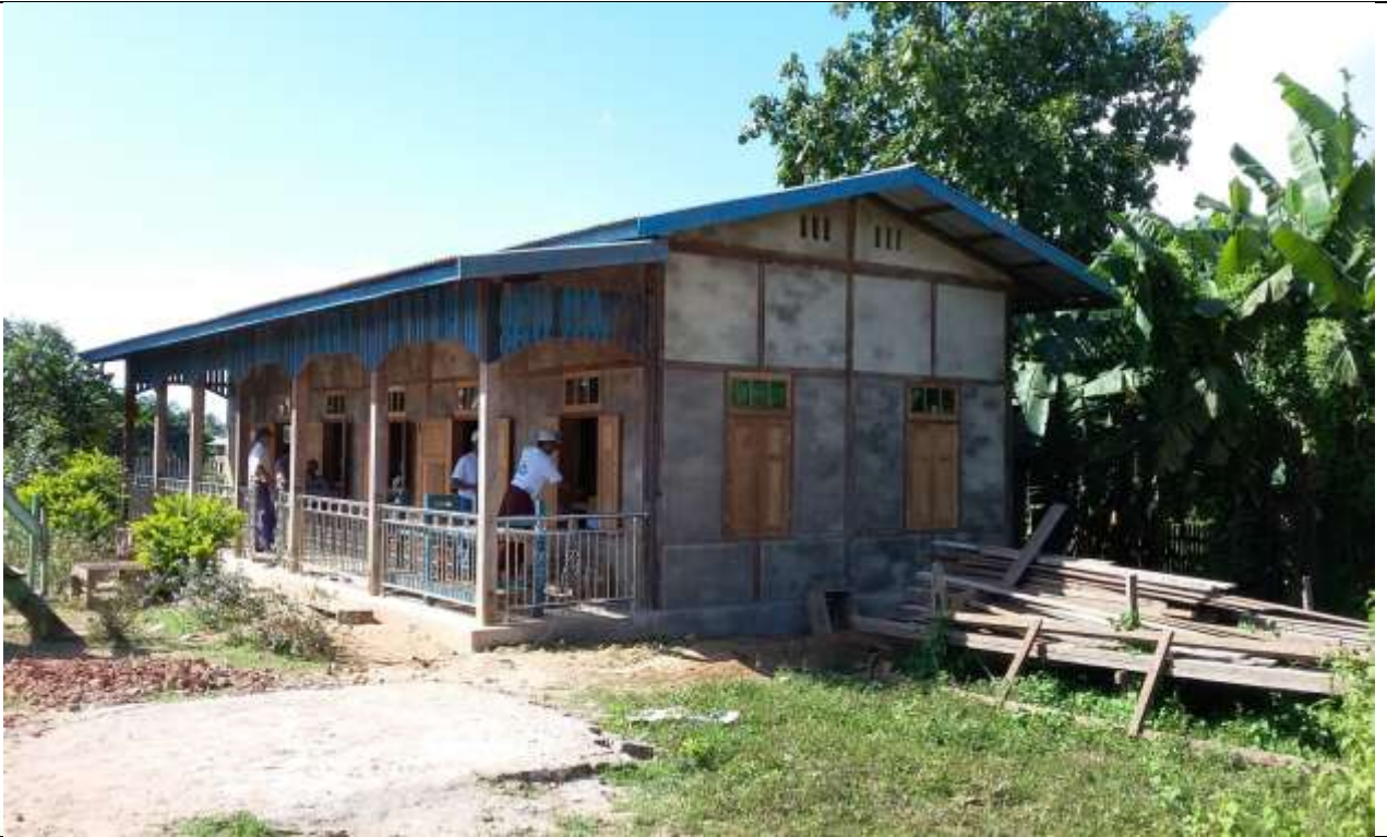
ပထမနှစ်စီမံကိန်းလုပ်ငန်းခွဲဆောင်ရွက်ပြီးစီးမှုမှတ်တမ်းဓာတ်ပုံ