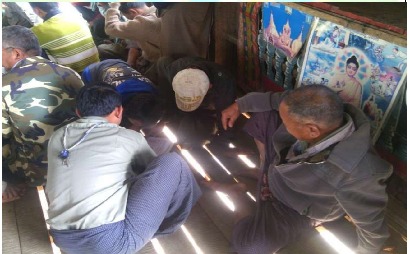
ထိခိုက်လွယ်အုပ်စုများ၏ မှတ်တမ်းခါတ်ပုံ