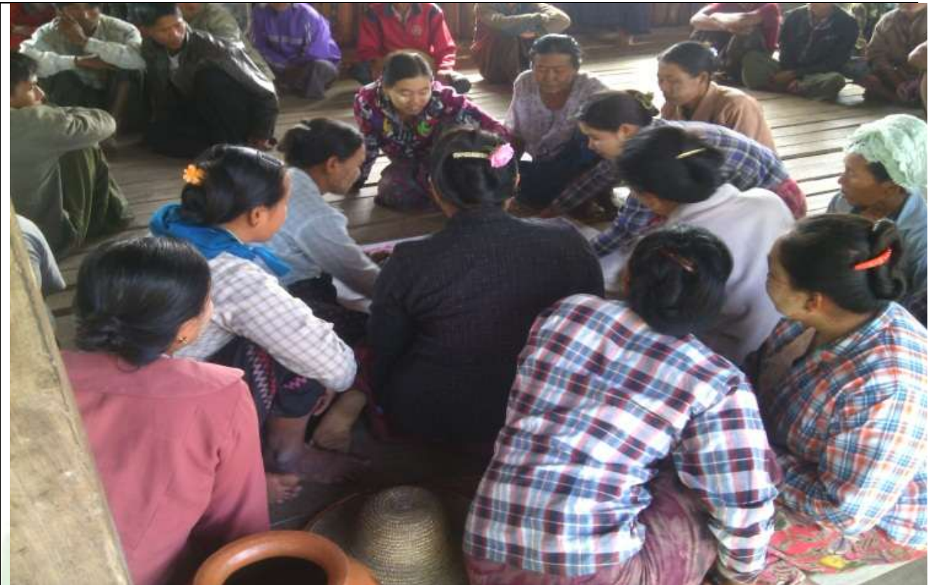
စေတနာ့ဝန်ထမ်းများ ရွေးချယ်ခြင်း မှတ်တမ်းဓာတ်ပုံ