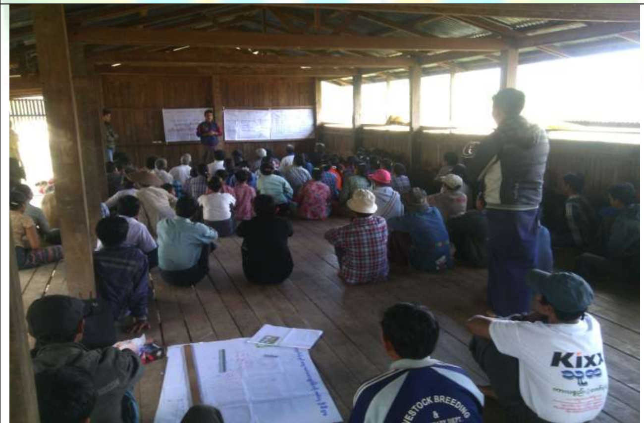
ကော်မတီရွေးချယ်ခြင်း မှတ်တမ်းဓာတ်ပုံ