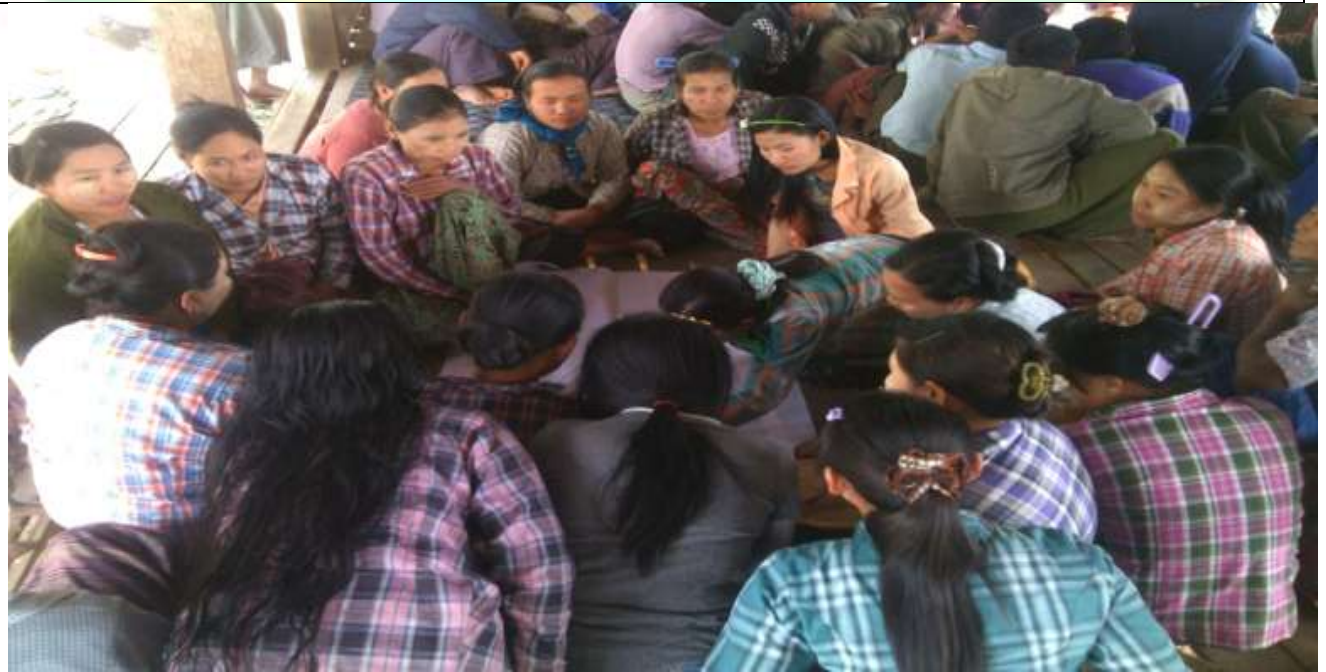
အမျိုးသမီးအုပ်စု၏ မှတ်တမ်းခါတ်ပုံ