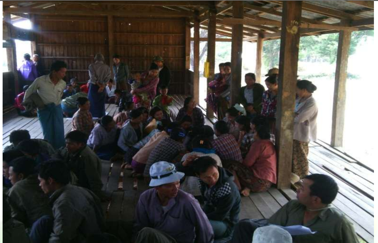
ဖွံ့ဖြိုးရေးအစီအစဉ်ရေးဆွဲခြင်း မှတ်တမ်းဓာတ်ပုံ