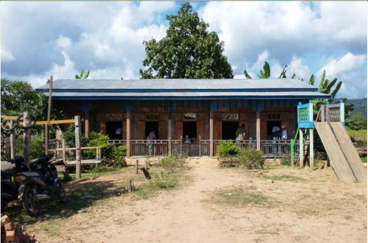
ပထမနှစ်စီမံကိန်းလုပ်ငန်းခွဲဆောင်ရွက်ပြီးစီးမှုမှတ်တမ်းဓာတ်ပုံ