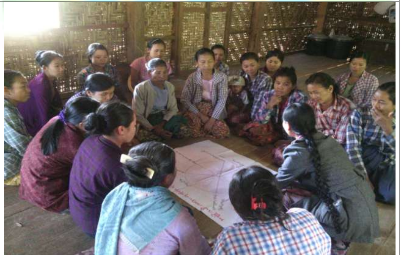
ထိခိုက်လွယ်အုပ်စုများ၏ မှတ်တမ်းခါတ်ပုံ