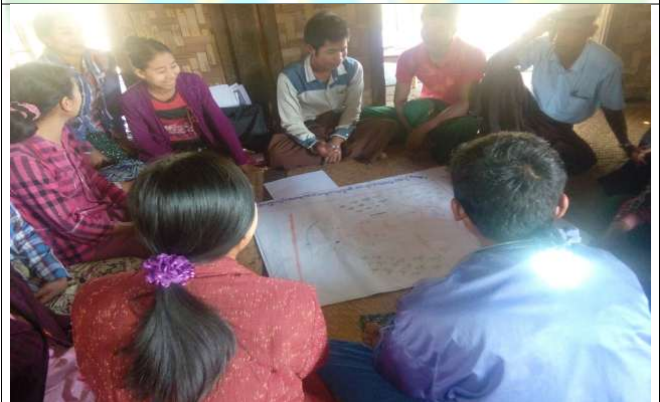
အမျိုးသမီးအုပ်စု၏ မှတ်တမ်းခါတ်ပုံ