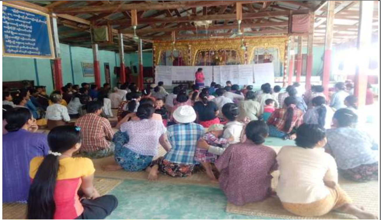
စေတနာ့ဝန်ထမ်းများ ရွေးချယ်ခြင်း မှတ်တမ်းဓာတ်ပုံ