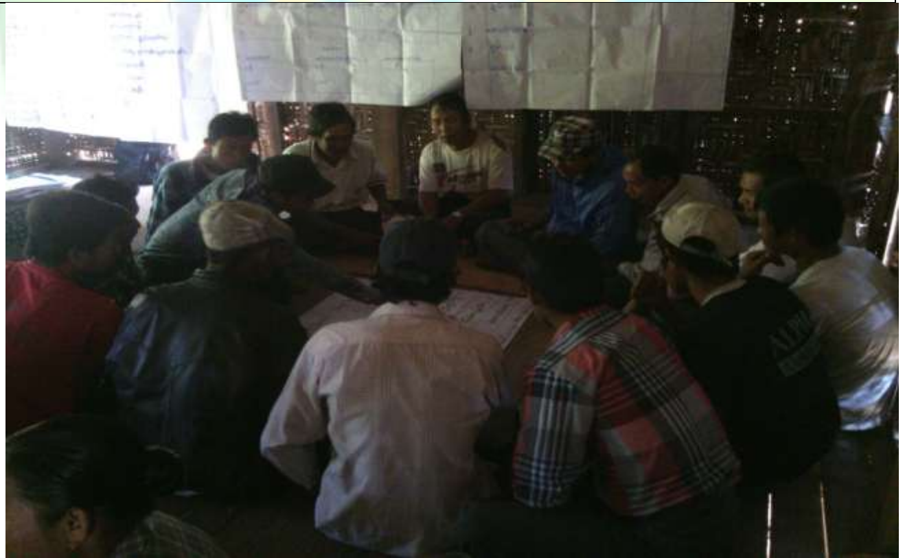
ဖွံ့ဖြိုးရေးအစီအစဉ်ရေးဆွဲခြင်း မှတ်တမ်းဓာတ်ပုံ