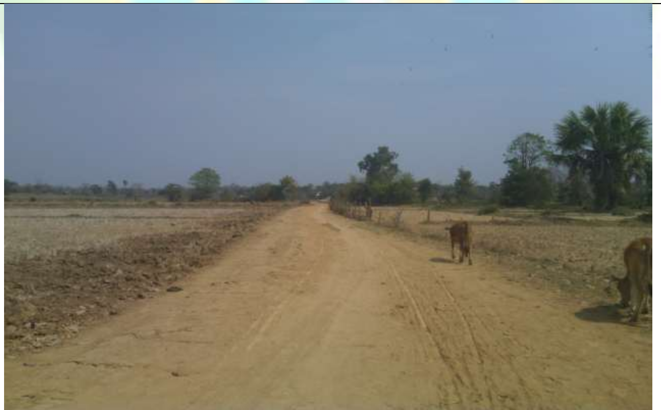
လုပ်ငန်းခွဲ၏မပြုလုပ်မီ မှတ်တမ်းခါတ်ပုံ