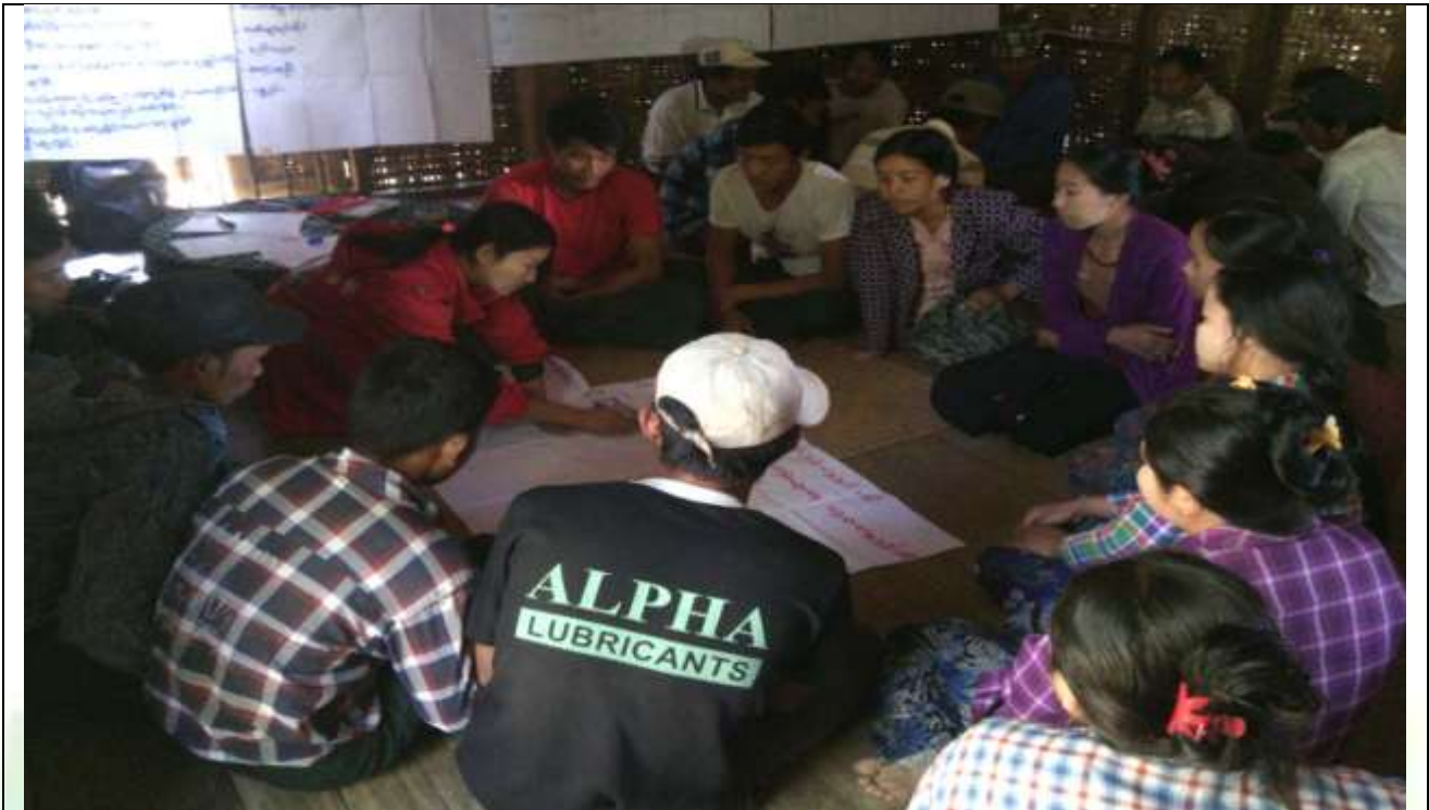
အမျိုးသားအုပ်စု၏ မှတ်တမ်းခါတ်ပုံ