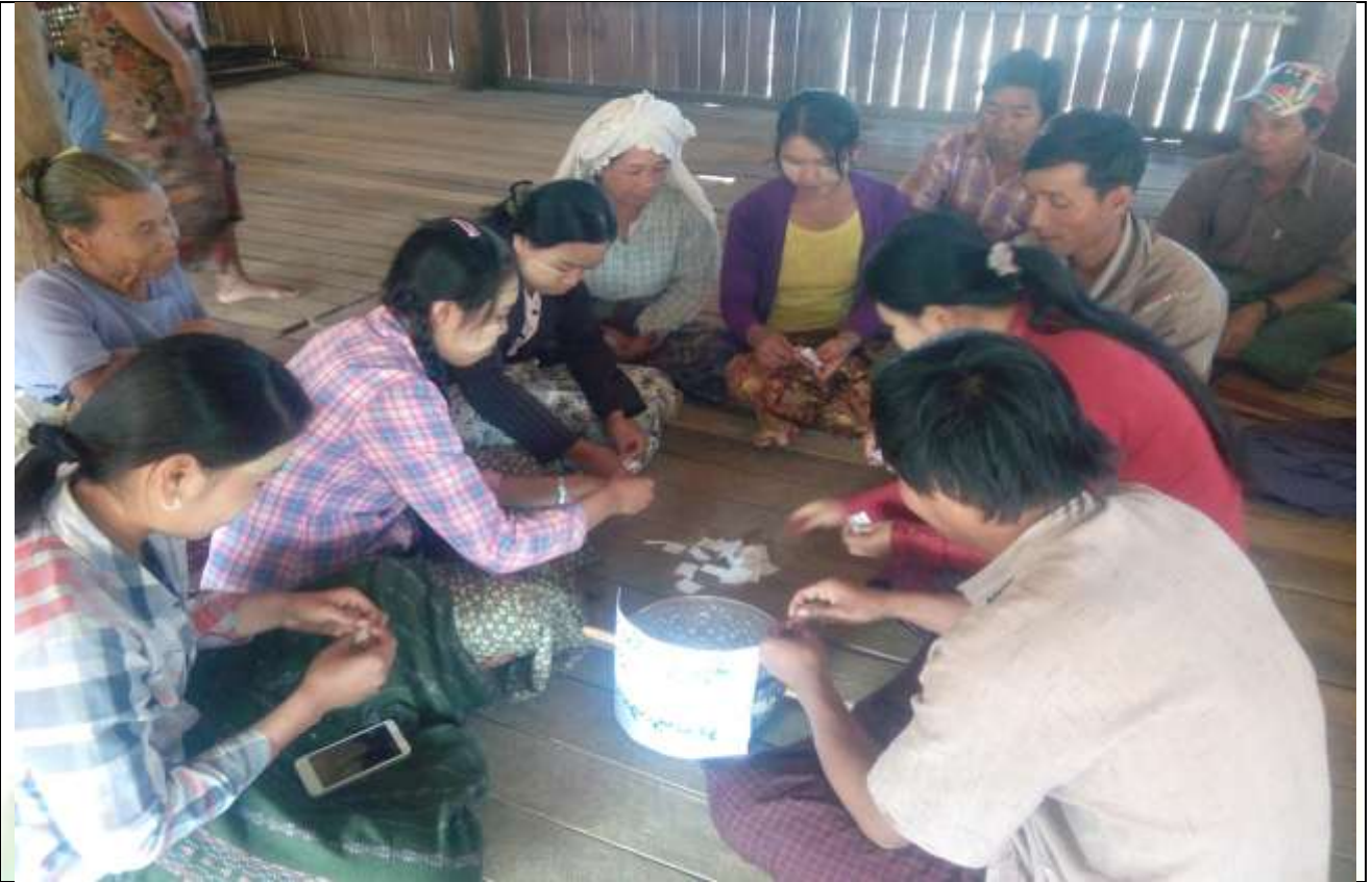
လူငယ်အုပ်စု၏ မှတ်တမ်းခါတ်ပုံ