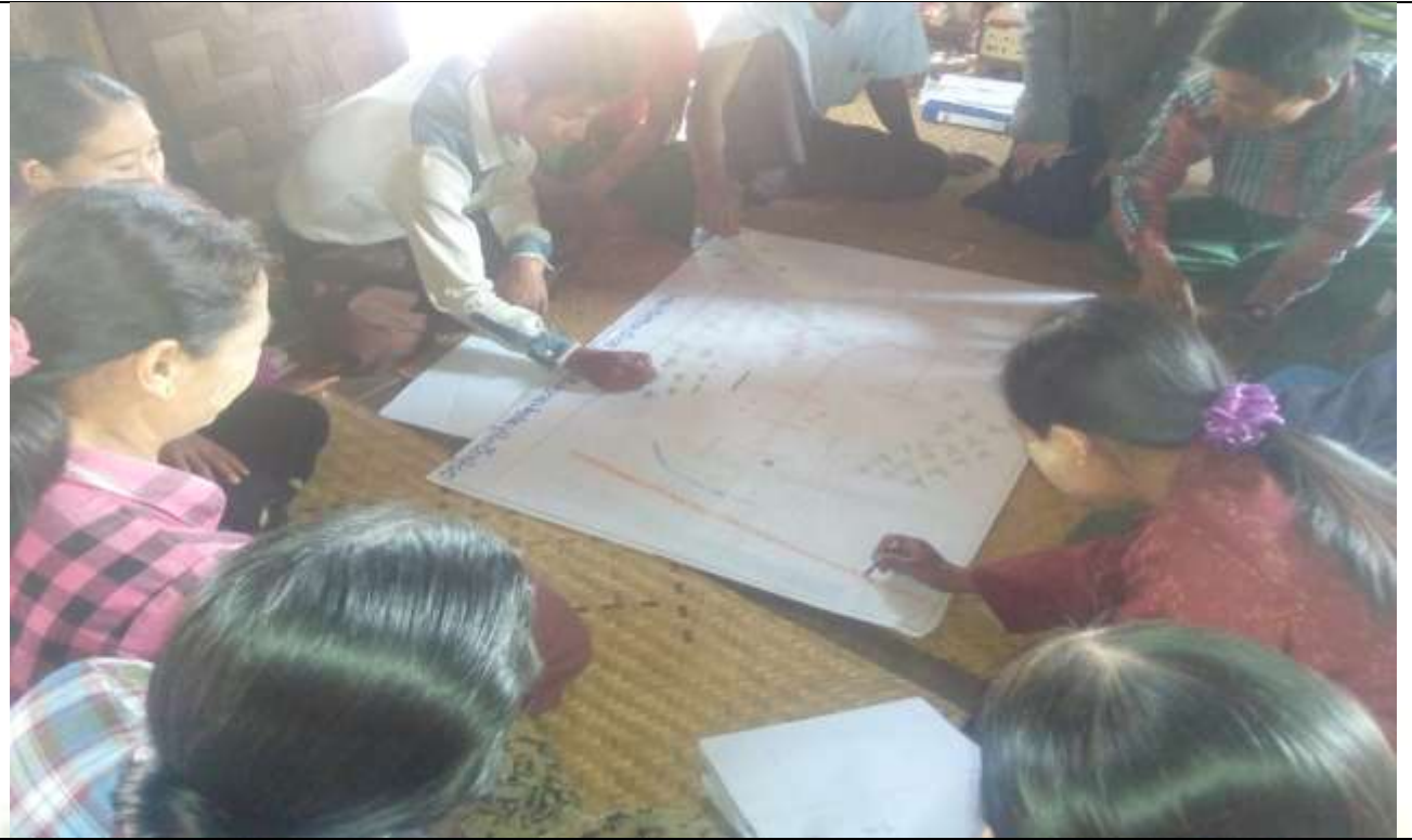
ဖွံ့ဖြိုးရေးအစီအစဉ်ရေးဆွဲခြင်း မှတ်တမ်းဓာတ်ပုံ