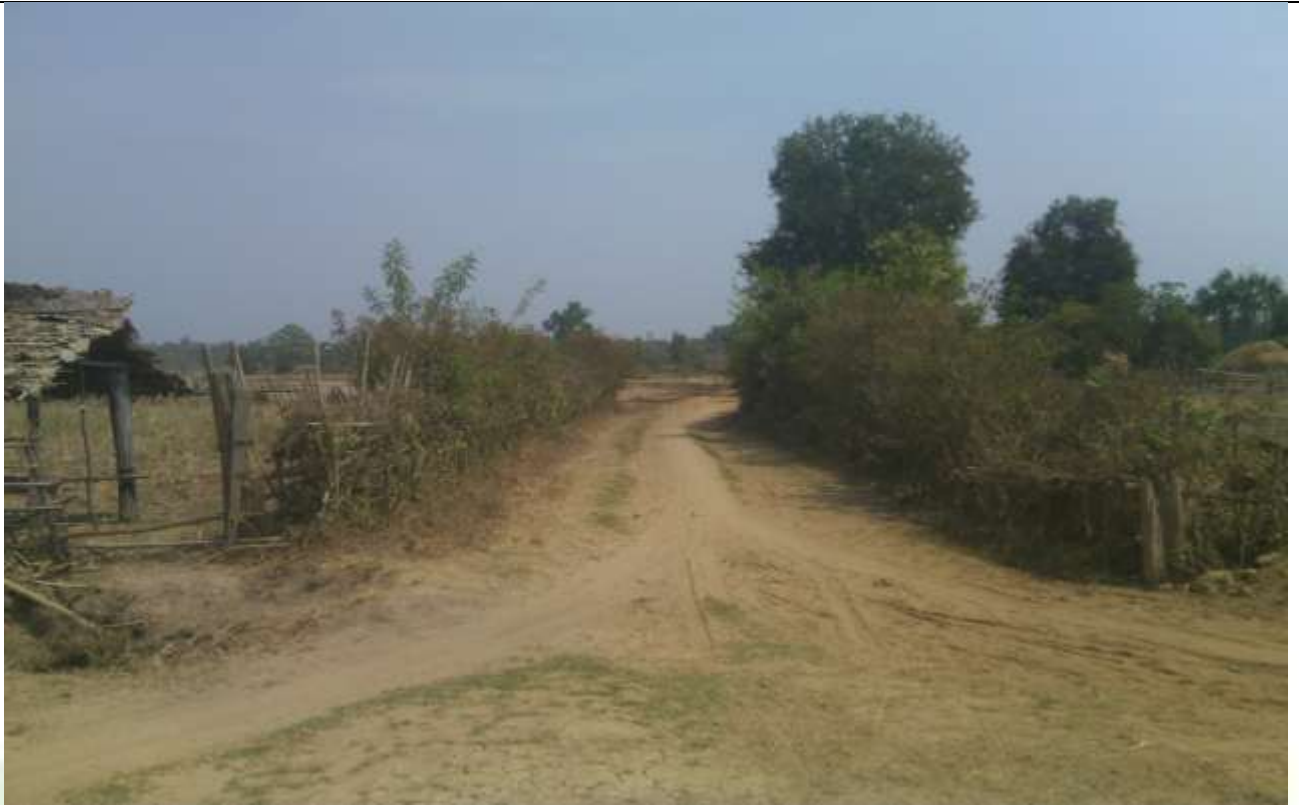
လုပ်ငန်းခွဲ၏မပြုလုပ်မီ မှတ်တမ်းခါတ်ပုံ