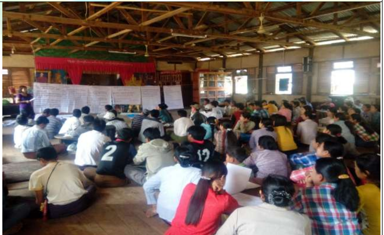
ကော်မတီရွေးချယ်ခြင်း မှတ်တမ်းဓာတ်ပုံ