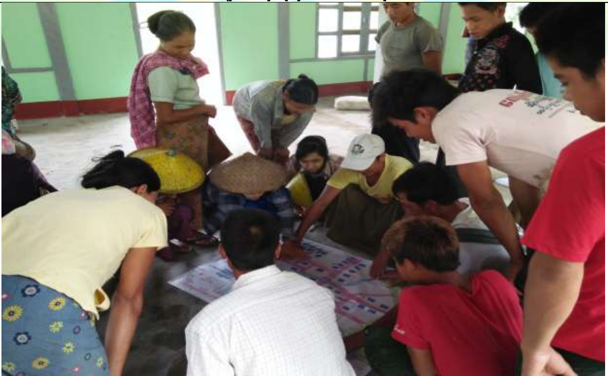
ထိနိုက်လွယ် အုပ်စု မှတ်တမ်းဓာတ်ပုံ