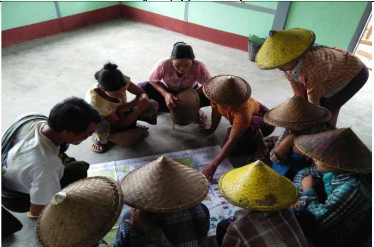
အမျိုးသမီးအုပ်စု မှတ်တမ်းခါတ်ပုံ