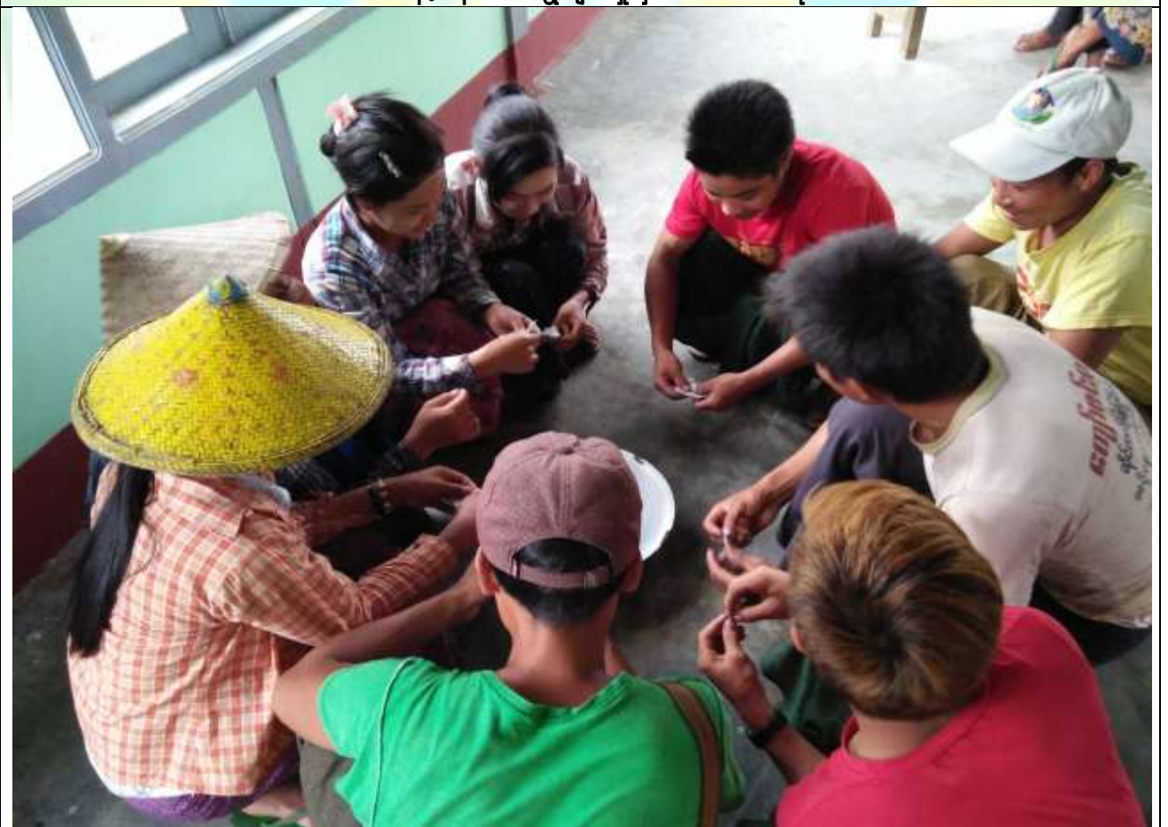
ကော်မတီဝင်များရွေးချယ်မှု မှတ်တမ်းဓာတ်ပုံ