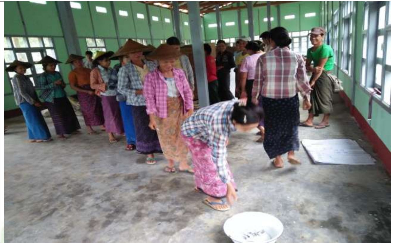
စေတနာ့ဝန်ထမ်းရွေးချယ်မှု မှတ်တမ်းဓာတ်ပုံ