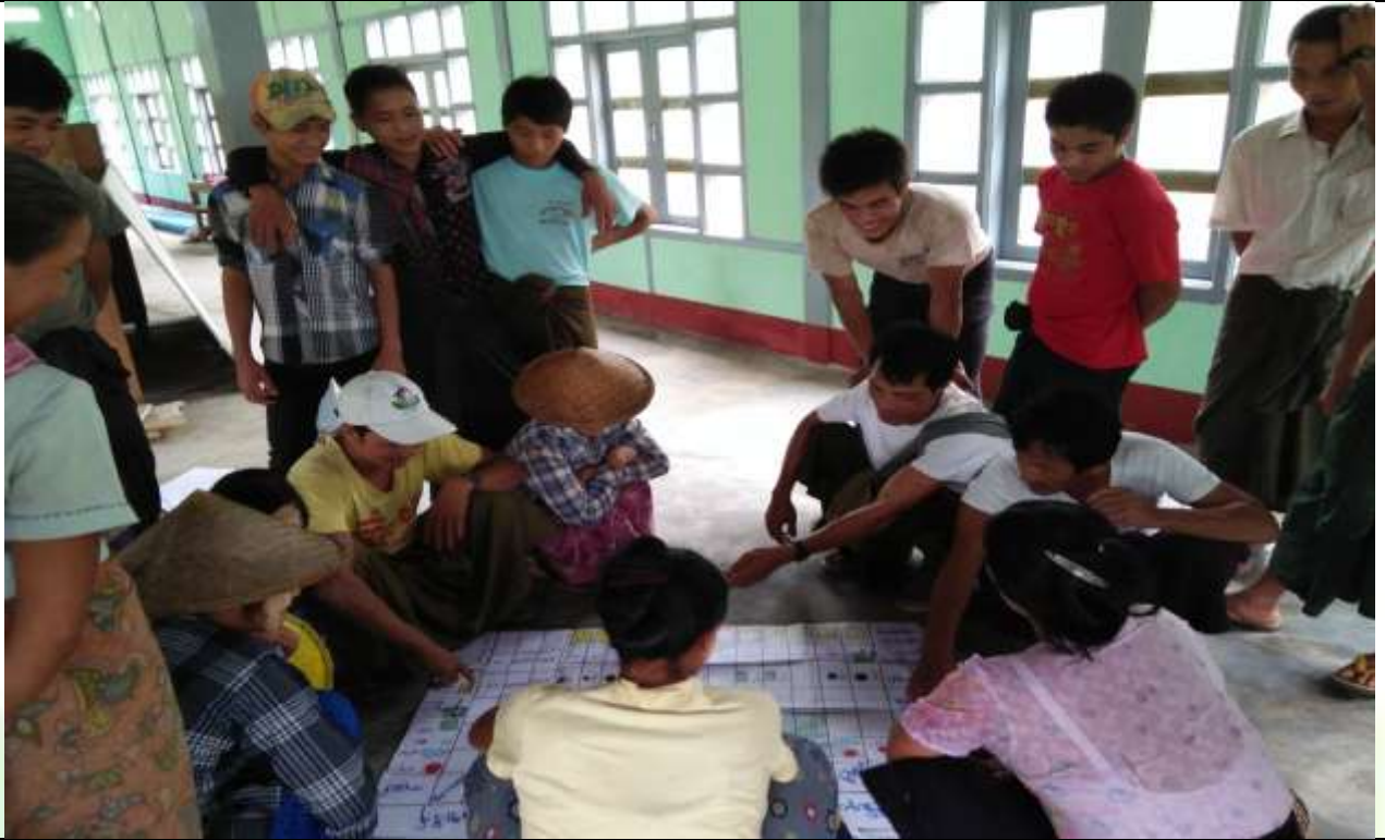
အမျိုးသားအုပ်စု မှတ်တမ်းခါတ်ပုံ