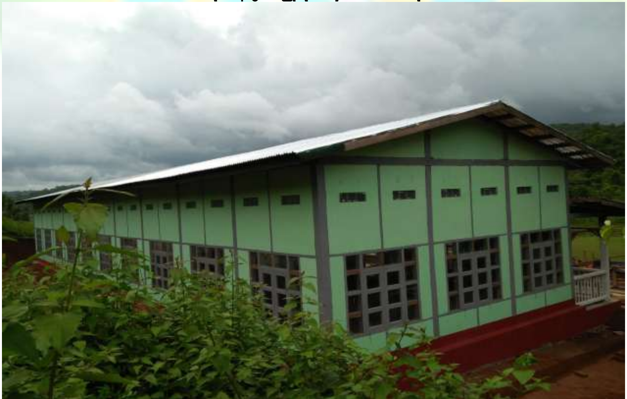
လုပ်ငန်းခွဲပြုလုပ်ဆဲ မှတ်တမ်းဓာတ်ပုံ