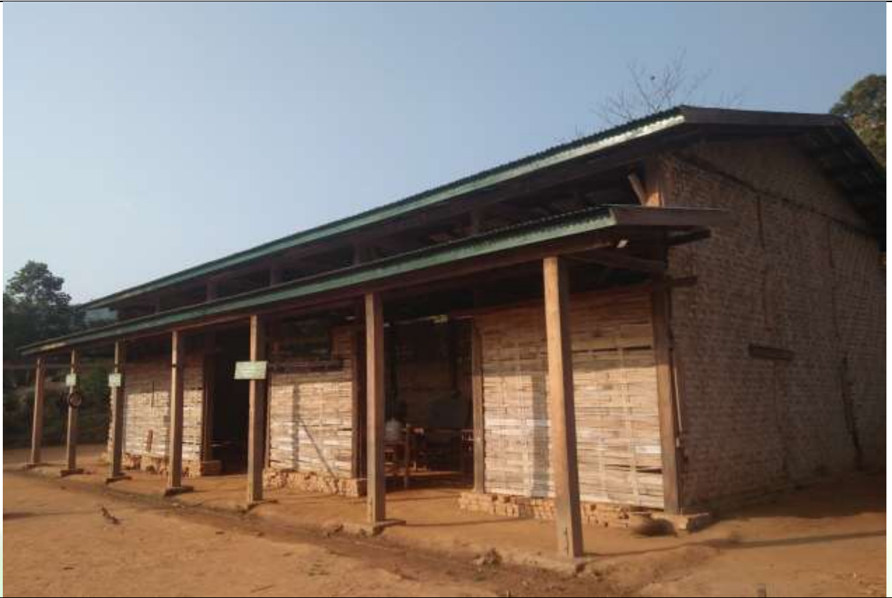
လုပ်ငန်းခွဲ၏မပြုလုပ်မီ မှတ်တမ်းဓာတ်ပုံ