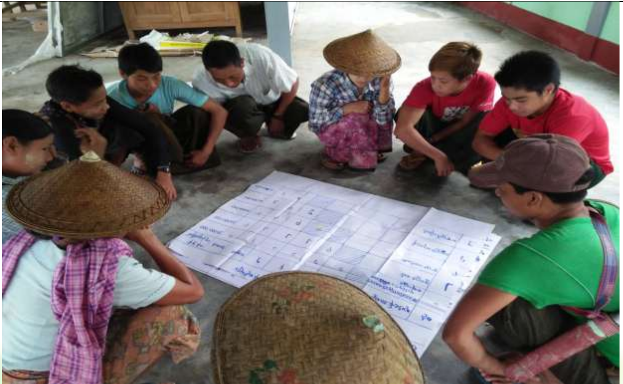
လူငယ်အုပ်စု မှတ်တမ်းဓာတ်ပုံ