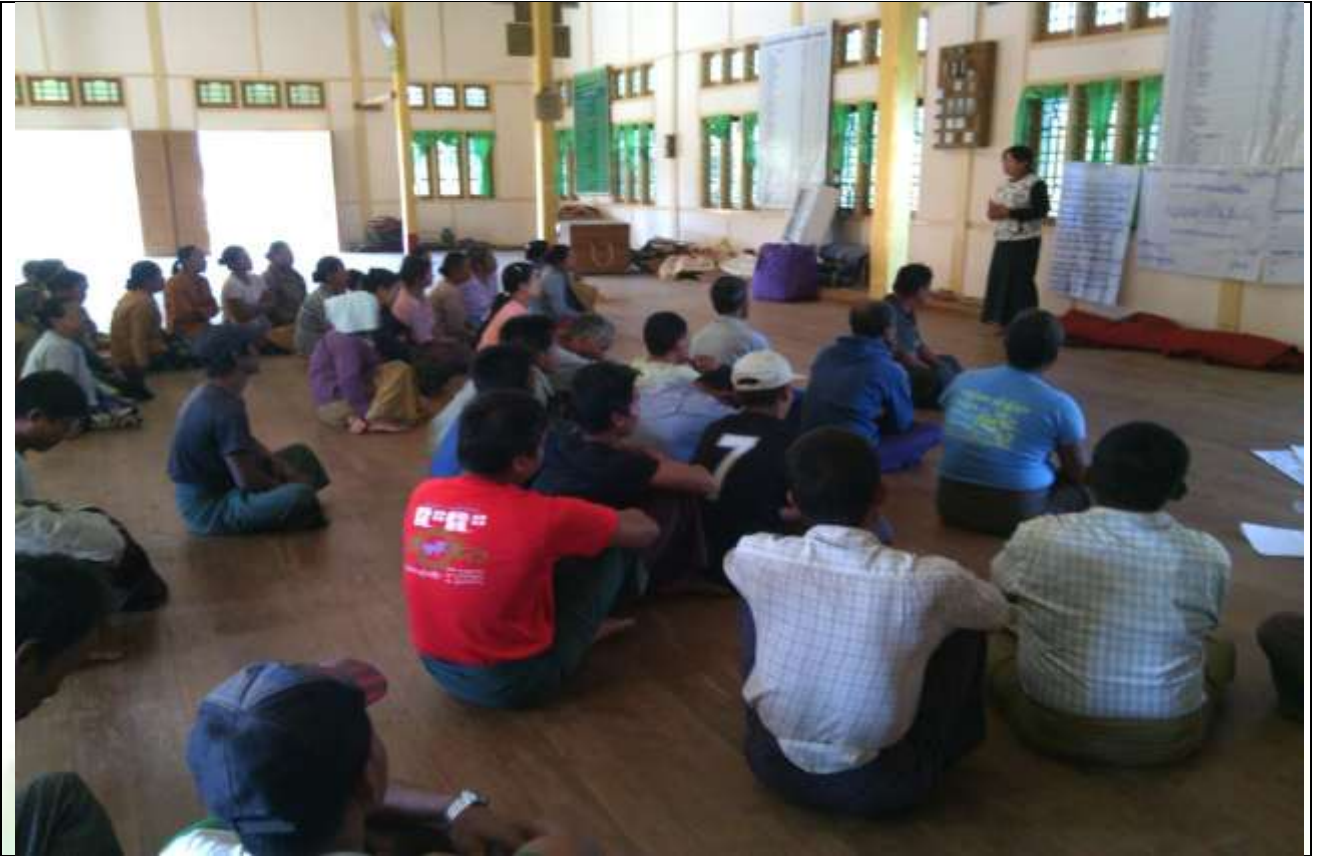
စေတနာ့ဝန်ထမ်းများ ရွေးချယ်ခြင်း မှတ်တမ်းဓါတ်ပုံ