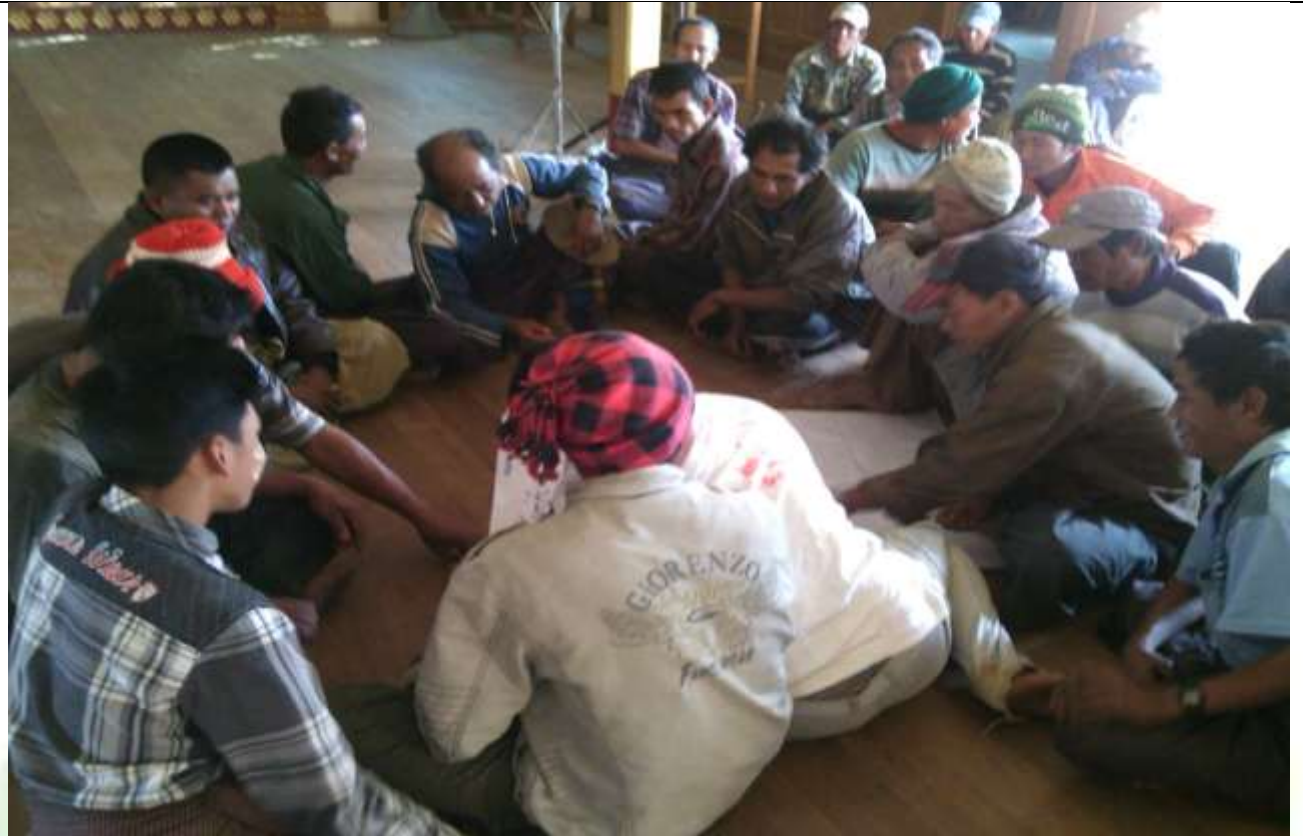
လူငယ်အုပ်စု၏ မှတ်တမ်းခါတ်ပုံ