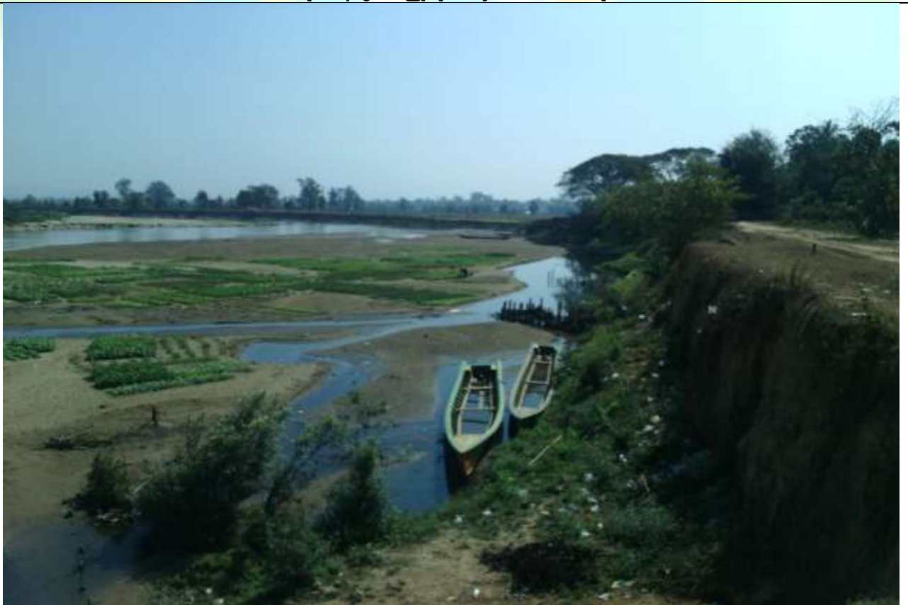
လုပ်ငန်းခွဲ၏မပြုလုပ်မီ မှတ်တမ်းဓာတ်ပုံ