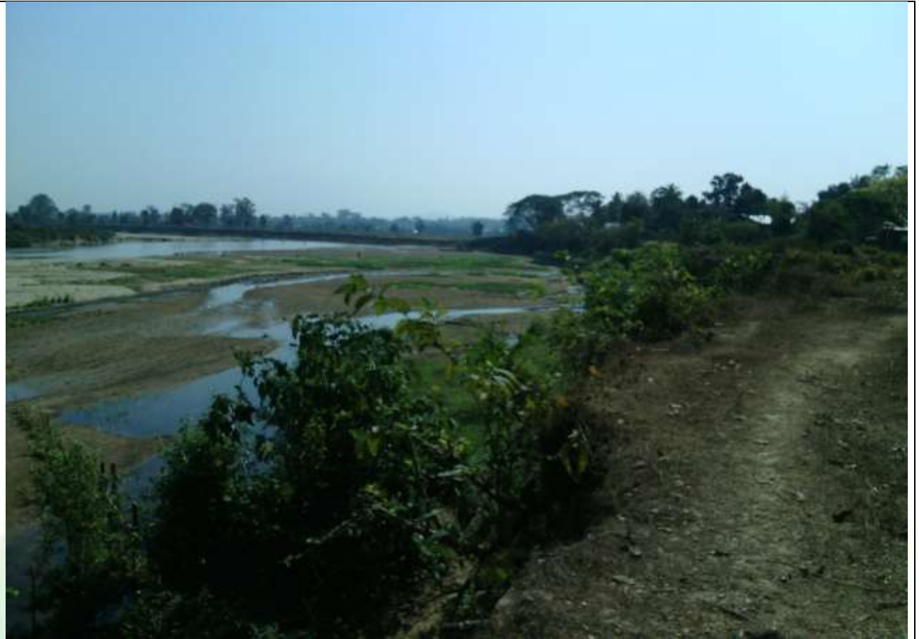
လုပ်ငန်းခွဲ၏မပြုလုပ်မီ မှတ်တမ်းဓာတ်ပုံ