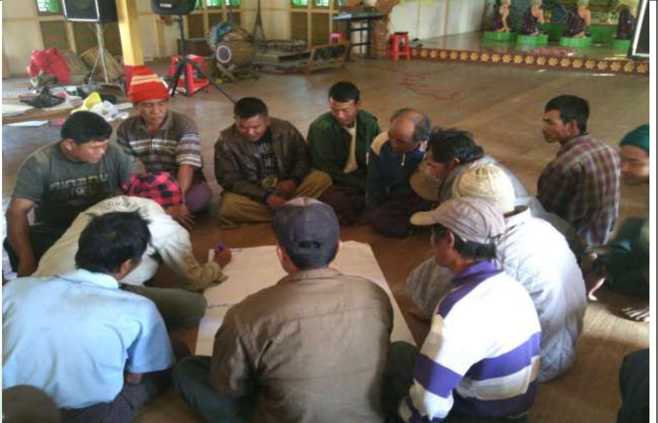
အမျိုးသားအုပ်စု၏ မှတ်တမ်းဓါတ်ပုံ