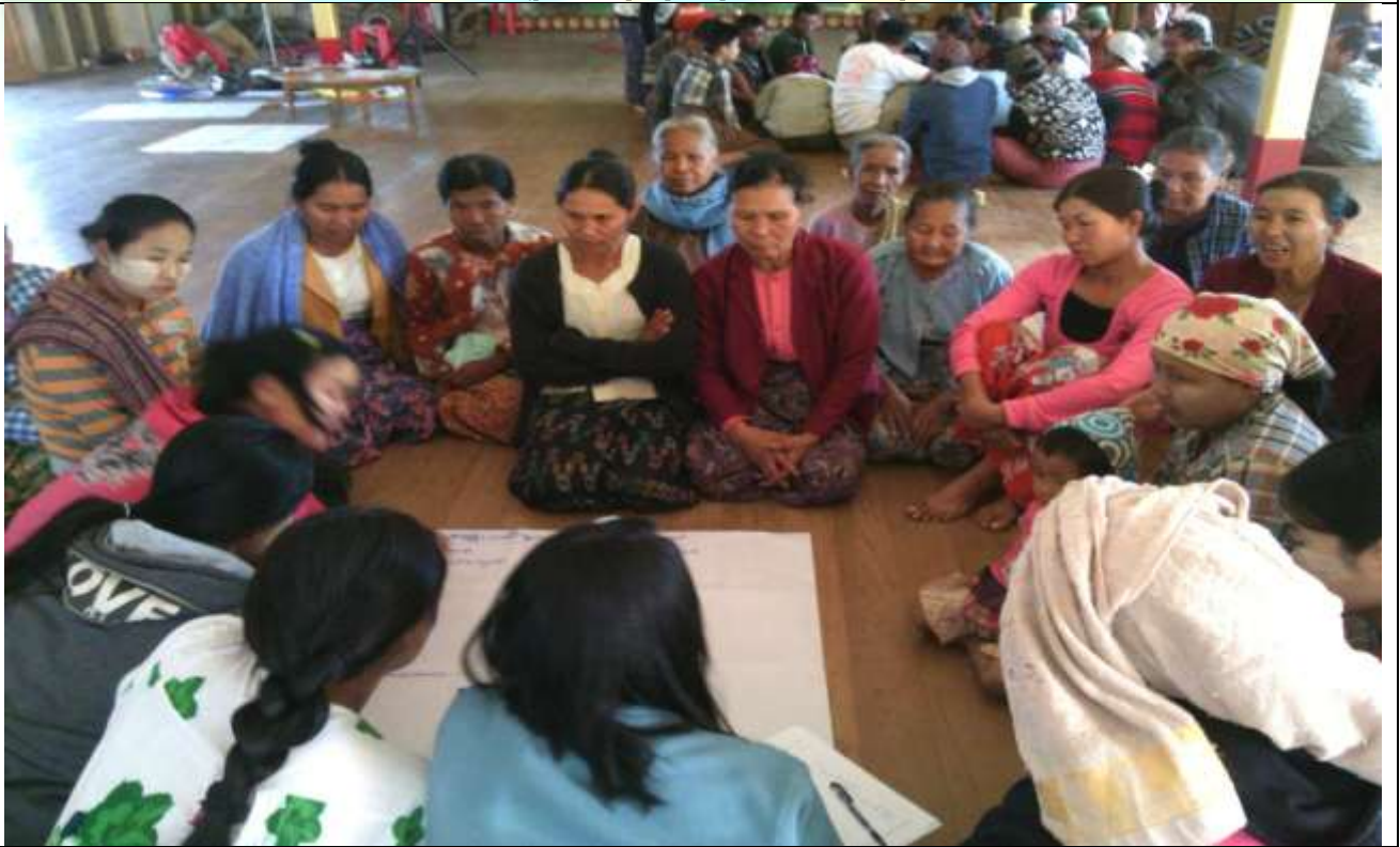
အမျိုးသမီးအုပ်စု၏ မှတ်တမ်းဓါတ်ပုံ