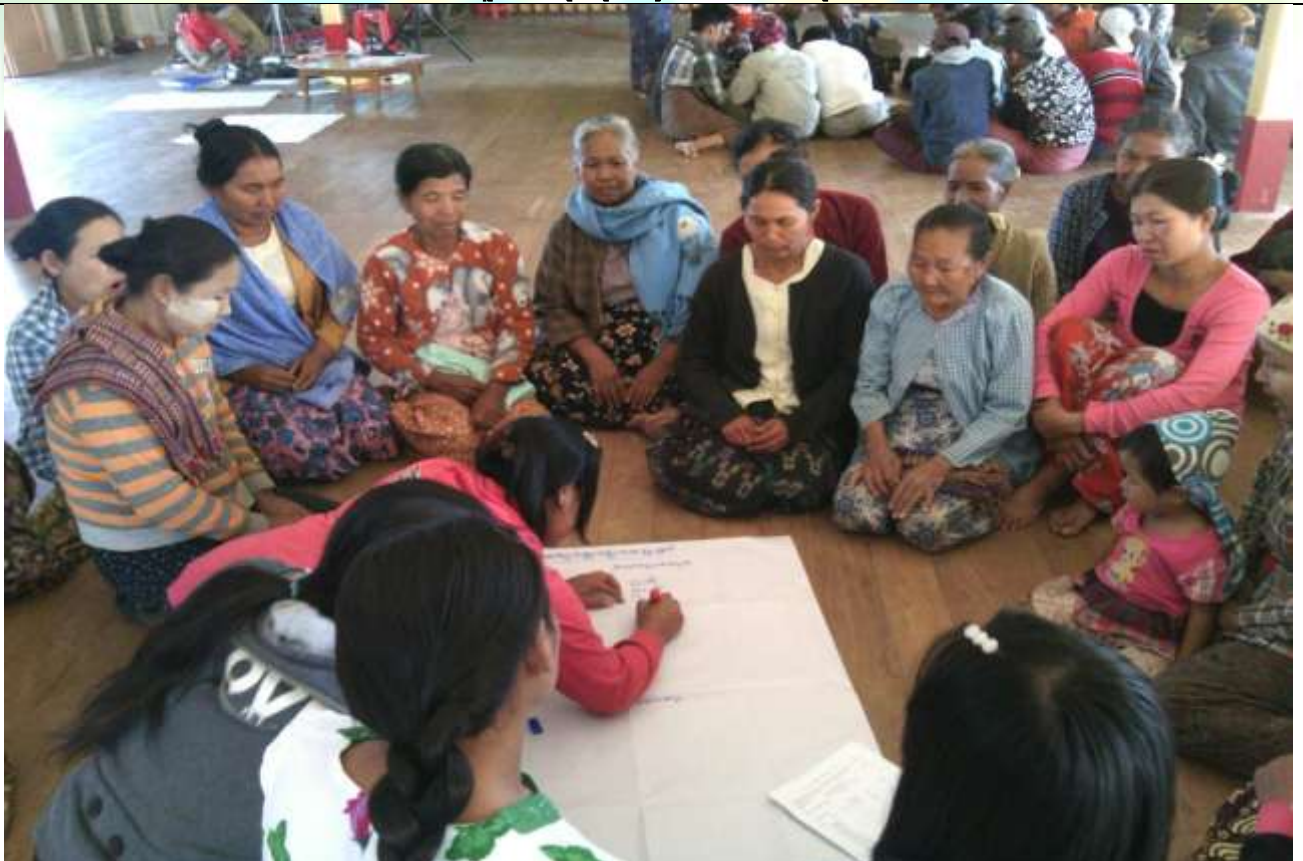
ထိခိုက်လွယ်အုပ်စုများ၏ မှတ်တမ်းခါတ်ပုံ