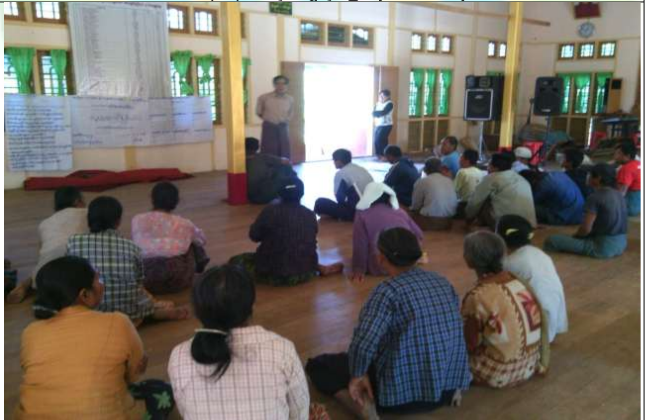
ကော်မတီရွေးချယ်ခြင်း မှတ်တမ်းဓါတ်ပုံ