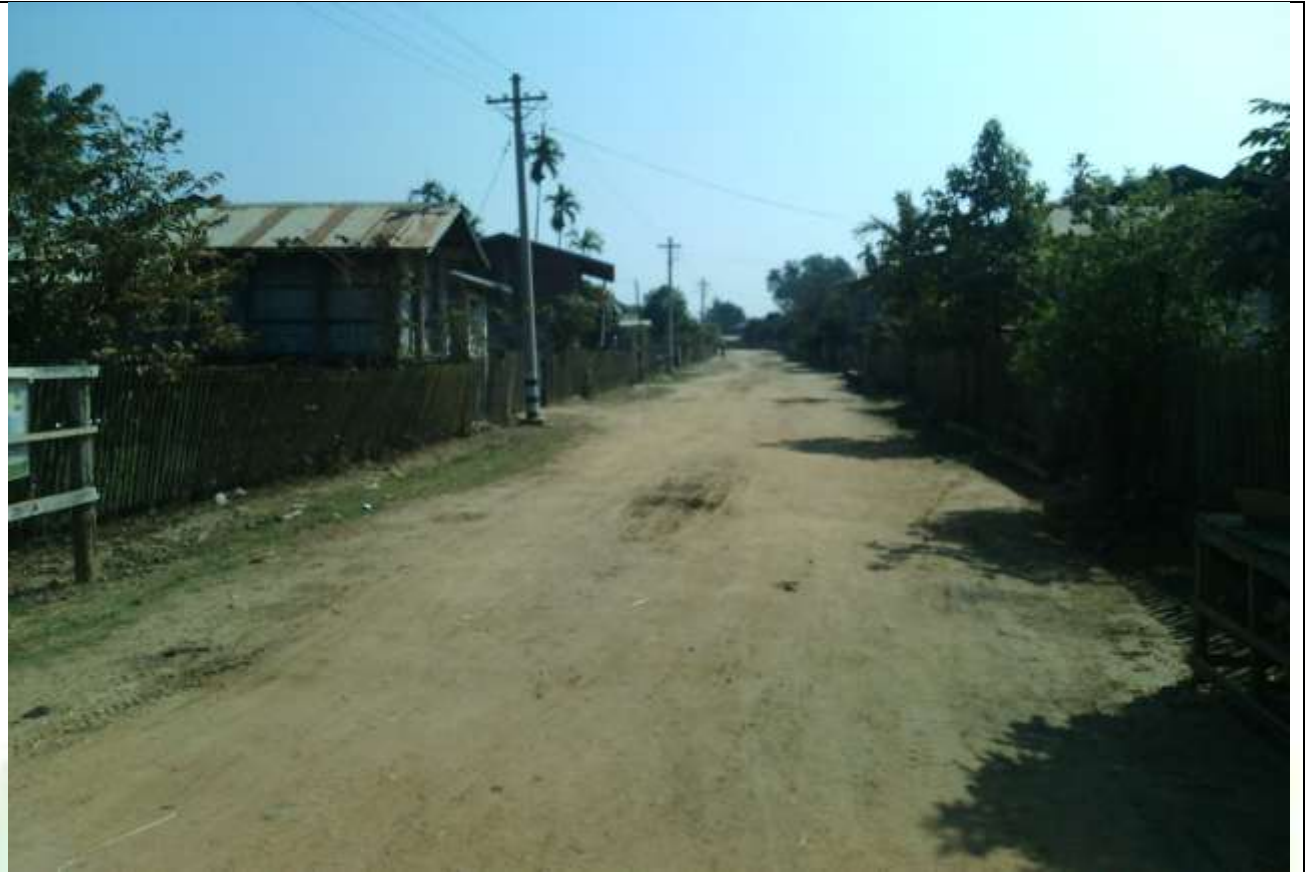
လုပ်ငန်းခွဲ၏မပြုလုပ်မီ မှတ်တမ်းခါတ်ပုံ