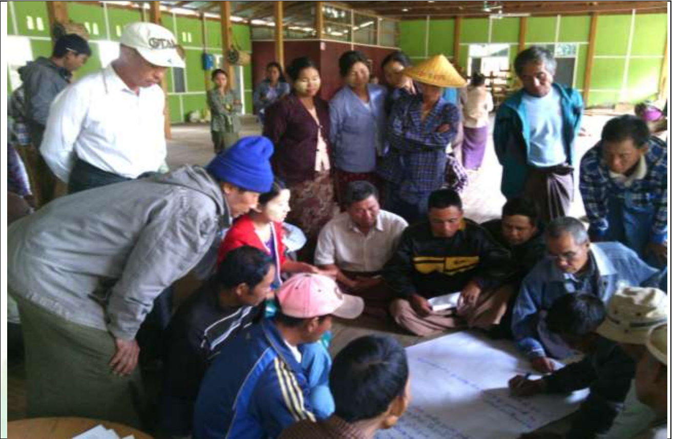
စေတနာ့ဝန်ထမ်းများ ရွေးချယ်ခြင်း မှတ်တမ်းဓါတ်ပုံ