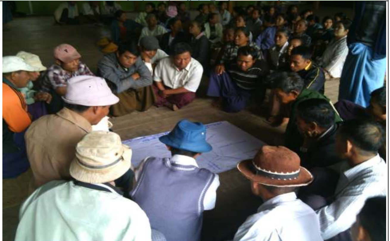
ကော်မတီရွေးချယ်ခြင်း မှတ်တမ်းဓါတ်ပုံ