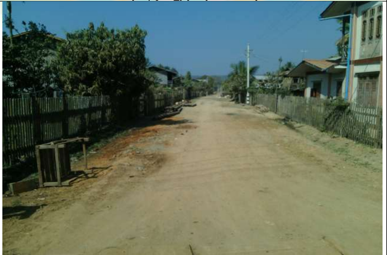
လုပ်ငန်းခွဲ၏မပြုလုပ်မီ မှတ်တမ်းခါတ်ပုံ