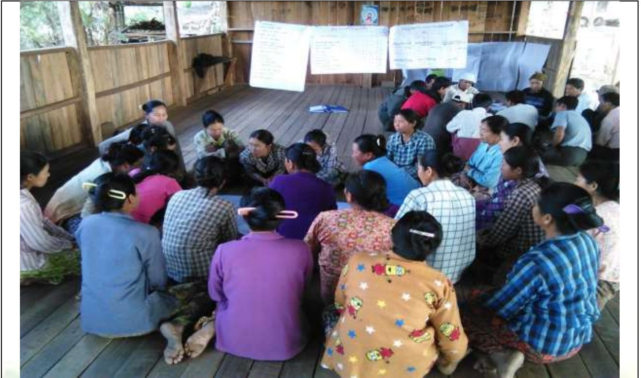
စေတနာ့ဝန်ထမ်းများ ရွေးချယ်ခြင်း မှတ်တမ်းခါတ်ပုံ