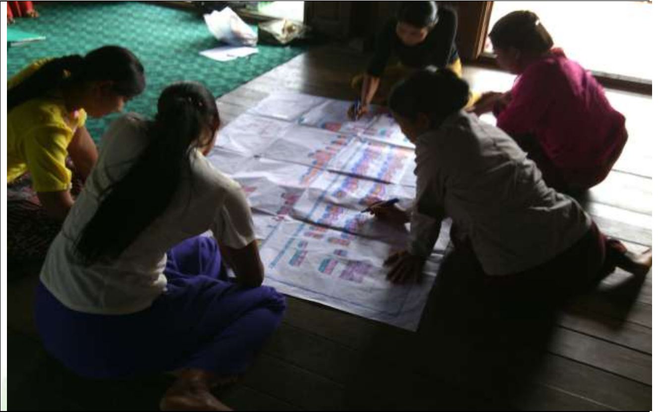
ဖွံ့ဖြိုးရေးအစီအစဉ်ရေးဆွဲခြင်း မှတ်တမ်းခါတ်ပုံ