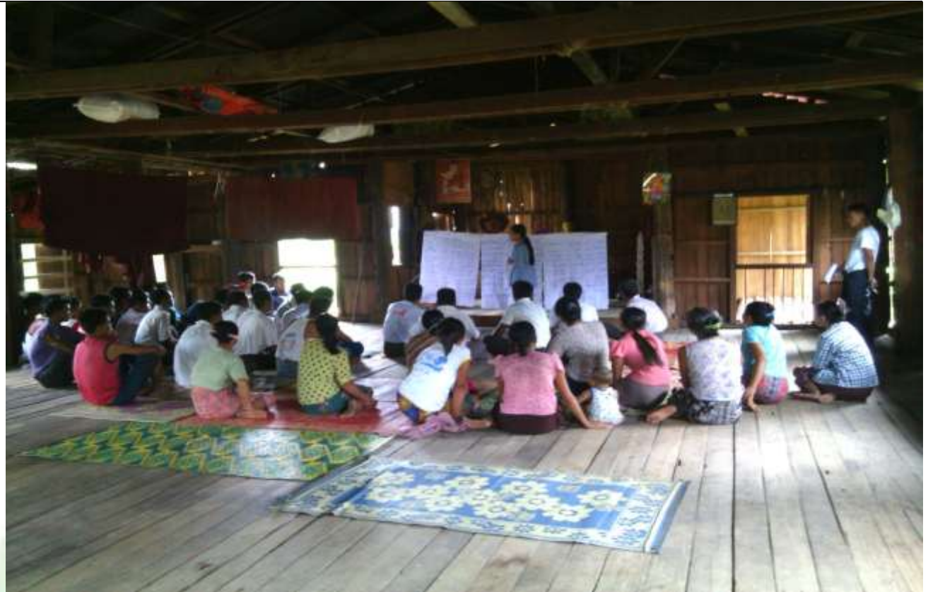
စေတနာ့ဝန်ထမ်းများ ရွေးချယ်ခြင်း မှတ်တမ်းခါတ်ပုံ