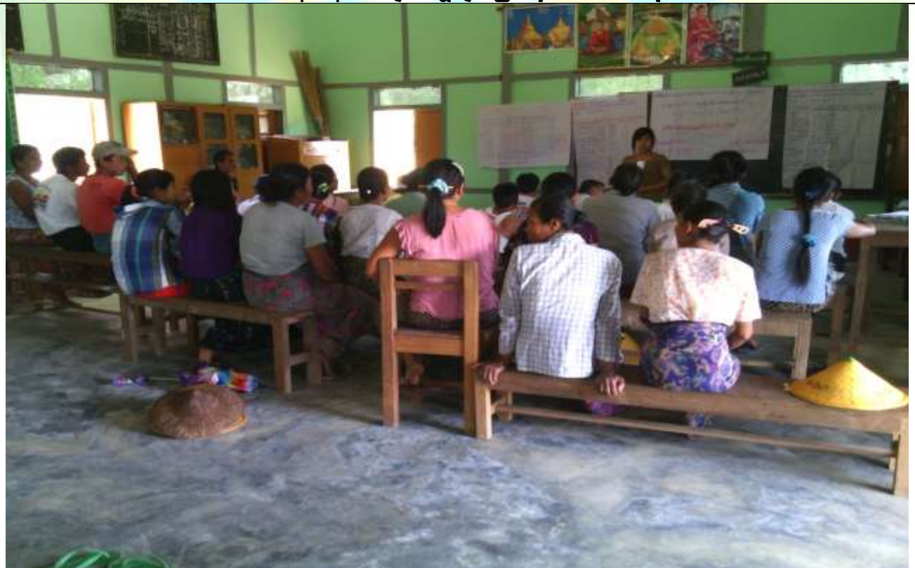
ကော်မတီရွေးချယ်ခြင်း မှတ်တမ်းခါတ်ပုံ