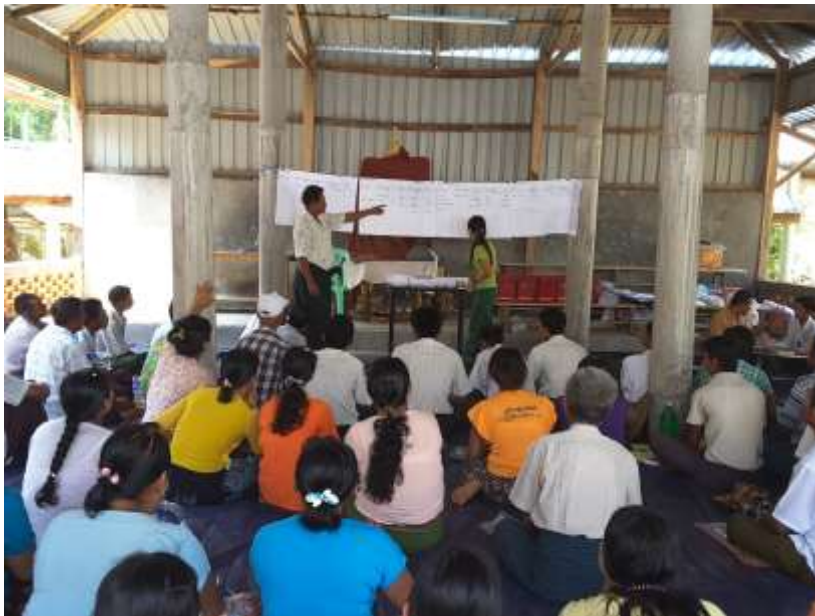
ဧရာဝတီတိုင်းဒေသကြီး၊သာပေါင်းမြို့နယ်၊ဆီဆုံအုပ်စု၊သောင်တန်းကျေးရွာတွင်အစည်းအဝေးကျင်းပပုံ။