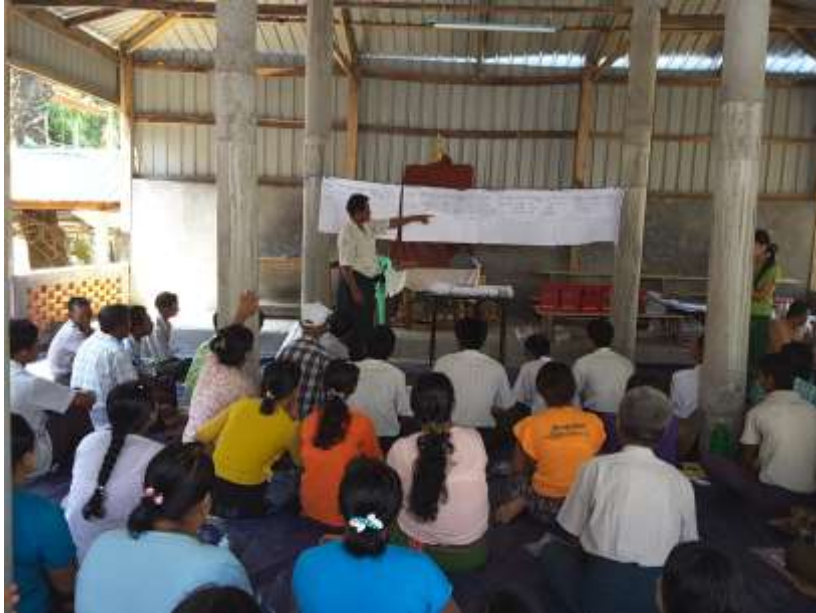
ဧရာဝတီတိုင်းဒေသကြီး၊သာပေါင်းမြို့နယ်၊ဆီဆုံအုပ်စု၊သောင်တန်းကျေးရွာတွင်အစည်းအဝေးကျင်းပပုံ။