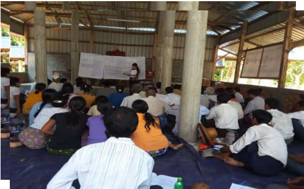
ဧရာဝတီတိုင်းဒေသကြီး၊သာပေါင်းမြို့နယ်၊ဆီဆုံအုပ်စု၊အောက်ဒယ်ကုန်းကျေးရွာတွင်အစည်းအဝေးပြုလုပ်နေပုံ