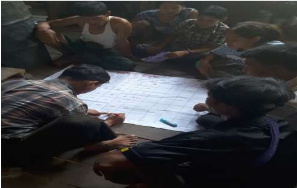
ဧရာဝတီတိုင်းဒေသကြီး၊သာပေါင်းမြို့နယ်၊ဆီဆုံအုပ်စု၊အောက်ဒယ်ကုန်းကျေးရွာတွင်အစည်းအဝေးပြုလုပ်နေပုံ