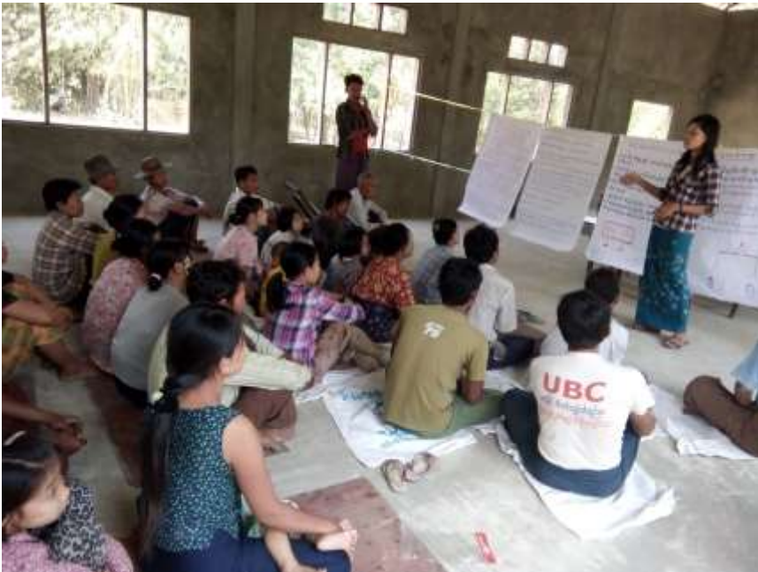
ပိန္နဲကုန်းကျေးရွာတွင် အစည်းအဝေးကျင်းပနေပုံ