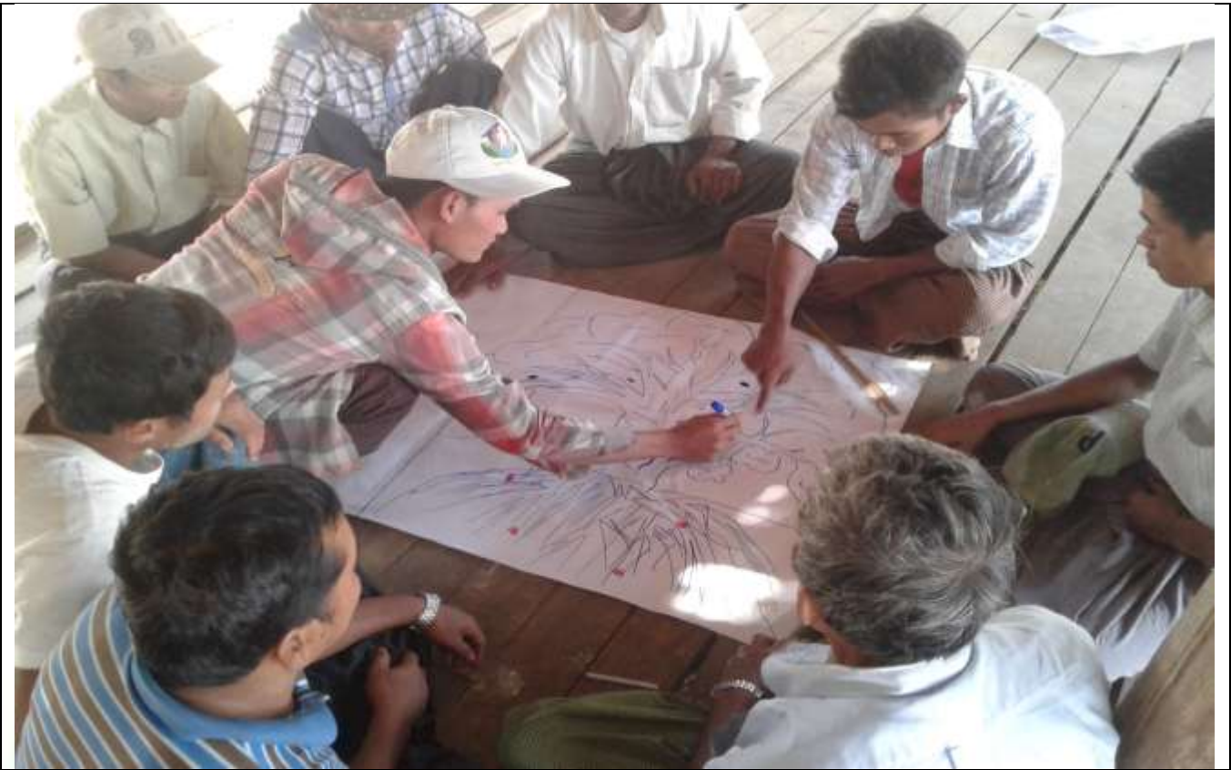
လူငယ်အုပ်စု၏ မှတ်တမ်းခါတ်ပုံ