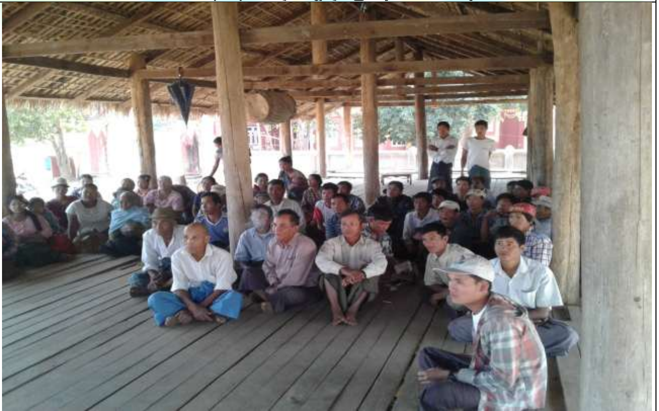
ကော်မတီရွေးချယ်ခြင်း မှတ်တမ်းဓာတ်ပုံ