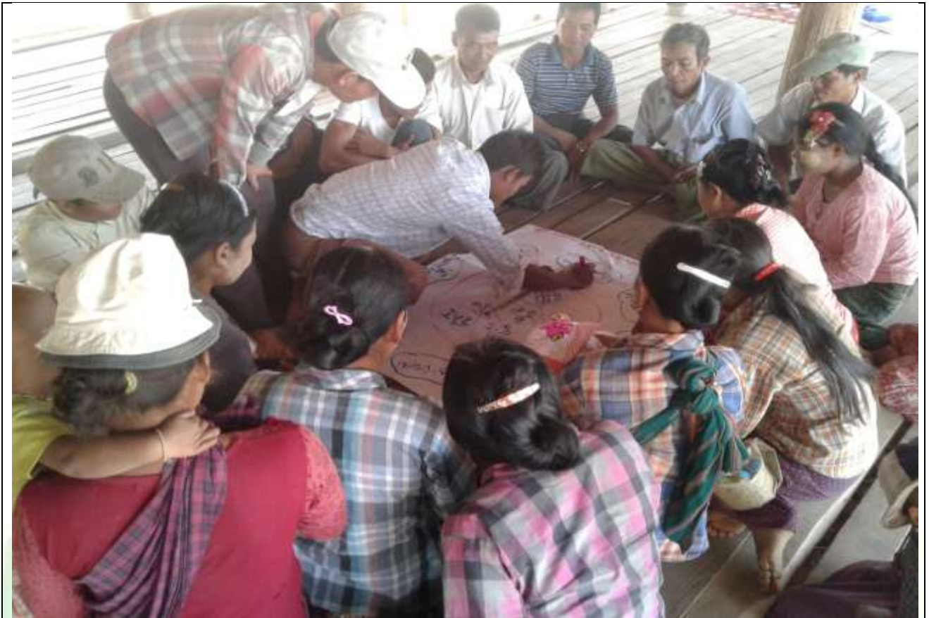
ဖွံ့ဖြိုးရေးအစီအစဉ်ရေးဆွဲခြင်း မှတ်တမ်းဓာတ်ပုံ