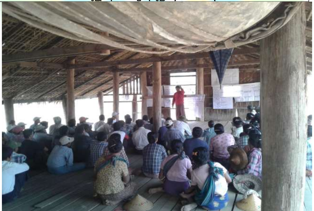
ဖွံ့ဖြိုးရေးအစီအစဉ်ရေးဆွဲခြင်း မှတ်တမ်းဓာတ်ပုံ