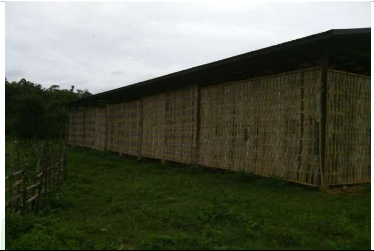
စီမံကိန်း ပထမနှစ် လုပ်ငန်းခွဲမဆောင်ရွက်မီ မှတ်တမ်းဓာတ်ပုံ