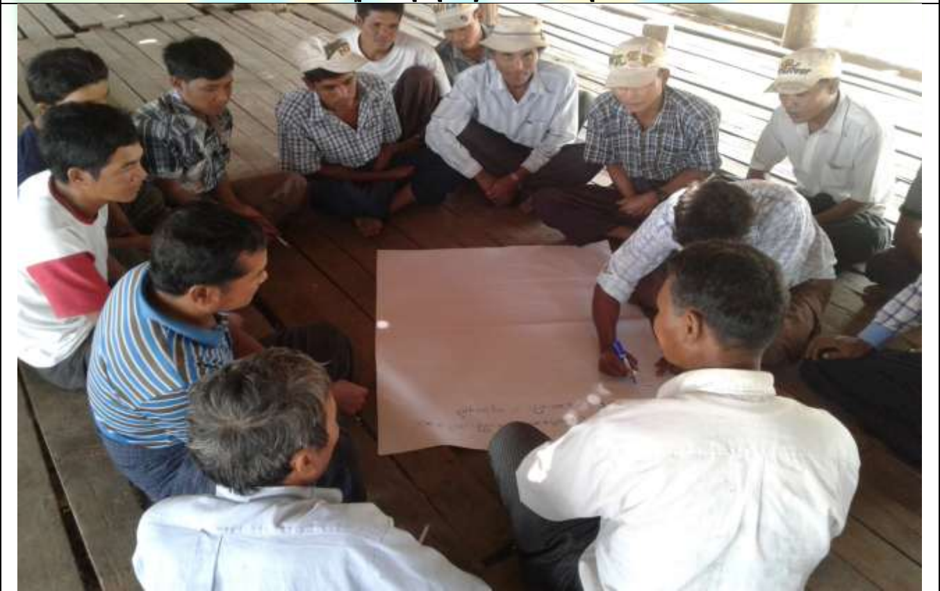
ထိခိုက်လွယ်အုပ်စုများ၏ မှတ်တမ်းခါတ်ပုံ