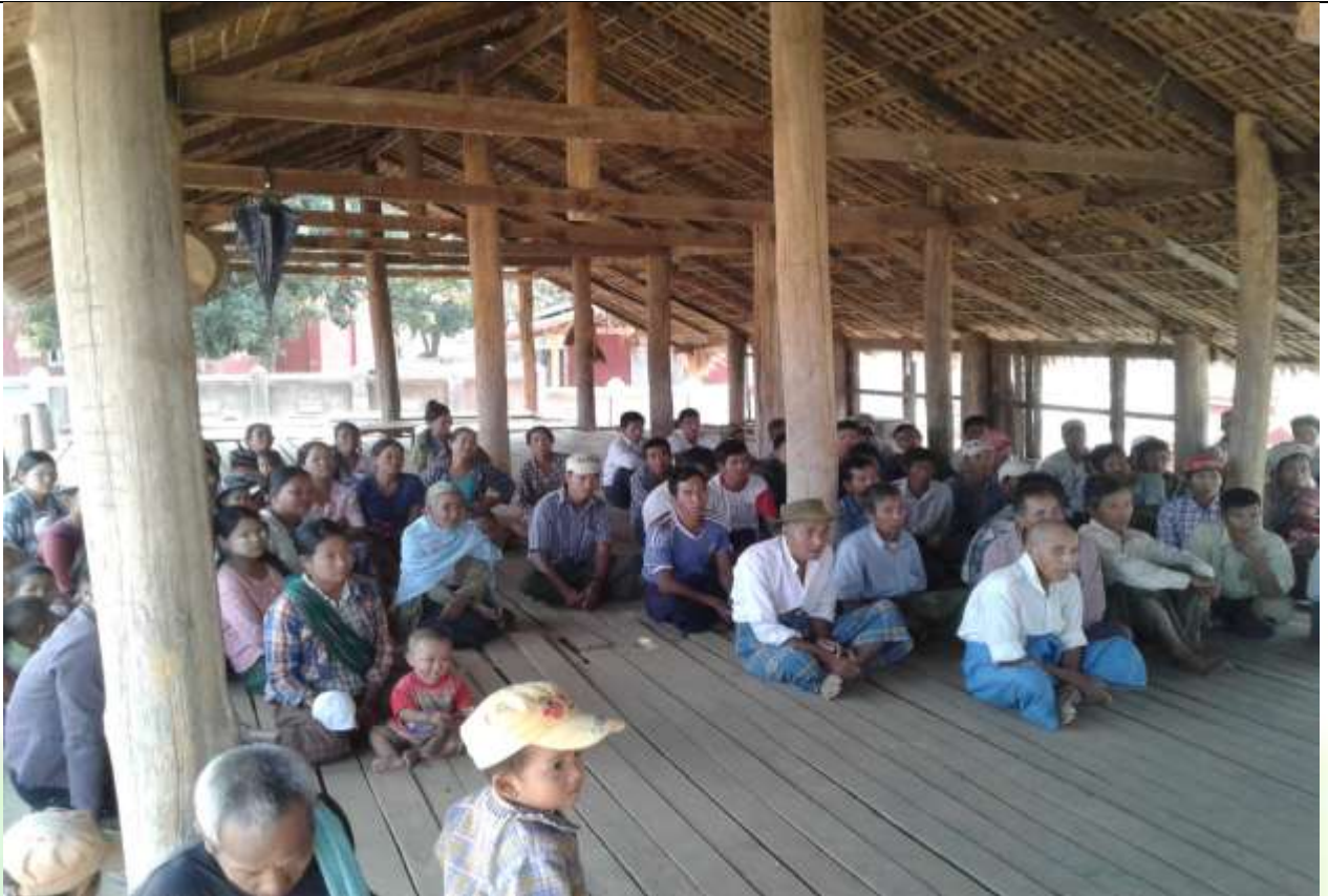
စေတနာ့ဝန်ထမ်းများ ရွေးချယ်ခြင်း မှတ်တမ်းဓာတ်ပုံ