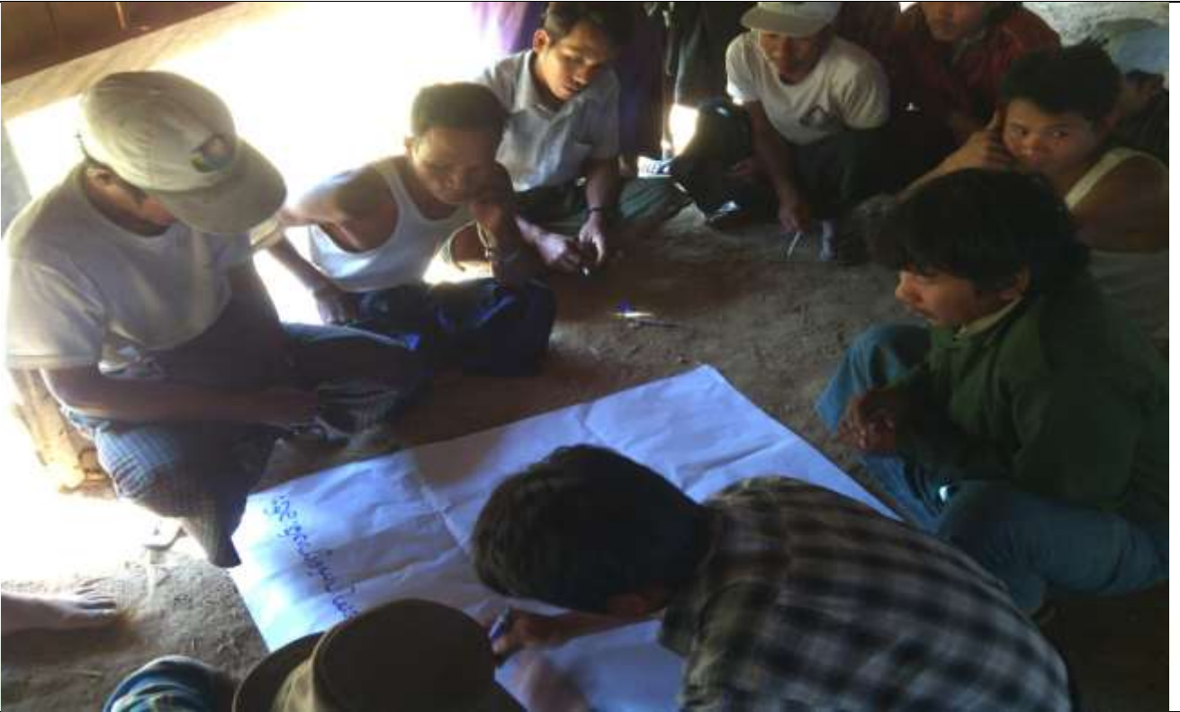
အမျိုးသားအုပ်စု၏ မှတ်တမ်းခါတ်ပုံ