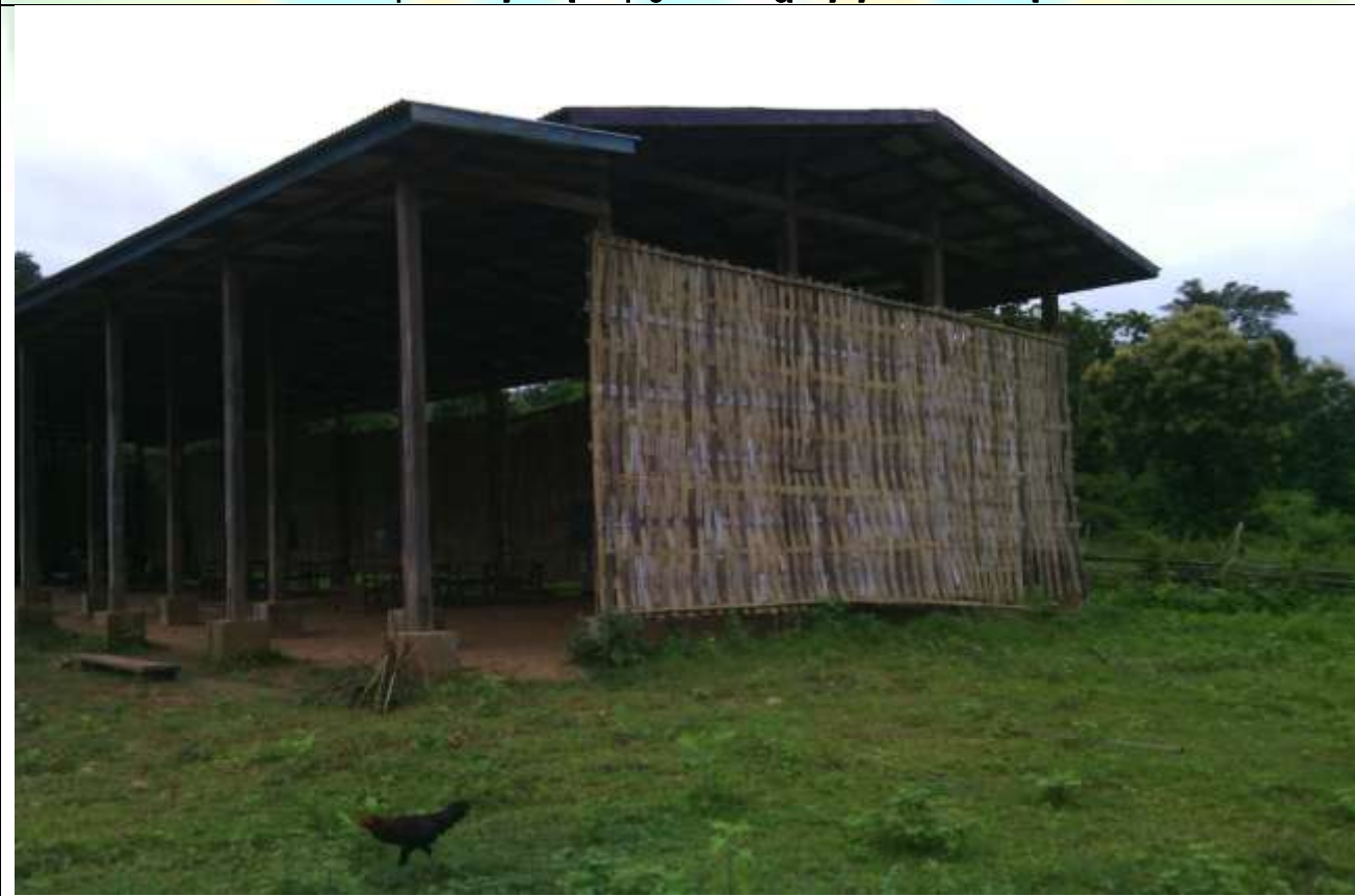
စီမံကိန်း ပထမနှစ် လုပ်ငန်းခွဲမဆောင်ရွက်မီ မှတ်တမ်းဓာတ်ပုံ