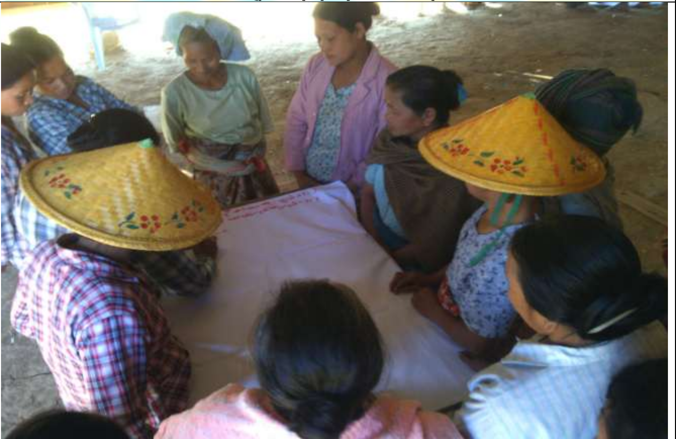
အမျိုးသမီးအုပ်စု၏ မှတ်တမ်းခါတ်ပုံ