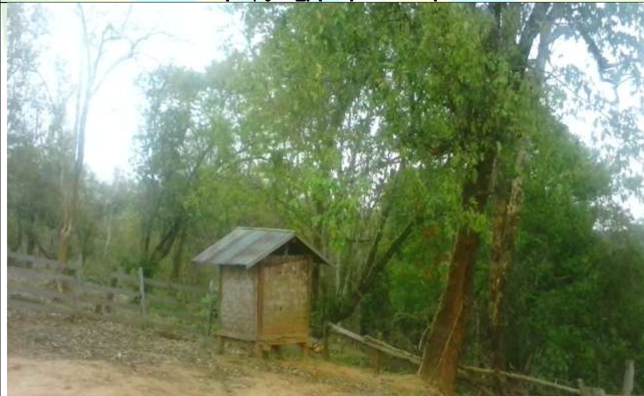
လုပ်ငန်းခွဲ၏မပြုလုပ်မီ မှတ်တမ်းခါတ်ပုံ