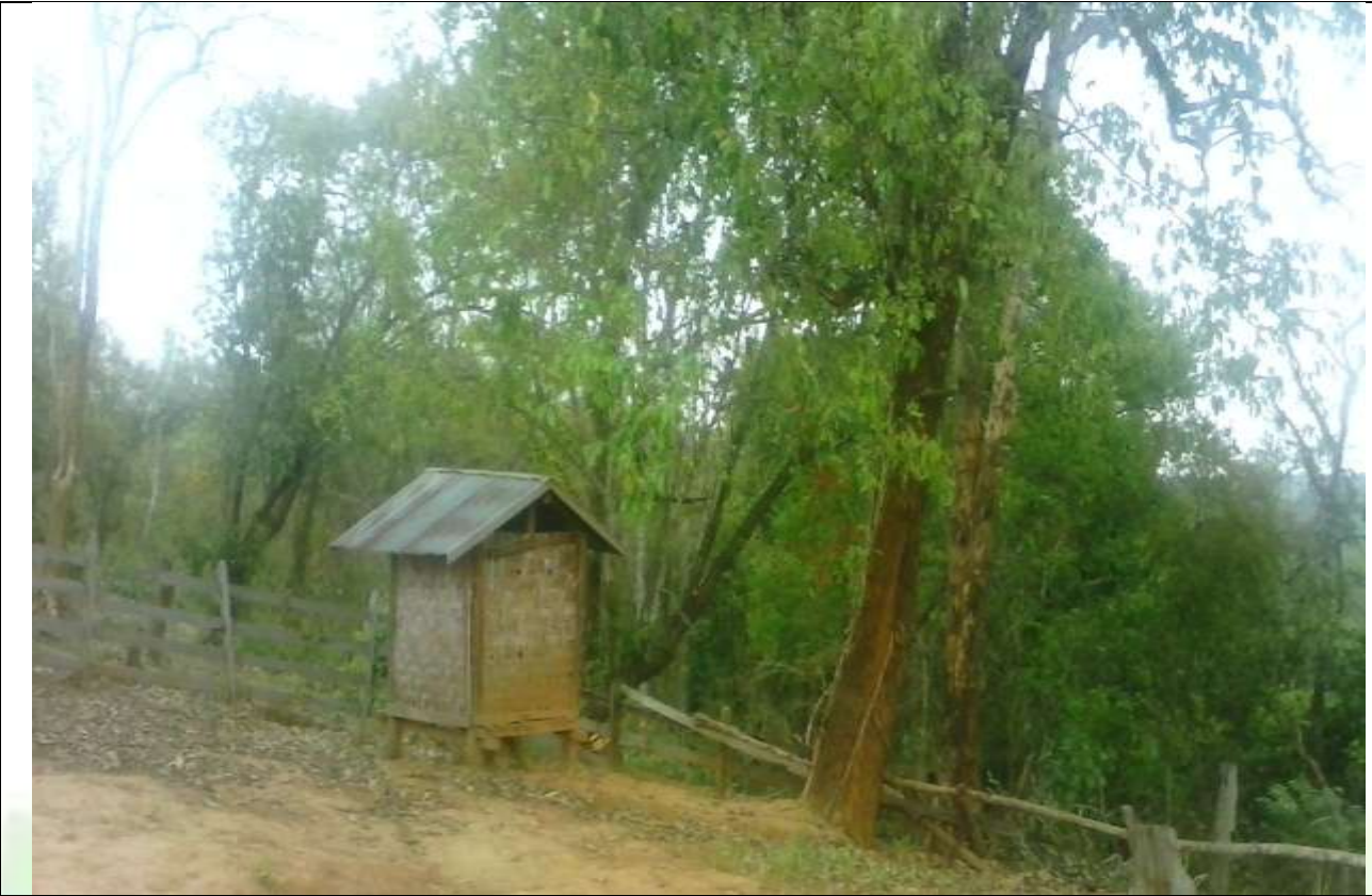
လုပ်ငန်းခွဲ၏မပြုလုပ်မီ မှတ်တမ်းခါတ်ပုံ