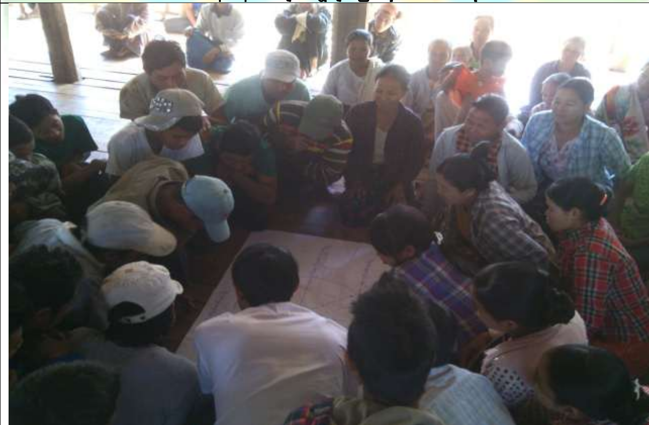
ကော်မတီရွေးချယ်ခြင်း မှတ်တမ်းခါတ်ပုံ