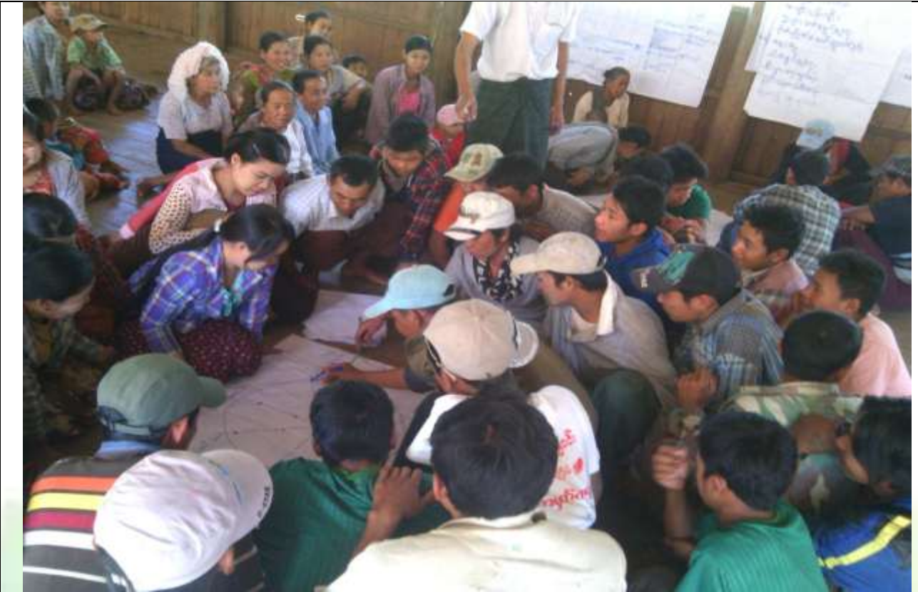
စေတနာ့ဝန်ထမ်းများ ရွေးချယ်ခြင်း မှတ်တမ်းခါတ်ပုံ