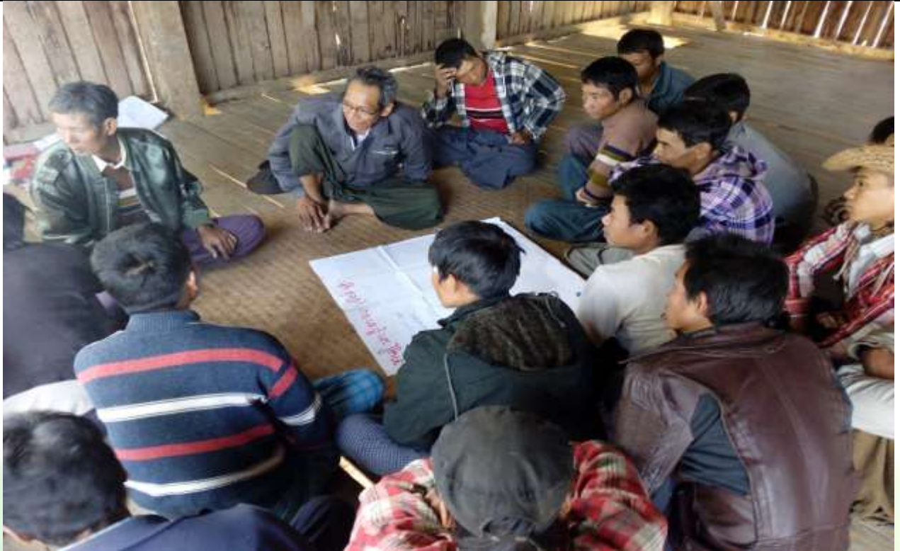
အမျိုးသားအုပ်စု၏ မှတ်တမ်းခါတ်ပုံ