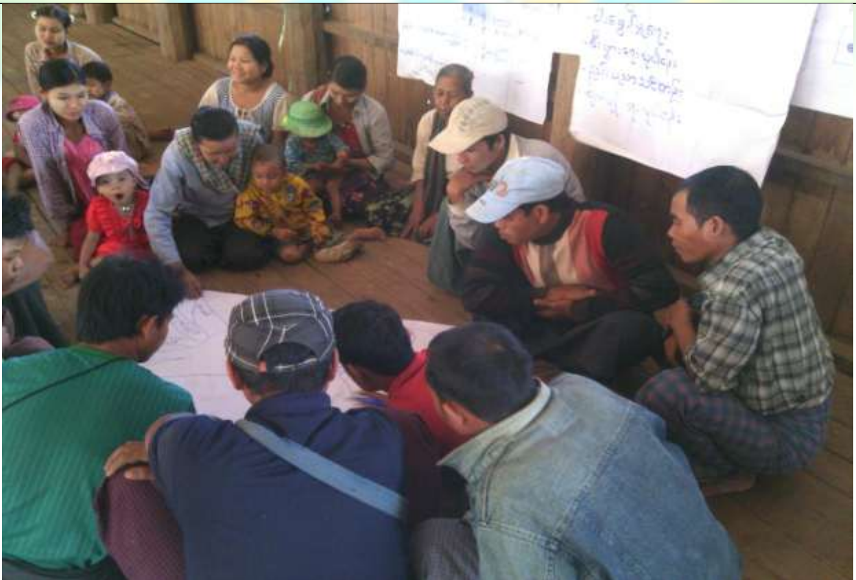
ကော်မတီရွေးချယ်ခြင်း မှတ်တမ်းဓါတ်ပုံ