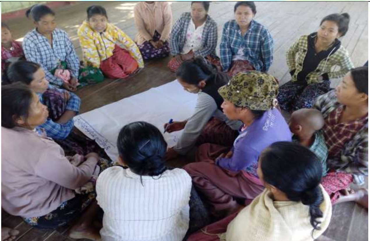
အမျိုးသမီးအုပ်စု၏ မှတ်တမ်းခါတ်ပုံ