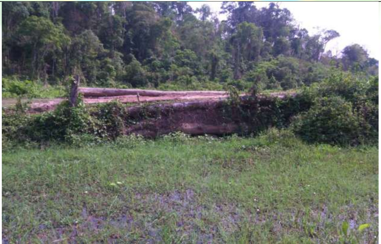
လုပ်ငန်းခွဲ၏မပြုလုပ်မီ မှတ်တမ်းဓာတ်ပုံ