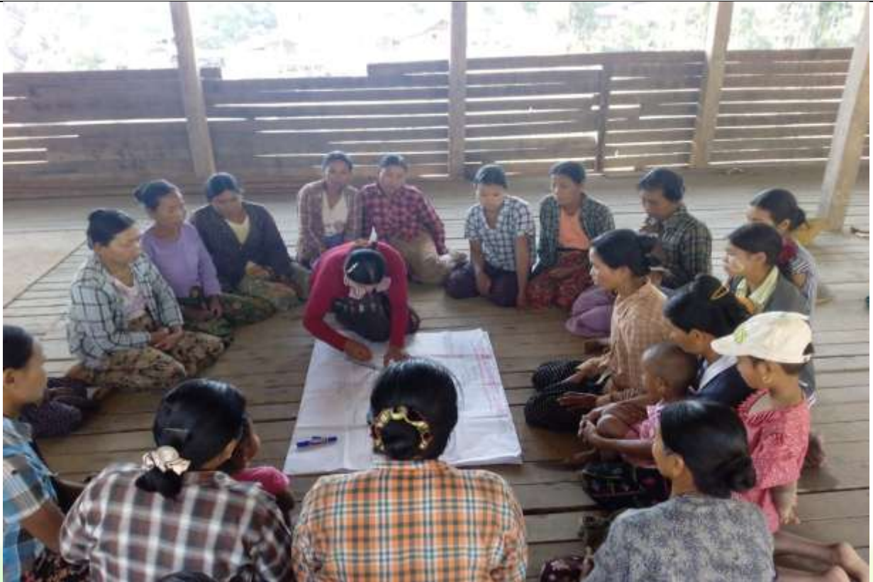
စေတနာ့ဝန်ထမ်းများ ရွေးချယ်ခြင်း မှတ်တမ်းဓါတ်ပုံ