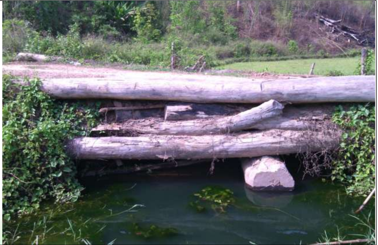
လုပ်ငန်းခွဲ၏မပြုလုပ်မီ မှတ်တမ်းဓာတ်ပုံ