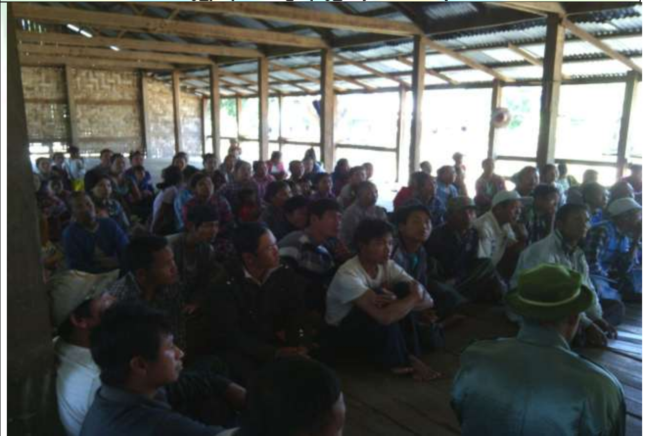
ဖွံ့ဖြိုးရေးအစီအစဉ်ရေးဆွဲခြင်း မှတ်တမ်းဓါတ်ပုံ