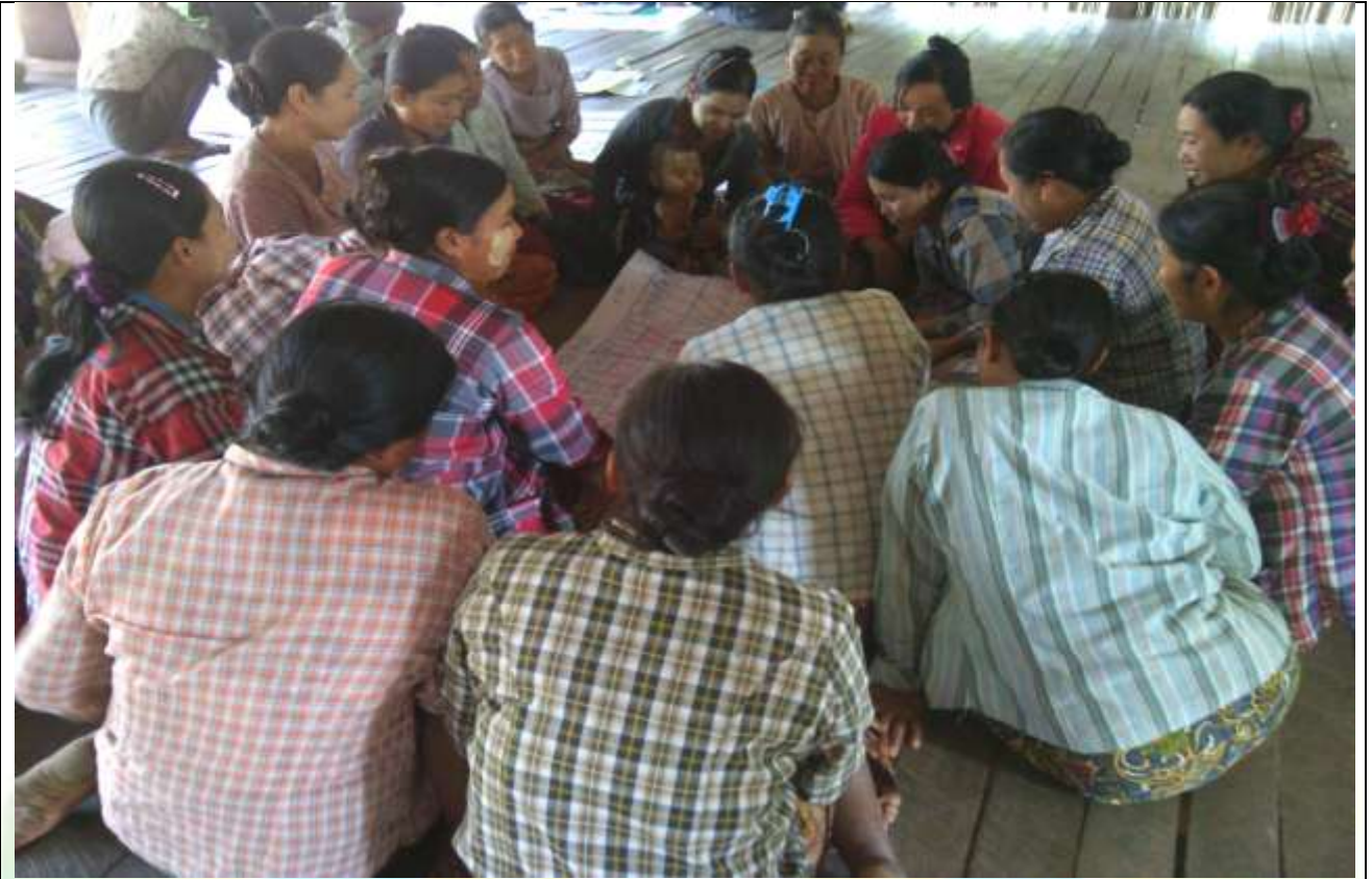
ဖွံ့ဖြိုးရေးအစီအစဉ်ရေးဆွဲခြင်း မှတ်တမ်းဓါတ်ပုံ