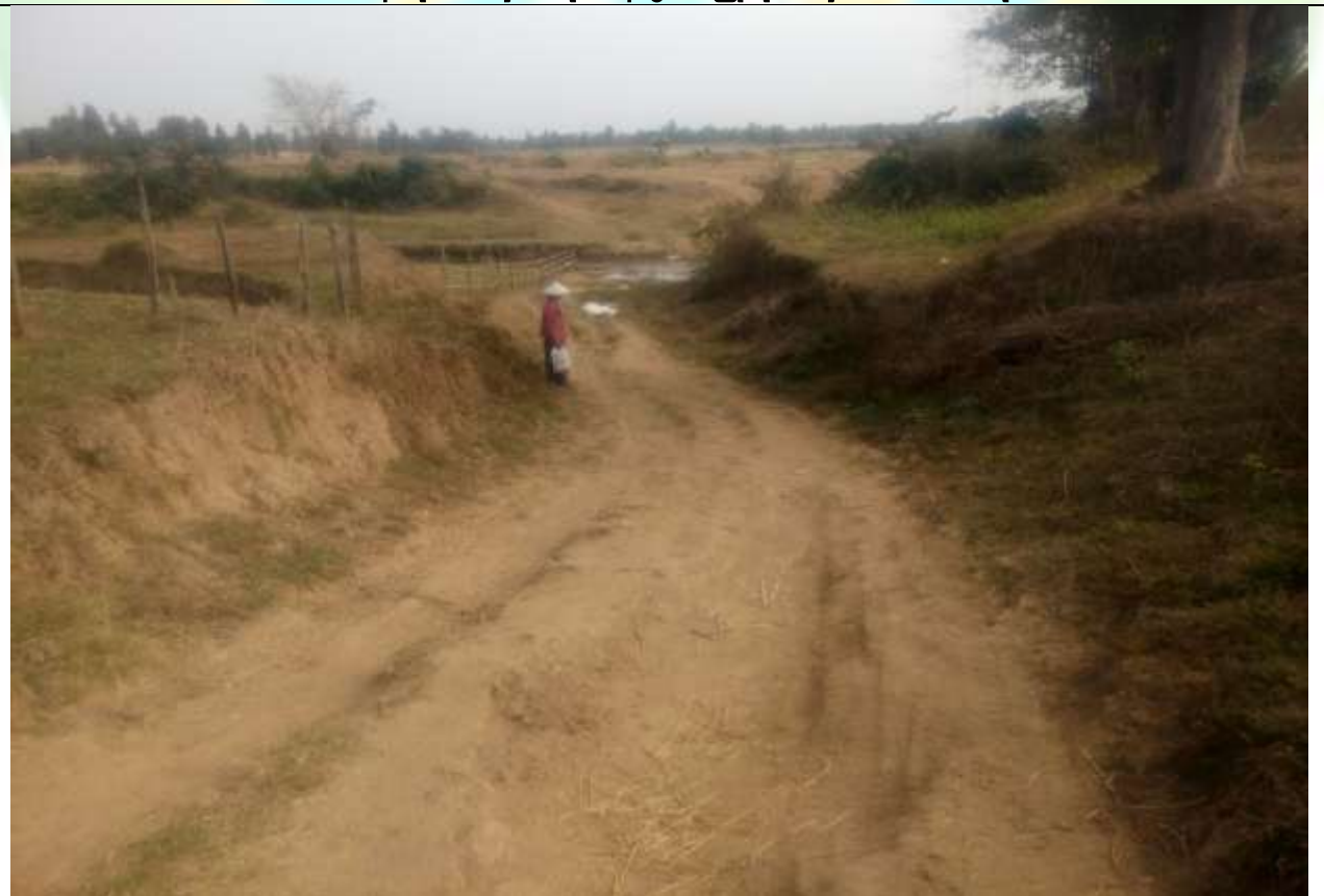
စီမံကိန်း ဒုတိယနှစ် လုပ်ငန်းခွဲ၏မပြုလုပ်မီ မှတ်တမ်းဓာတ်ပုံ