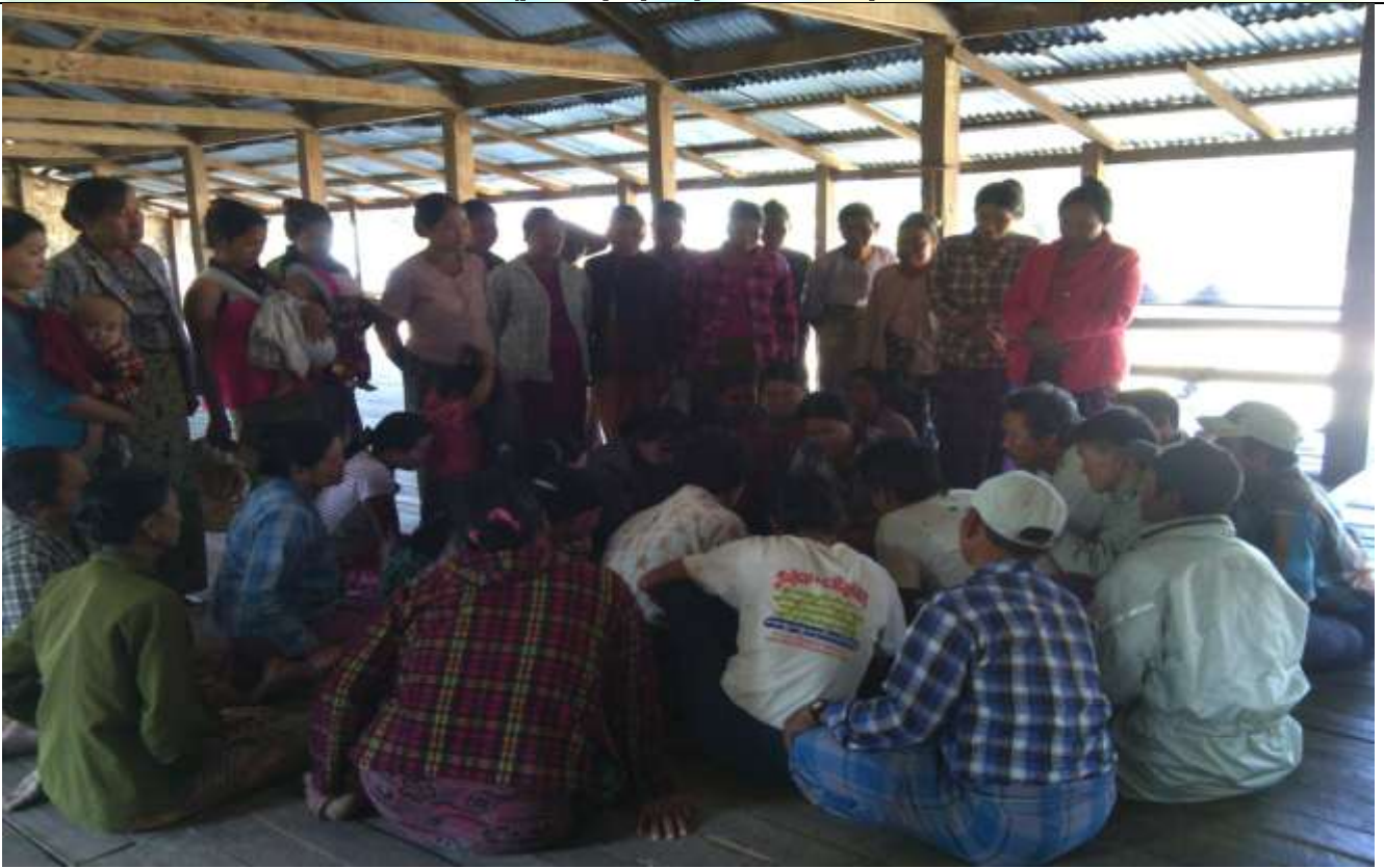
ထိခိုက်လွယ်အုပ်စုများ၏ မှတ်တမ်းခါတ်ပုံ