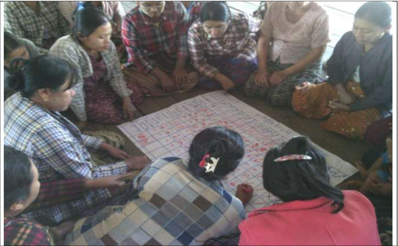
လူငယ်အုပ်စု၏ မှတ်တမ်းခါတ်ပုံ