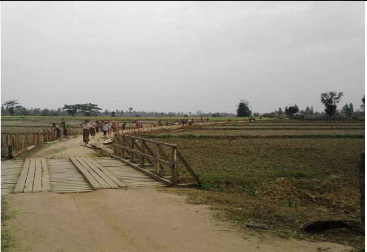
စီမံကိန်း ဒုတိယနှစ် လုပ်ငန်းခွဲ၏မပြုလုပ်မီ မှတ်တမ်းဓာတ်ပုံ