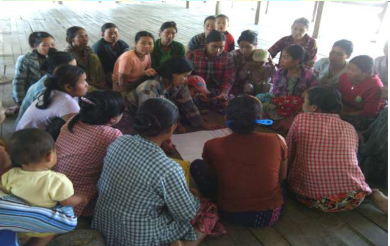
အမျိုးသမီးအုပ်စု၏ မှတ်တမ်းဓာတ်ပုံ