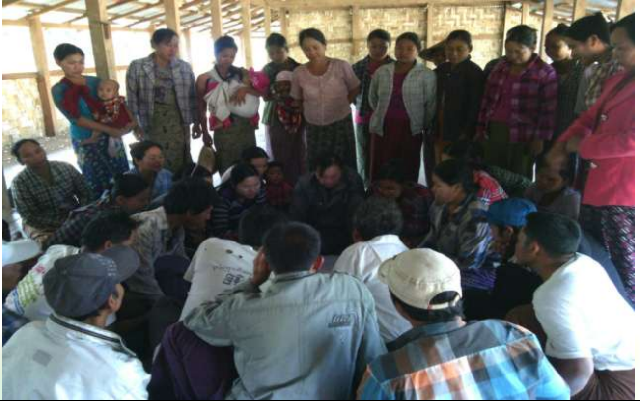
အမျိုးသားအုပ်စု၏ မှတ်တမ်းဓာတ်ပုံ