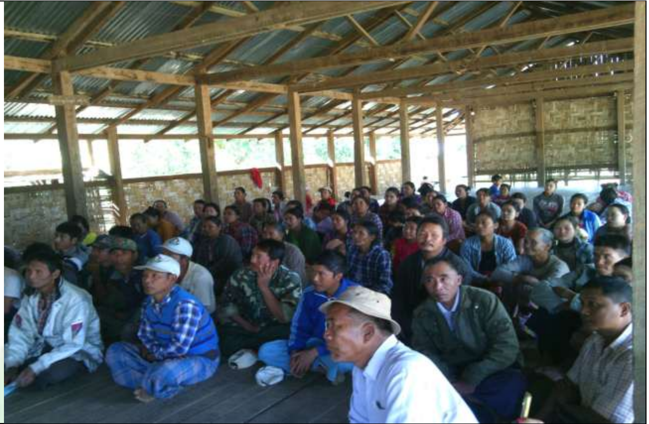
စေတနာ့ဝန်ထမ်းများ ရွေးချယ်ခြင်း မှတ်တမ်းဓါတ်ပုံ