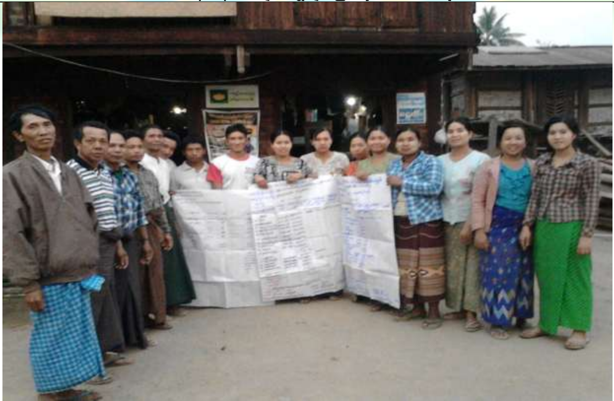
ကော်မတီရွေးချယ်ခြင်း မှတ်တမ်းဓါတ်ပုံ